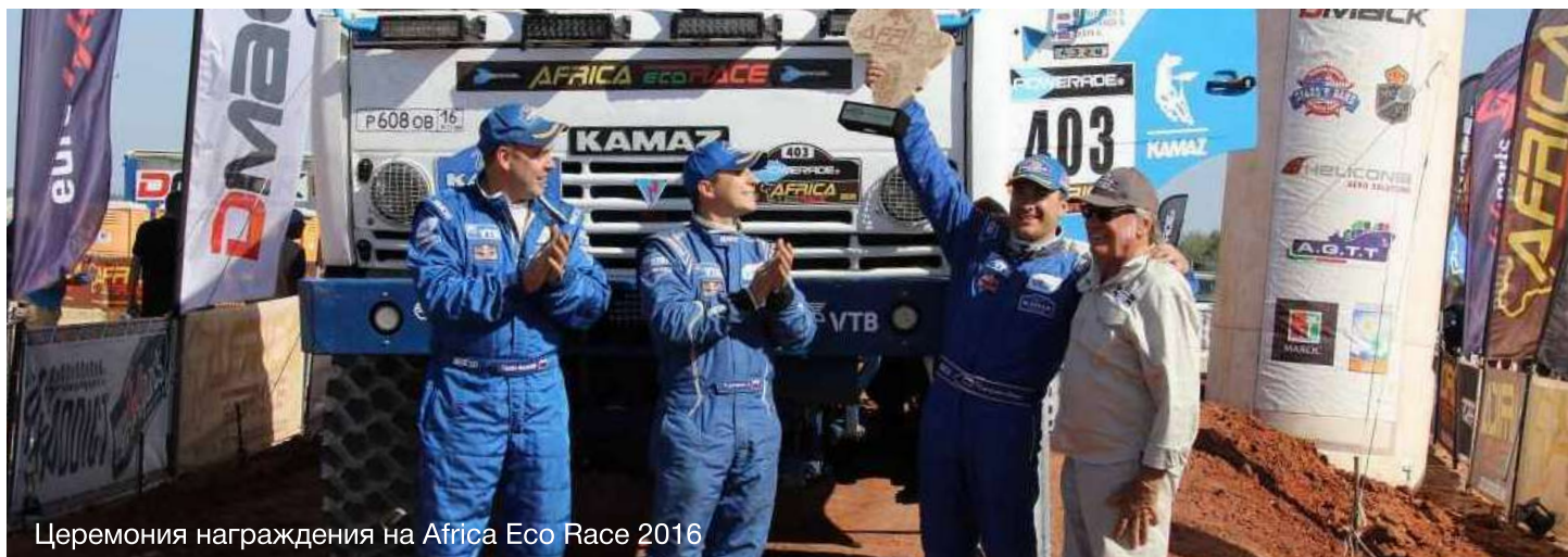
Церемония награждения на Africa Eco Race 2016