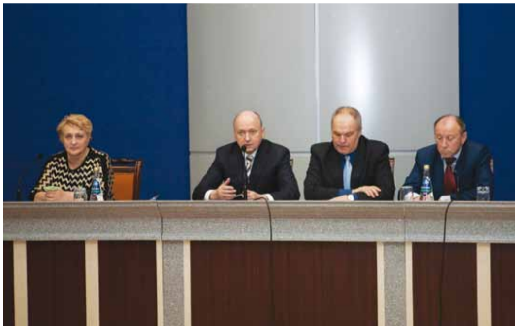
Подведение итогов пятилетней работы ППО Администрации