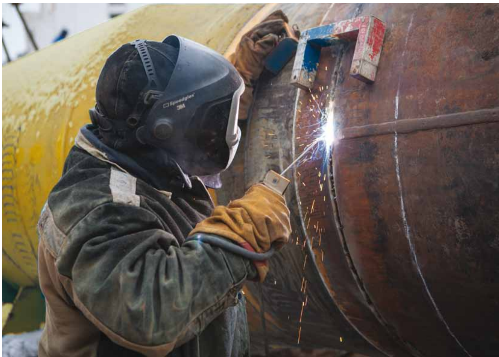
Огневые работы на газопроводе «Сторожевка-Петровск»