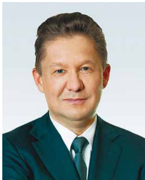
А.Б. МИЛЛЕР, Председатель Правления ПАО «Газпром»