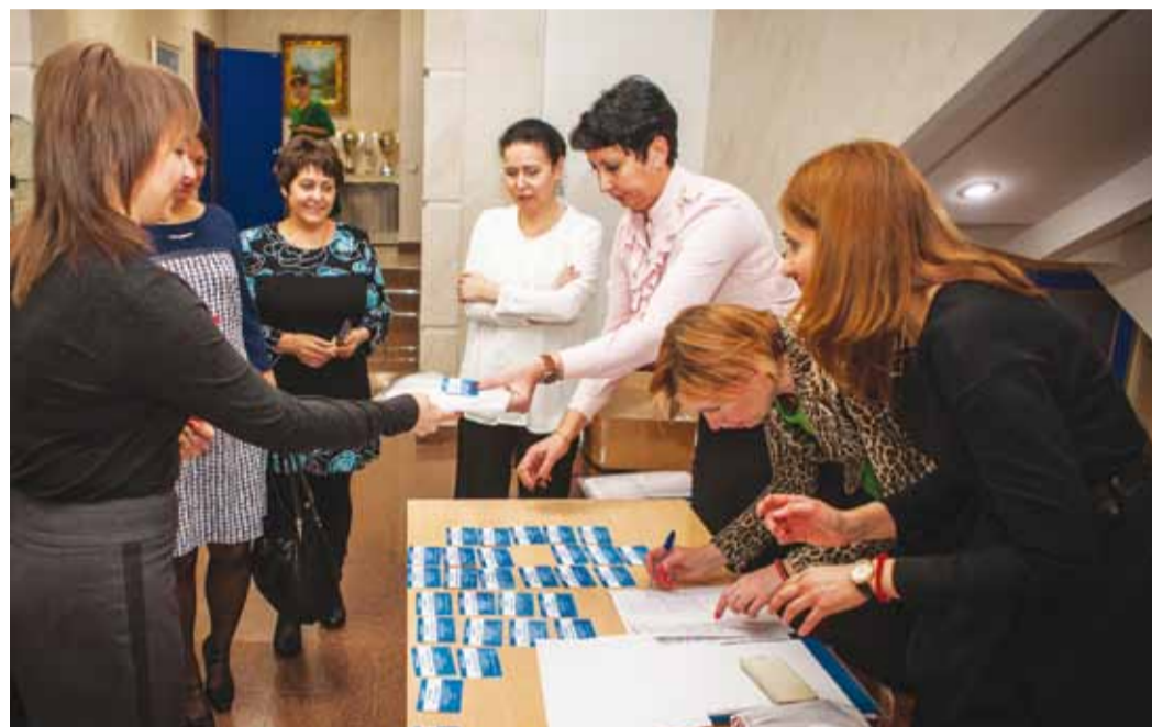
Регистрация участников отчетно-выборной конференции ППО Администрации