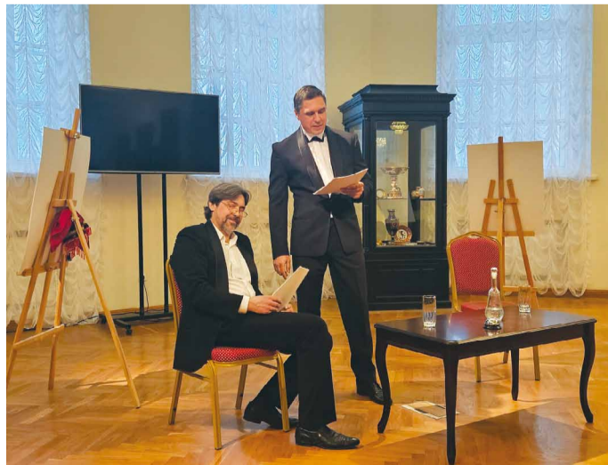
Оригинальный формат интересен и самим актерам