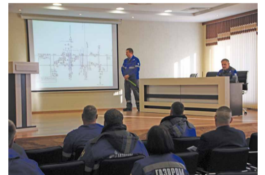
Заседание штаба КЧС