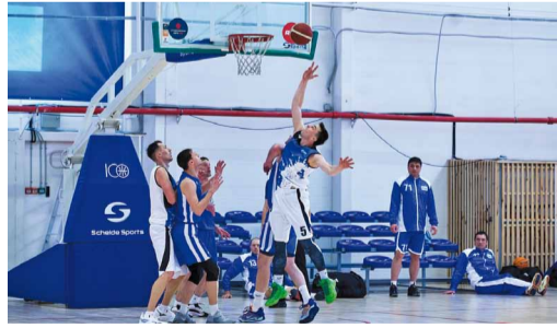
Борьба за подбор