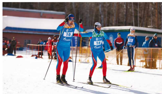
Мужская лыжная эстафета