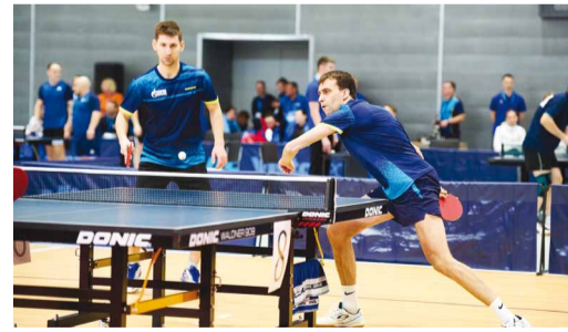
Парная встреча в настольном теннисе

Список наиболее актуальных вакансий размещен на официальном сайте ООО «Газпром трансгаз Саратов»