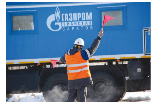
Сигнал к выезду