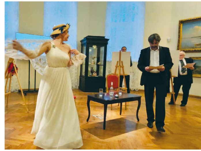
Настоящий театр в музее