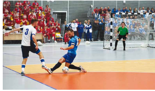
Матч футболистов в 1/4 финала