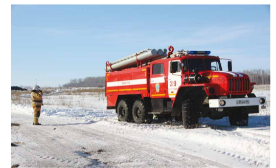
Выезд пожарного автомобиля