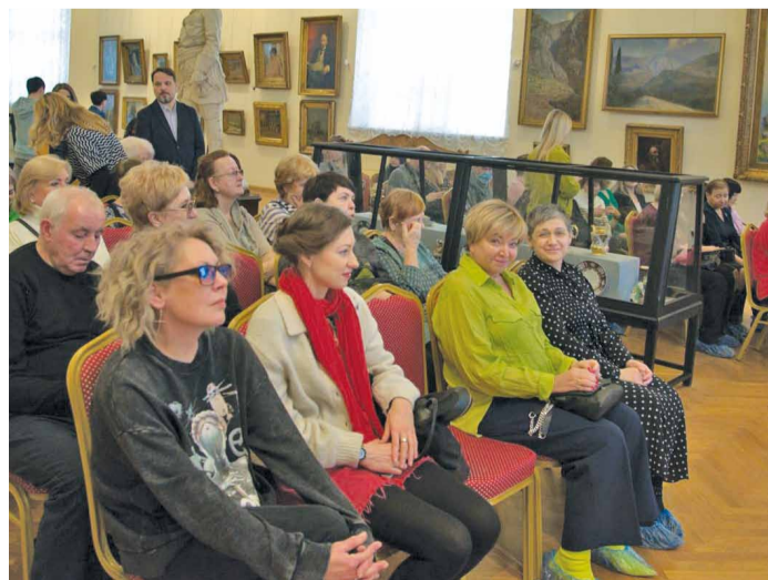
Благодарные и внимательные зрители

ект на стыке современного театра и интерактивных музейных практик. Он направлен на повышение уровня образования гостей и жителей Саратова, привлечение внимания посетителей к личности и творческому наследию выдающегося деятеля культуры. Музей является давним партнером предприятия в реализации знаковых для региона благотворительных проектов.