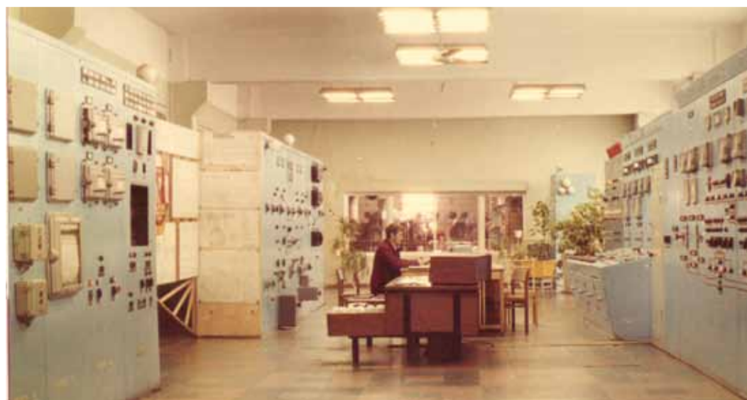
Главный щит управления Приволжского ЛПУМГ. 1975 г.