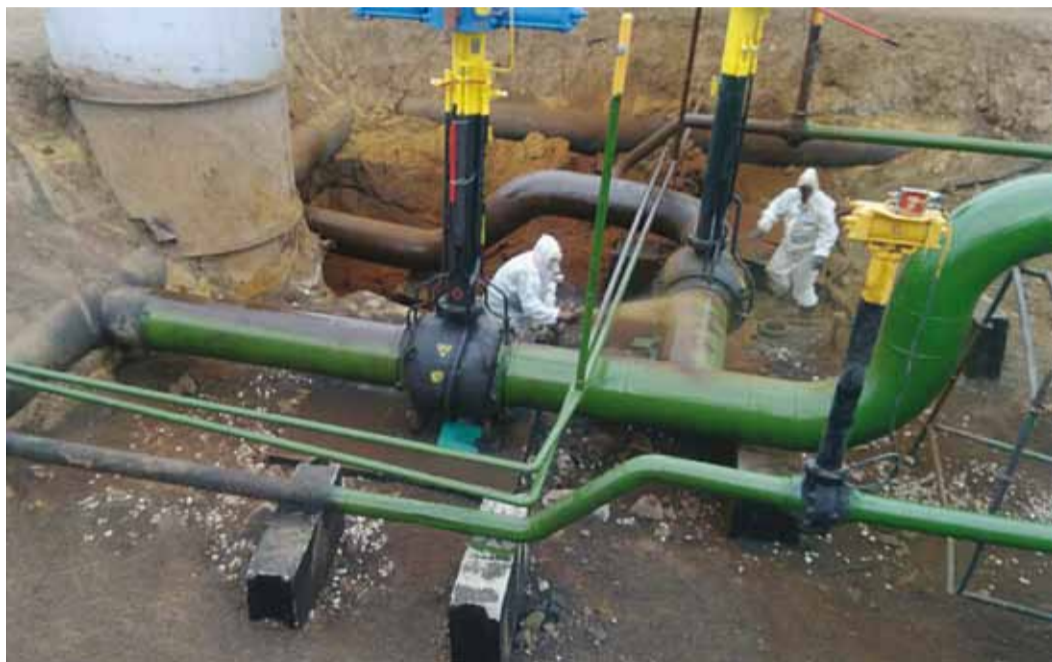
Изоляционные работы бригады УАВР после монтажа оборудования

Согласно плану капитальный ремонт хозяйственным способом был завершён точно в срок - 23 ноября, а компрессорный цех №1 уже вновь введен в эксплуатацию.