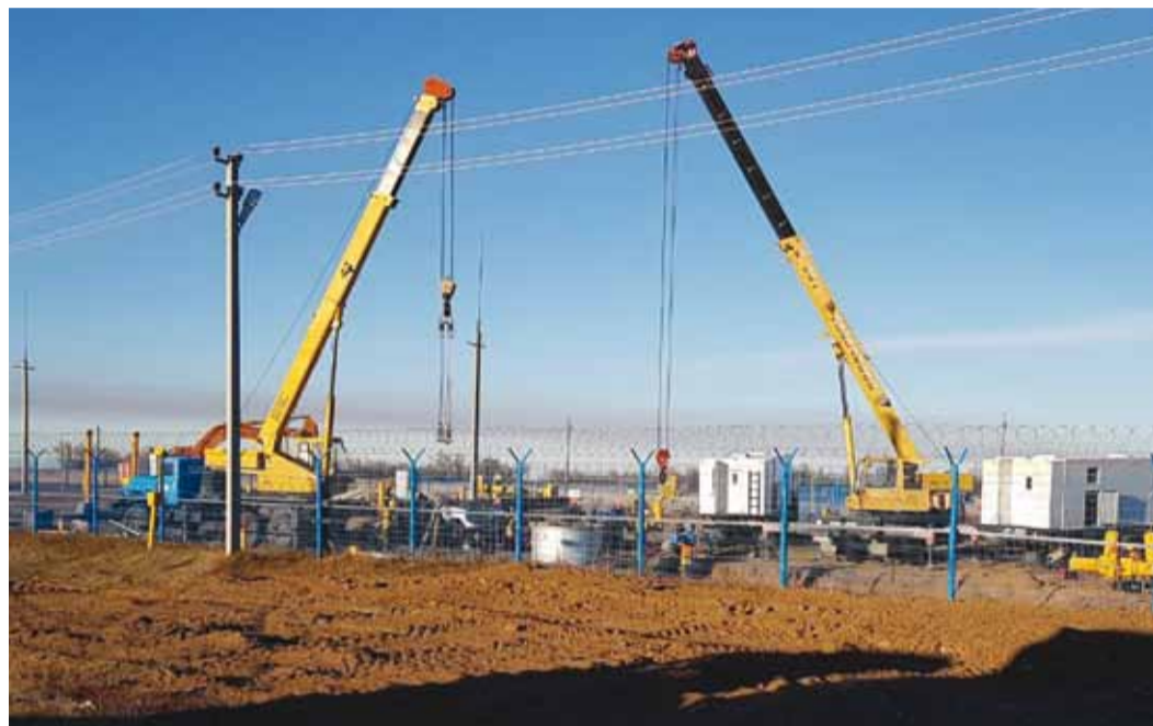
Капитальный ремонт был выполнен за две недели