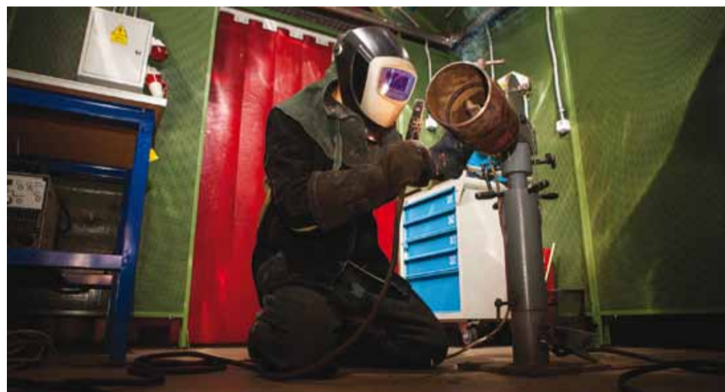
Практический экзамен специалиста сварочного производства 1-го уровня