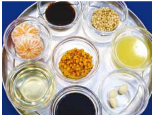
Составляющие маринада и соуса