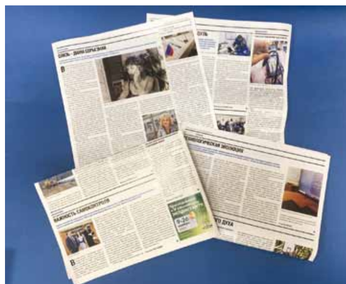
Работы авторов конкурса публиковались в корпоративной газете

Внутрикорпоративный конкурс публицистических статей «Внештатники», организованный службой по связям с общественностью и СМИ и профсоюзом Общества, проходил среди работников-членов профсоюза с 7 августа по 8 декабря 2023 года. Его цель – разностороннее освещение деятельности предприятия, вовлечение газетчиков в информационную работу.