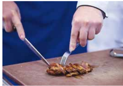
Нарезка перед подачей