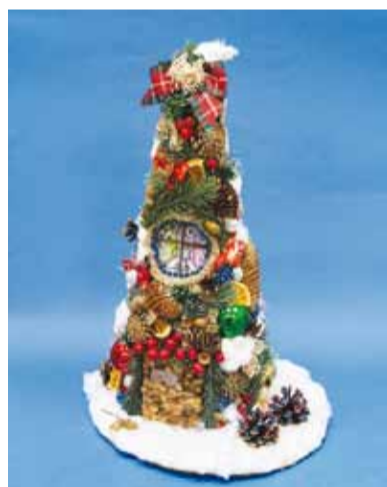
2 место – Алина Кузнецова, 4 года