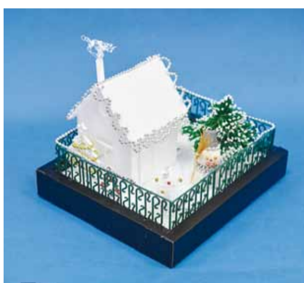
1 место – Данила Зайченко, 14 лет