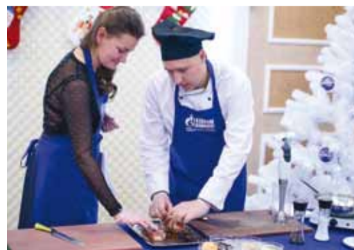
Подготовка к томлению в печи