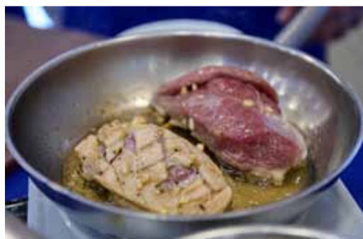
До золотистой корочки