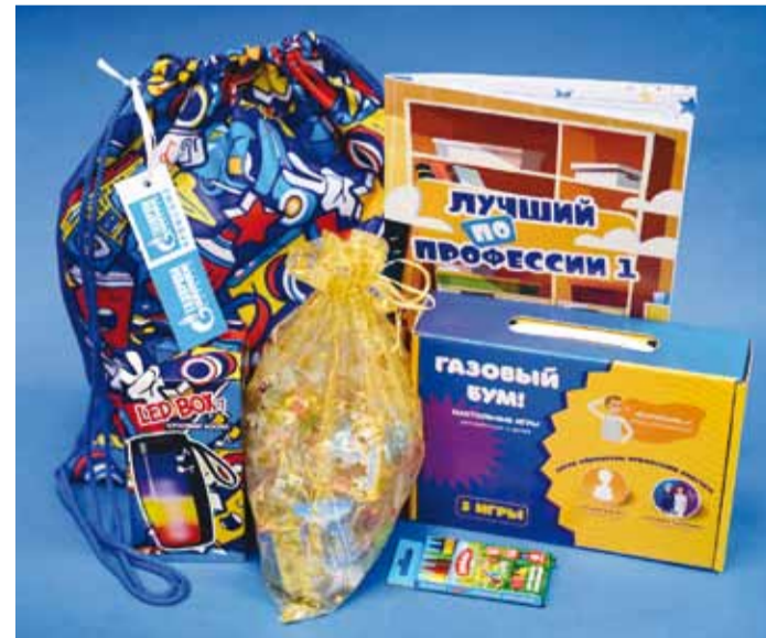
Распаковка новогоднего подарка

Как говорят, самый дорогой подарок – это люди, которым