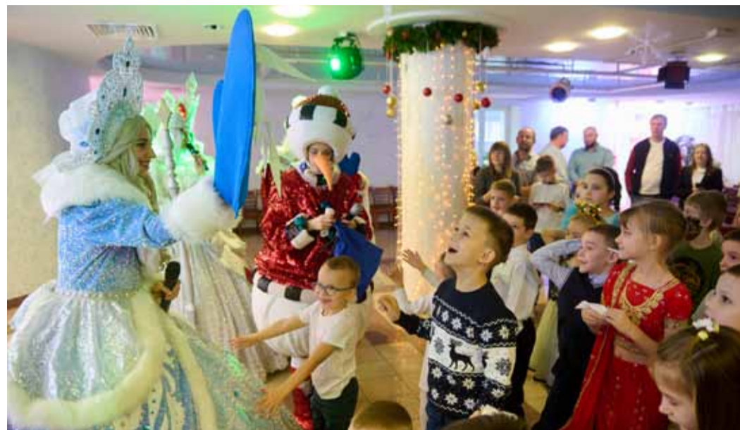
Представление вызвало у ребят бурю восторга

В воскресенье, 24 декабря, в спортивно-оздоровительном комплексе «Родничок» состоялся традиционный новогодний праздник для детей работников «Газпром трансгаз Саратов». В «Королевской новогодней сказке» побывали более 150 ребят.