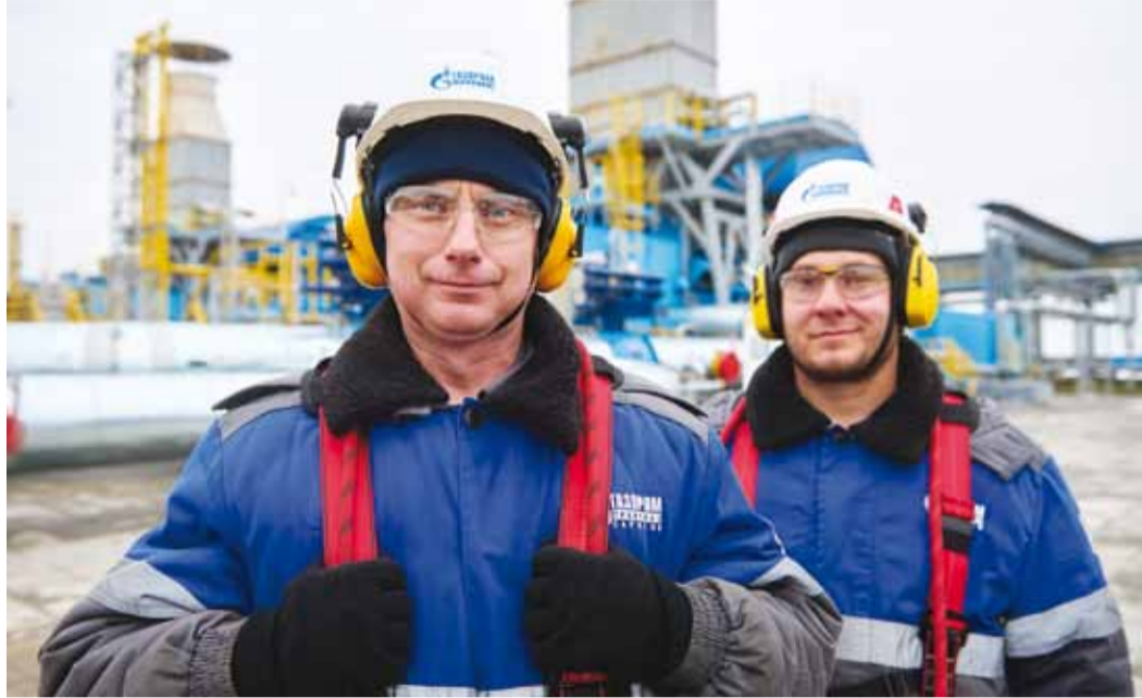
Работники Общества встречают новшества с хорошим настроением

Новый год – не только повод подвести итоги прошедшего, но и возможность заглянуть в будущее. Каким оно будет, безусловно, зависит только от нас самих. Но уже сейчас мы можем поделиться с вами некоторыми планами и предстоящими нововведениями.