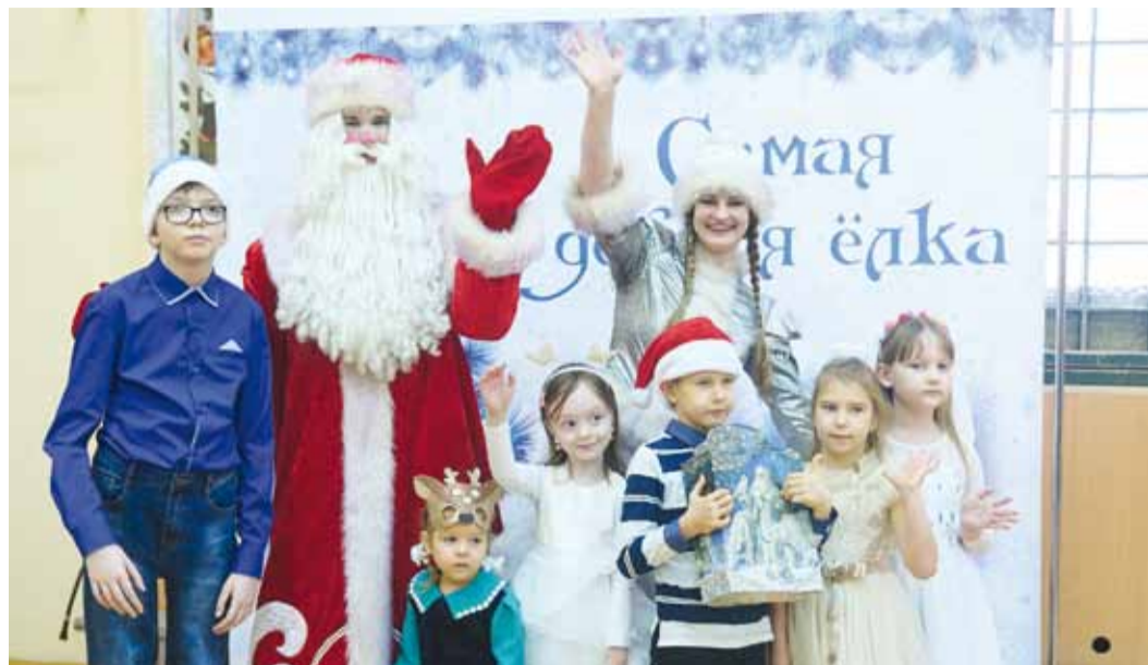
Фотозона пользовалась большой популярностью

В преддверии Нового года ООО «Газпром трансгаз Саратов» организовало в Саратовской государственной консерватории имени Л. В. Собинова традиционный новогодний благотворительный праздник.