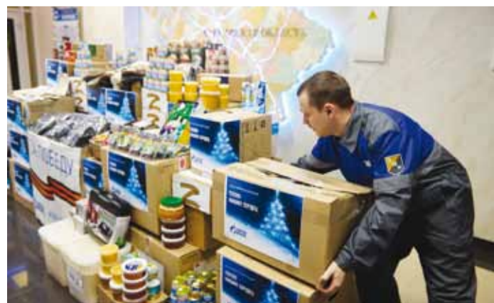
Формирование гуманитарного груза

Работники Общества провели акцию в поддержку участников СВО