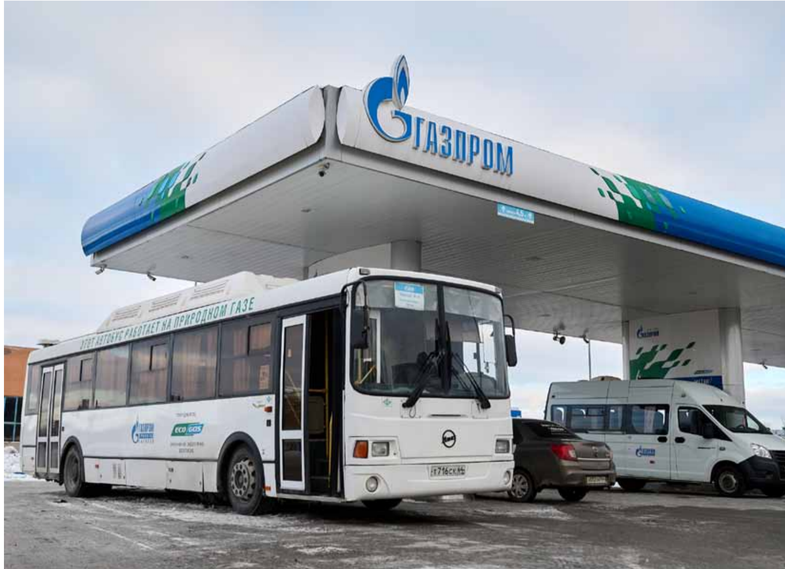
Автотранспорт Общества на одной из заправочных станций г. Саратова

Природный газ в качестве моторного топлива выбирают все больше компаний и частных лиц. Об истории вопроса, мировых и отечественных тенденциях и новом проекте ООО «Газпром газомоторное топливо» читайте в нашем материале.