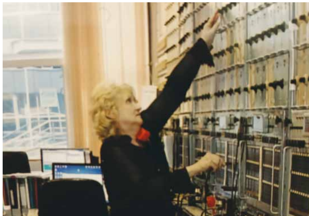
Работа на оборудовании К-60 в 2000-е