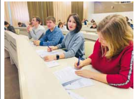
В Учебно-производственном центре