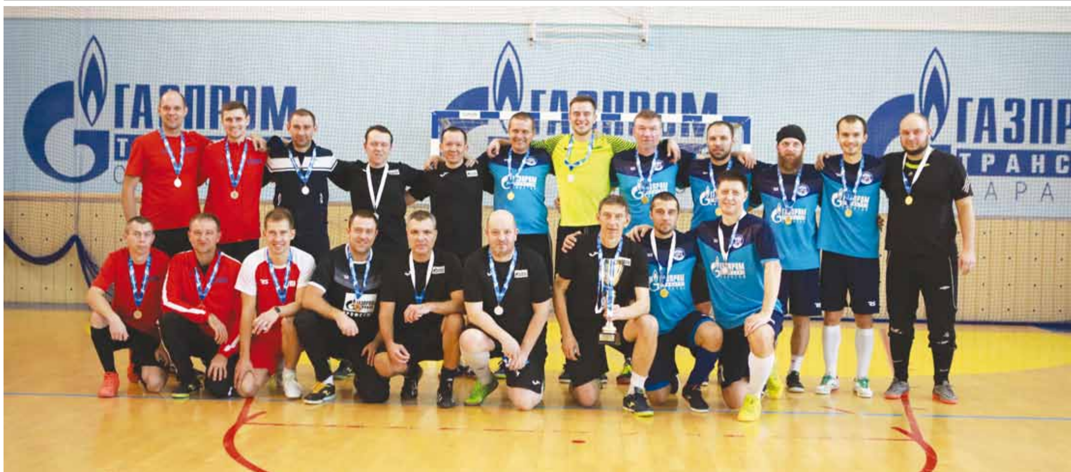
Призеры Кубка Общества по мини-футболу. Команды УТТУСТ, УМТСиК и УПЦ