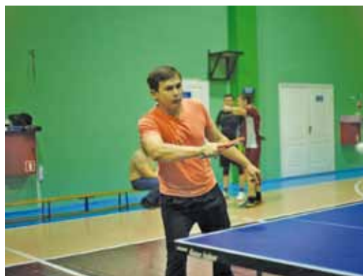
...и настольный теннис