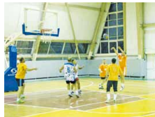
Баскетбольный турнир в Баймаковском ЛПУМГ