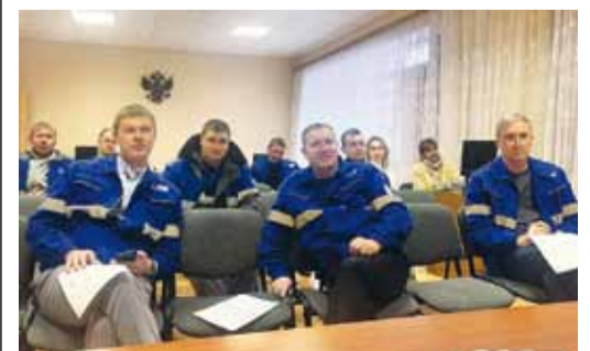
В Пугачевском ЛПУМГ