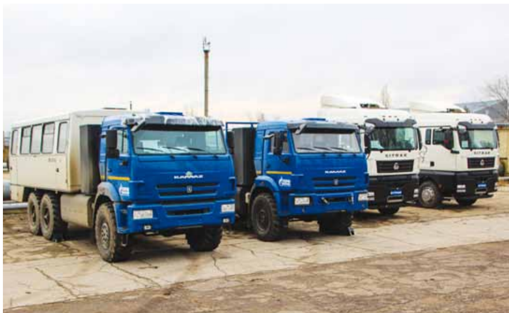
Свежая поставка газомоторной техники – передвижные лаборатории и тягачи

В июне 2023 года на Петербургском международном экономическом форуме был дан старт проекту «Народное топливо». Он подразумевает комплекс преференций для физических и юридических лиц, которые они по-