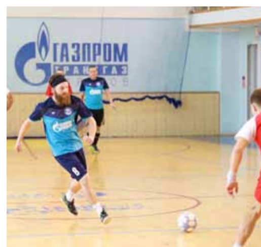
В атаке – УТТУСТ – победитель Кубка Общества по мини-футболу 2023 года