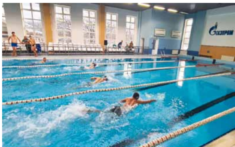
Соревнования по плаванию в рамках спортивных турниров среди молодых работников в бассейне СОК «Родничок»