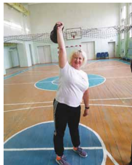
Сдача нормативов ВФСК ГТО в Меццеском ЛПУМГ