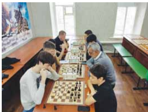
Спартакиада Александровогойского ЛПУМГ - шахматы