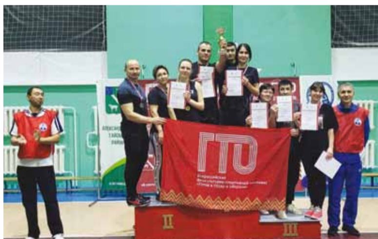
Команда Александровогойского ЛПУМГ – обладатель серебряных наград районного фестиваля «Игры ГТО»

Одиннадцатый месяц года стал по-настоящему богатым на события из мира спорта. Мероприятия проходили на уровне Общества и филиалов, наши спортсмены участвовали в районных и всероссийских турнирах. Члены сборных команд нашего предприятия активно готовятся к Спартакиаде ПАО «Газпром», которая пройдет в марте 2024 года в Екатеринбурге. Сегодня мы предлагаем вашему вниманию фотодайджест мгновений ноября.