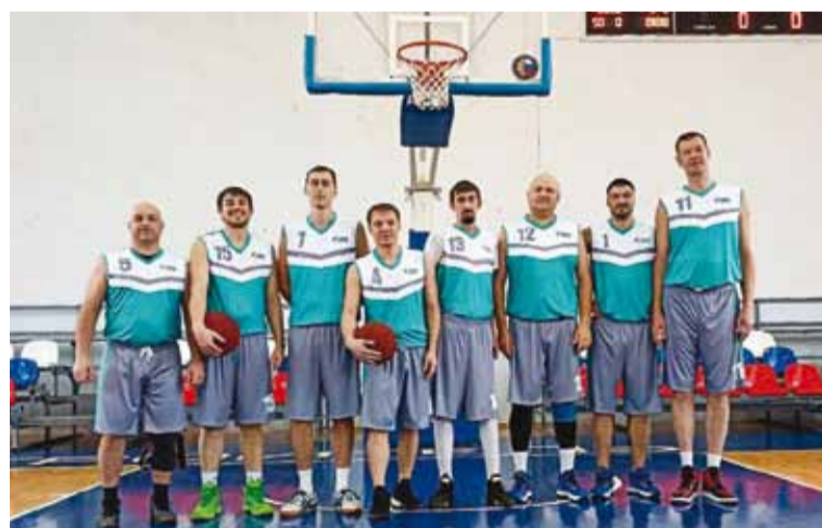
Сборная ООО «Газпром трансгаз Саратов» готовится к Спартакиаде ПАО «Газпром», участвуя в региональном «Кубке Гагарина»