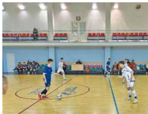
Развязка Спартакиады среди детей работников