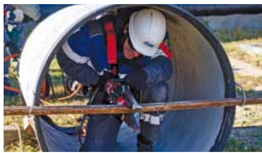
Работа с гидравлическим инструментом

Для проверки нештатного аварийно-спасательного формирования в Общество была направлена рабочая группа объектовой комиссии минэнерго России по аттестации аварийно-спасательных формирований и спасателей ПАО «Газпром» в составе Ан-