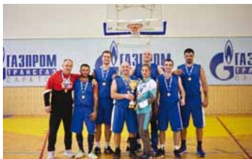
Чемпионы из Балашовского ЛПУМГ

Ровно 100 лет назад в СССР сыгран все-российский турнир по баскетболу, который по статусу вполне мог бы быть назван первым чемпионатом страны. Турнир закончился скандалом. Итоги финального поединка между командами Москвы и Петрограда были опротестованы, переигровка не состоялась, а спортивная история пополнилась еще одним противостоянием двух столиц. Первые семь официальных довоенных чемпионатов СССР завершались победами сборных и клубов с берегов Москвы и Невы. В последние несколько