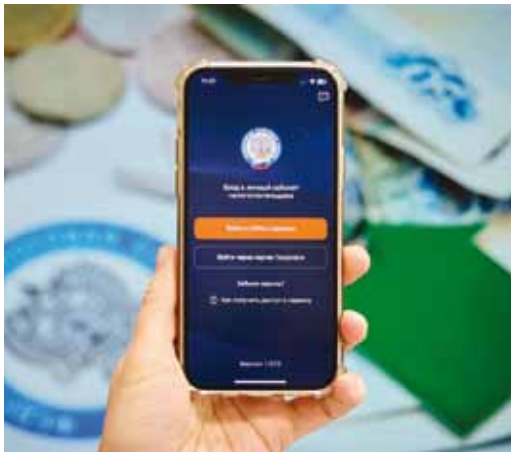
Налоги всегда под рукой

В прошлом году, по данным Банка России, отмечен новый антирекорд: со счетов россиян мошенникам удалось списать 14,1 млрд рублей. За год объем хищений вырос более чем на 4 %.