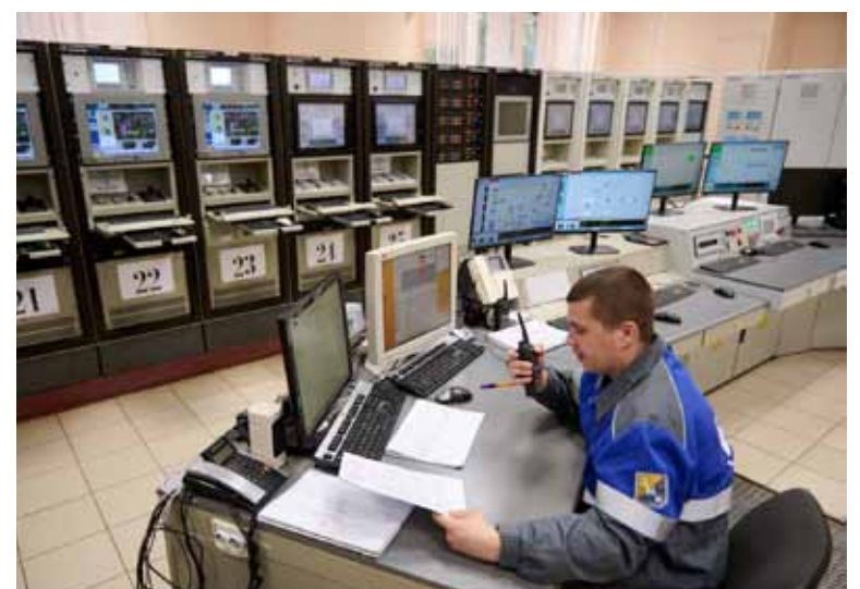
Главный щит управления компрессорного цеха в Сторожевском ЛПУМГ