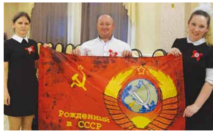
Праздник может быть тематическим