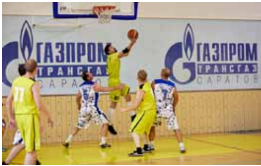
Игра за бронзу. УАВР - Башмаковское ЛПУМГ

12-13 октября в СОК «Родничок» состоялись соревнования по баскетболу в зачет Спартакиады Общества.