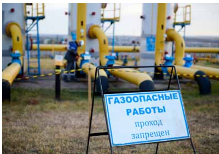
Регламентные работы на пылеуловителях