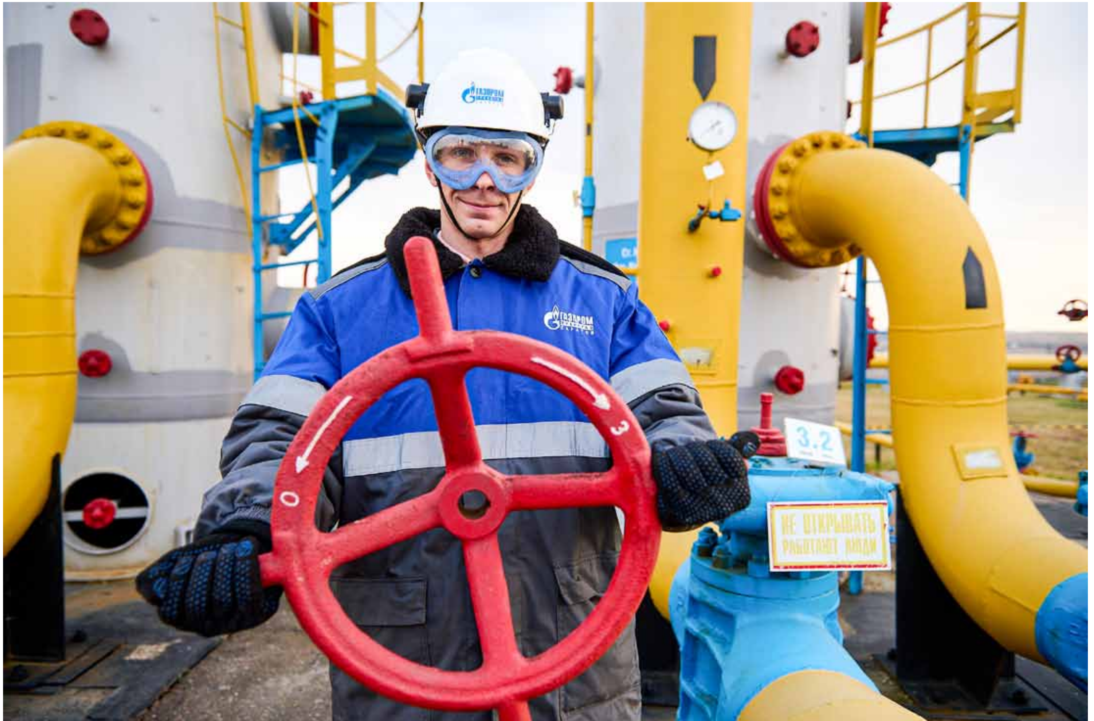
Техническое обслуживание запорной арматуры с целью исключения возможности самопроизвольной перестановки

Объекты газотранспортной системы ООО «Газпром трансгаз Саратов» готовы к работе в осенне-зимний период.