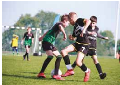
Борьба за мяч

2-4 октября в Саратове прошли финальные соревнования XXI Открытого областного турнира по футболу среди дворовых команд на Кубок губернатора Саратовской области.