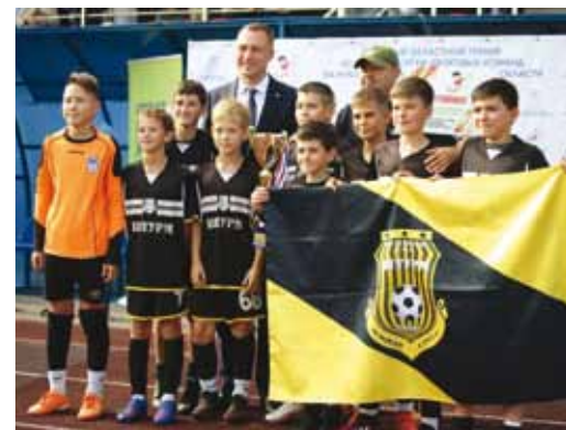
Фото на память с губернатором