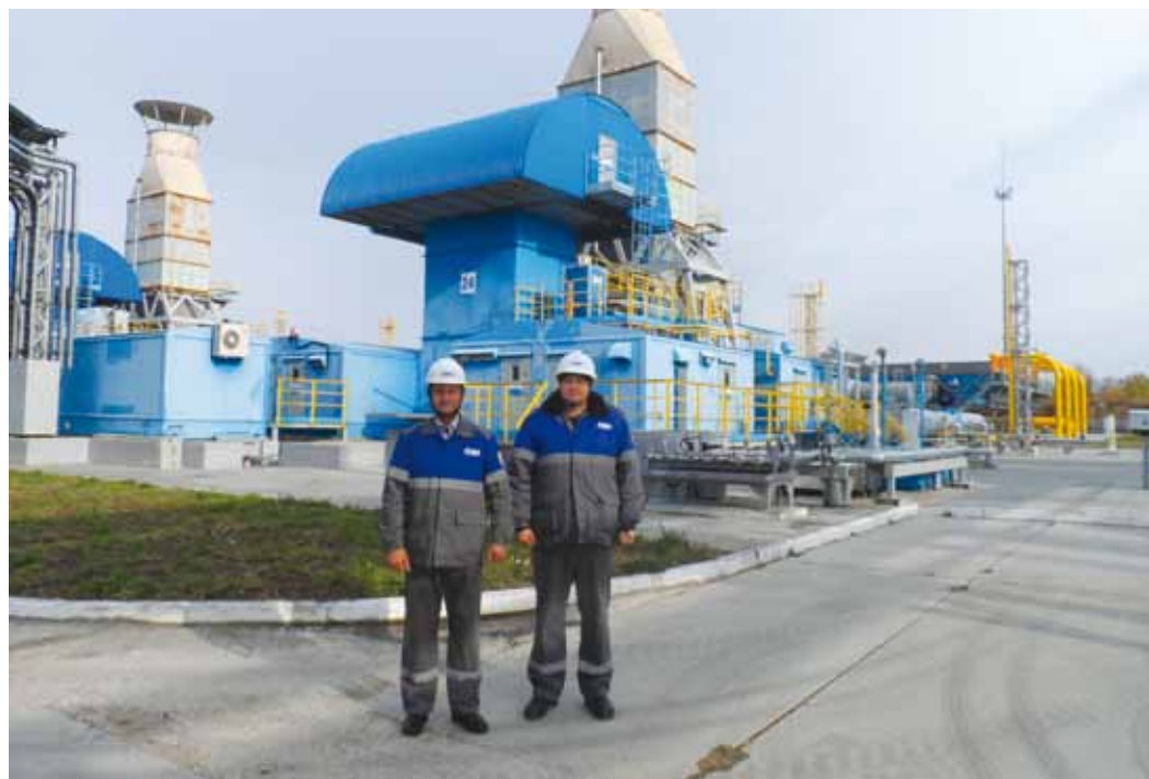
Рационализаторы на территории компрессорного цеха

«В Газпроме очень жесткие требования и ограничения по изменению конструкций. Те варианты решения проблемы, которые мы рассматривали ранее, приводили к изменению конструкции самого утилизатора. Или требовали применения каких-то других насосов, которые позволили бы использовать утилизатор по назначению. Но все это упиралось в конечном итоге в изменение проекта, а это потребовало бы согласования с проектной организацией, а также отдельного финансирования. Это превращало проблему в нерешаемую. Воспо-