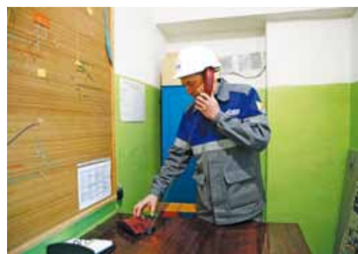
Проверка систем связи