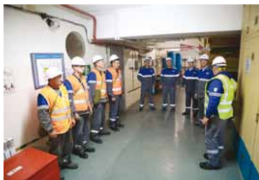
Постановка задач звену НФГО