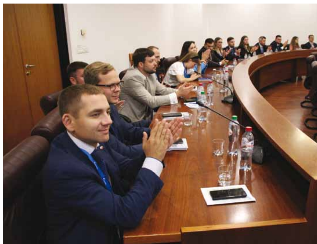
На заседании круглого стола