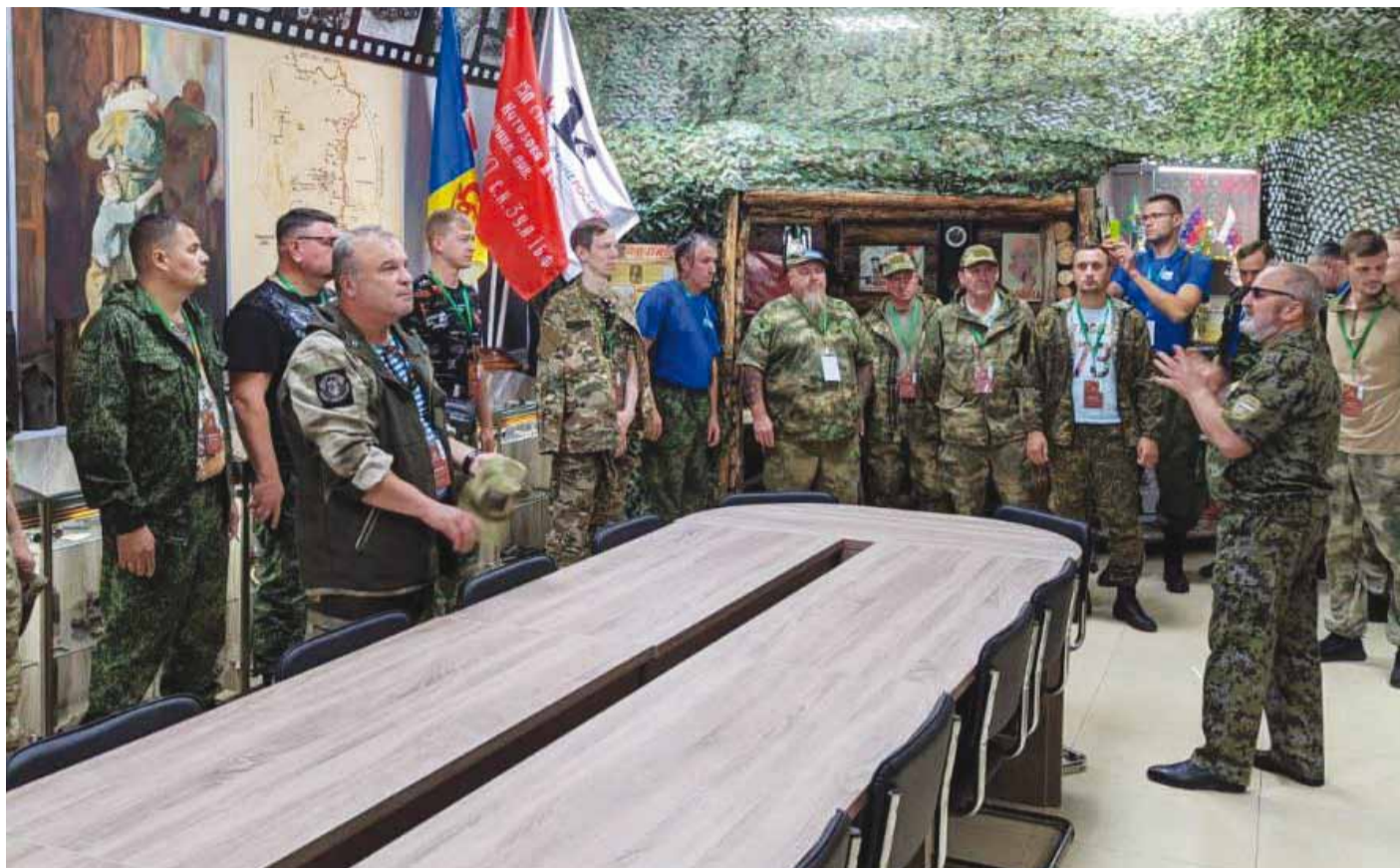
В музее поискового отряда «Кубанский рубеж»

23 сентября в Крымском районе Краснодарского края у мемориала «Сопка Героев» при поддержке «Газпром профсоюз» стартовала патриотическая акция «Вахта Памяти – 2023. Битва за Кавказ».