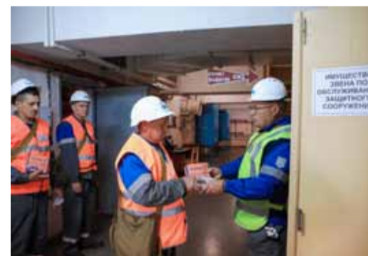
Выдача средств индивидуальной защиты