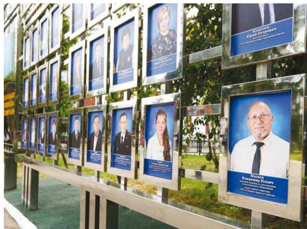
Галерея Почета Ленинского района г. Саратова