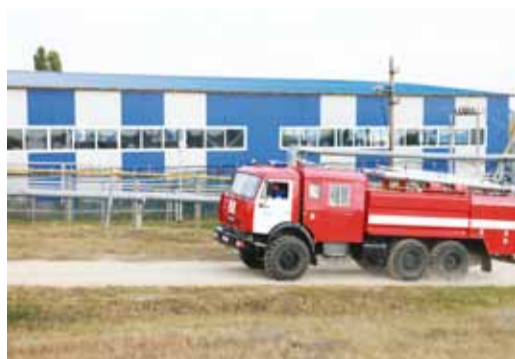
Прибытие автомобиля из состава НАСФ