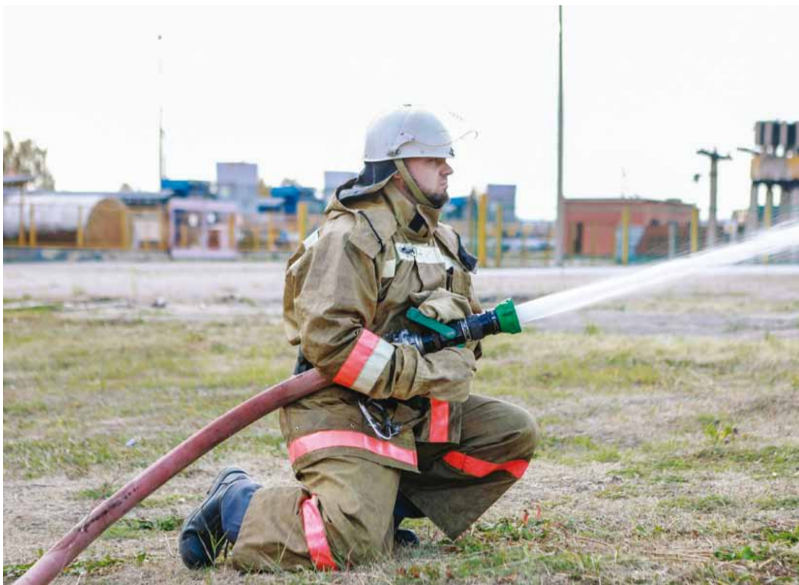
Отработка действий по ликвидации возгорания

4 октября в России отмечался День гражданской обороны. Накануне во всех федеральных органах исполнительной власти и регионах России была проведена крупномасштабная тренировка. Мероприятия по гражданской обороне прошли и на нашем предприятии.