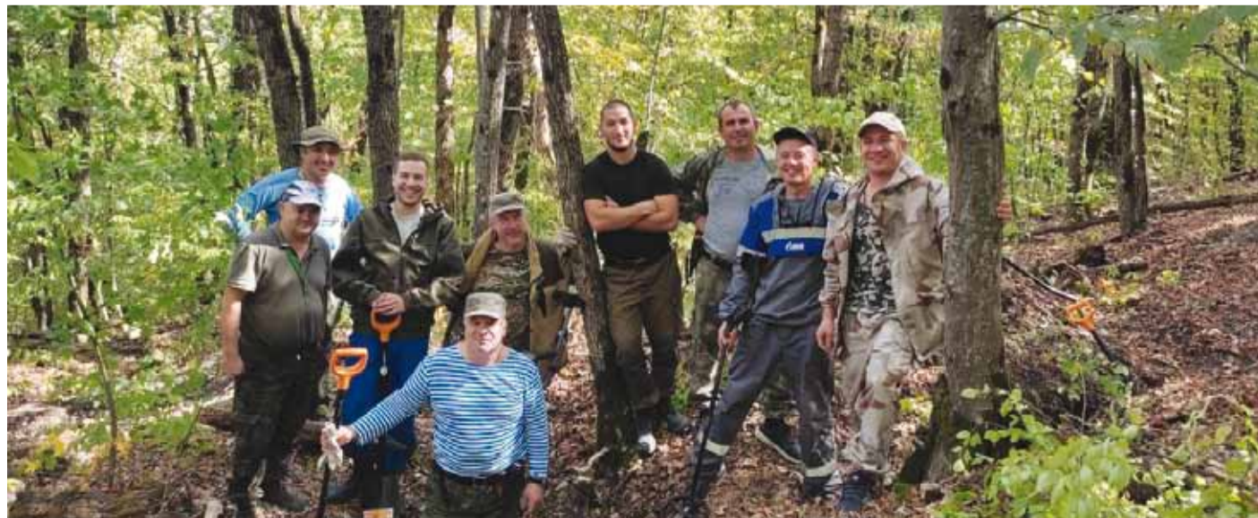
Газовики занимались поисками павших бойцов ежедневно