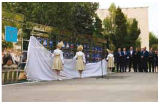
Открытие Галереи Почета