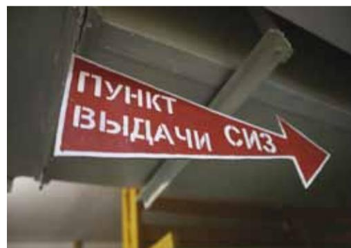
Указатель в помещении защитного сооружения