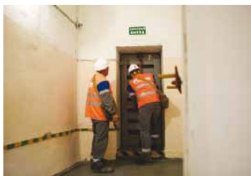
Проверка готовности защитного сооружения