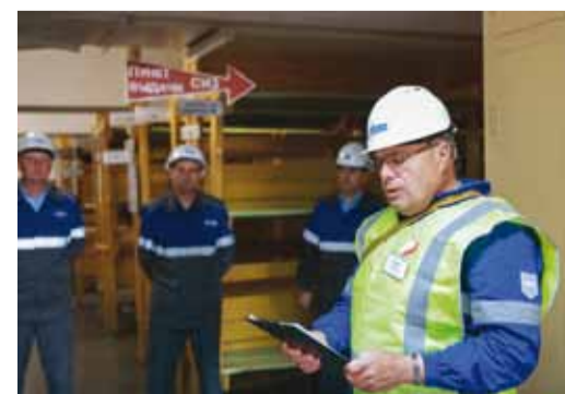
Прием докладов о готовности защитного сооружения