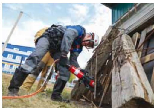
Проведение аварийно-спасательных работ