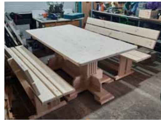
Стол почти готов

мит свои изделия – уникальное клеймо заказала и подарила ему на день рождения жена. Надпись «Papa Karlo Balashov» выжигается на дереве особым способом.