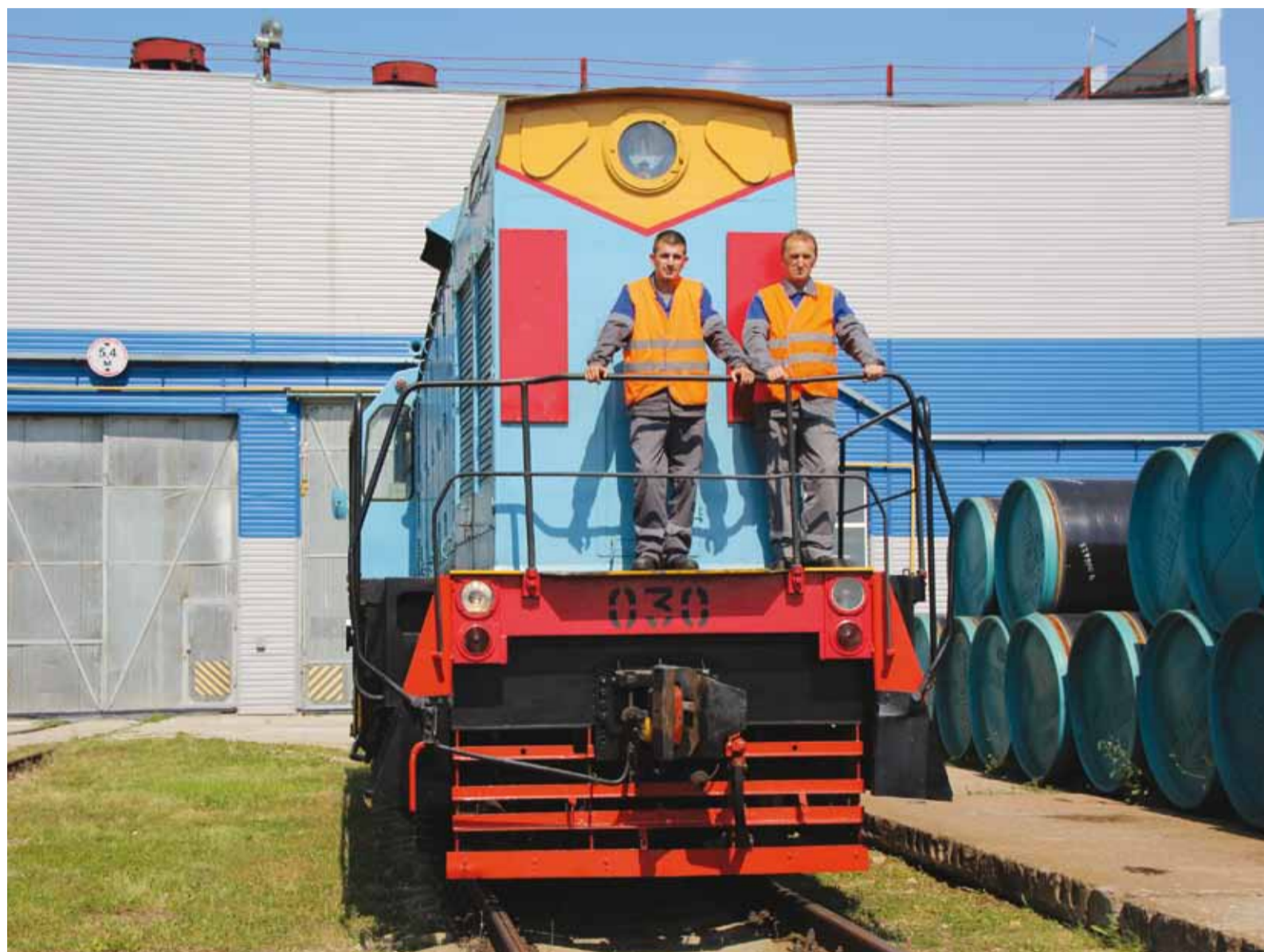
Один из двух тепловозов ТГМ6Д

В первое воскресенье августа в России отмечается День железнодорожника. В преддверии этого торжества мы поздравляем коллег, работающих на участке по хранению и реализации материально-технических ресурсов N 2 УМТСиК, который вот уже 32 года выполняет задачи по снабжению Общества.