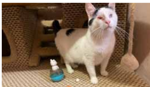
Здесь все, как дома

Приют, отмечают они, это всегда про трагедию в жизни животного – предательство