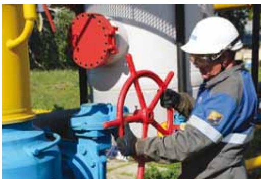
Капремонт обвязки пылеуловителей