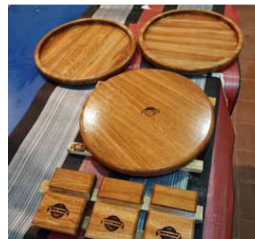
Фантазия без границ