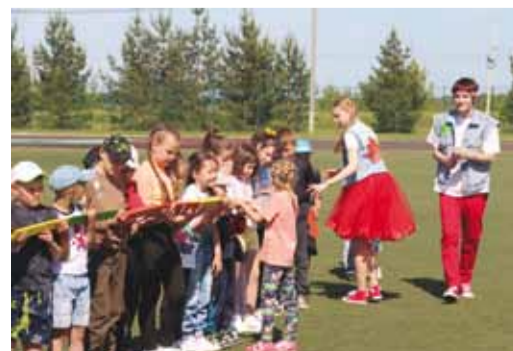
Постоянная работа с детьми