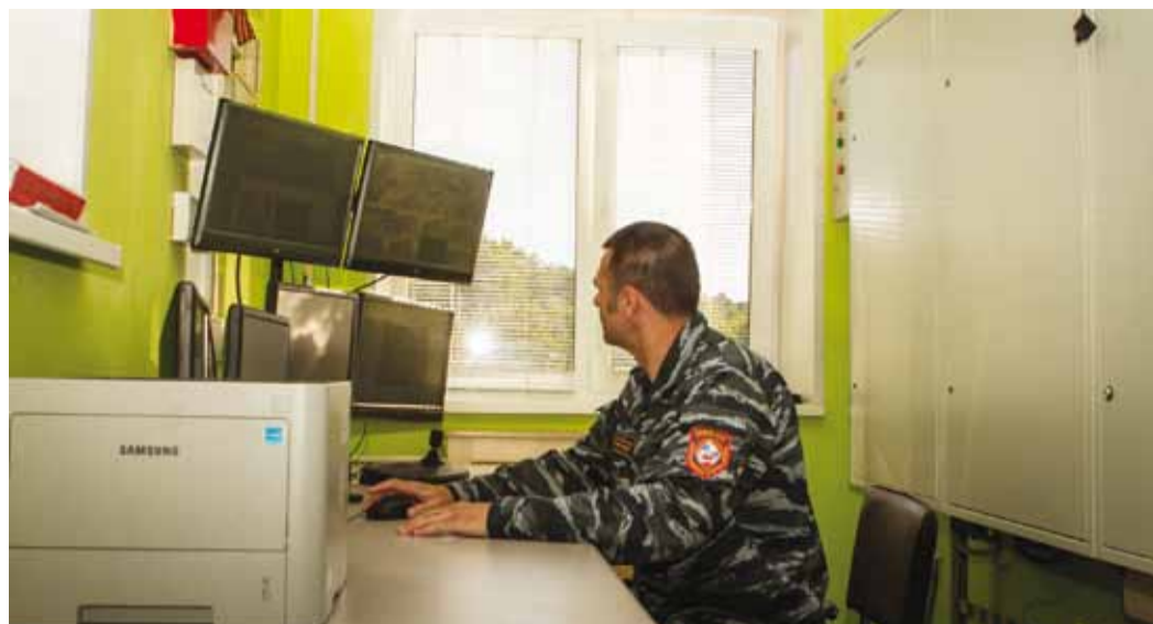
Инспектору охраны доступна полная картина происходящего на территории филиала

Территория объектов Кирсановского ЛПУ МГ «просматривается» при помощи нескольких десятков новых управляемых видеокамер с высоким разрешением. Вся информация хранится на специальном сервере. В любой момент изображение с камер наблюдения в онлайн-режиме и в пол-