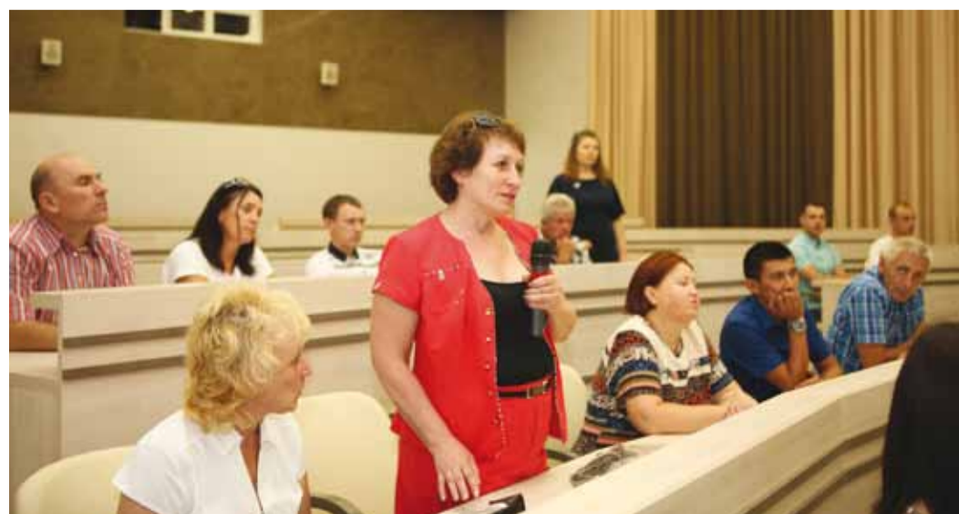
Присутствовавшие задавали много организационных и производственных вопросов