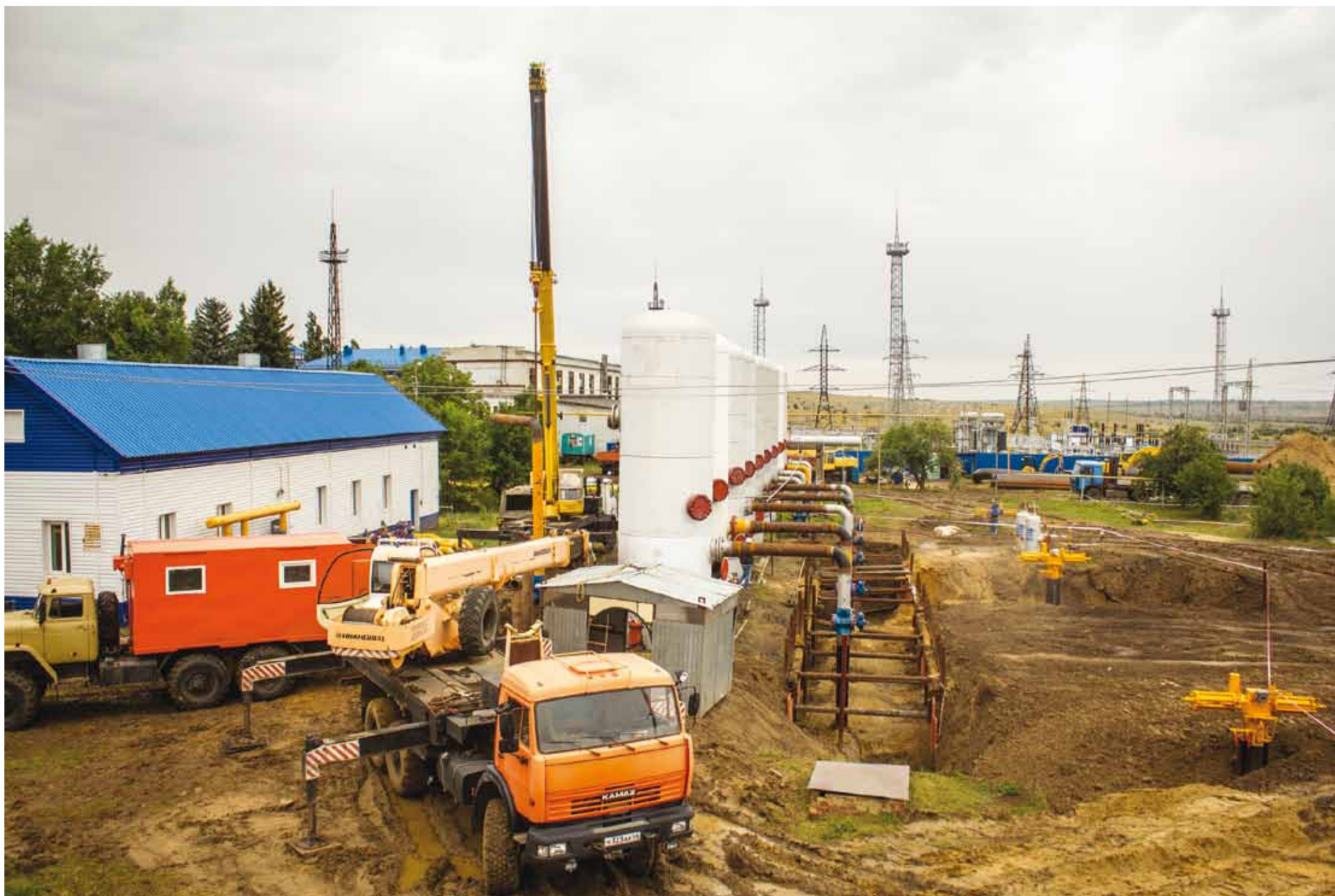
Погодные условия на начальном этапе работ не сказались на их темпах