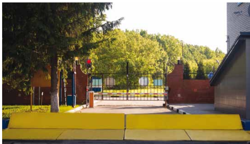
Въезд в Кирсановское ЛПУ МГ защищен в полном соответствии с федеральным законодательством

ИНЖЕНЕРНО-ТЕХНИЧЕСКИЕ СРЕДСТВА ОХРАНЫ (ИТСО) – ТЕХНИЧЕСКИЕ СРЕДСТВА ОХРАНЫ И ИНЖЕНЕРНО-ТЕХНИЧЕСКИЕ СРЕДСТВА ЗАЩИТЫ ОБЪЕКТА ТОПЛИВНО-ЭНЕРГЕТИЧЕСКОГО КОМПЛЕКСА, ПРЕДНАЗНАЧЕННЫЕ ДЛЯ ПРЕДОТВРАЩЕНИЯ НЕСАНКЦИОНИРОВАННОГО ПРОНИКНОВЕНИЯ НА ОБЪЕКТ ТЭК ИЛИ ВЫЯВЛЕНИЯ НЕСАНКЦИОНИРОВАННЫХ ДЕЙСТВИЙ В ОТНОШЕНИИ ОБЪЕКТА ТЭК (СТО ГАЗПРОМ 4.1-5-001-2014).