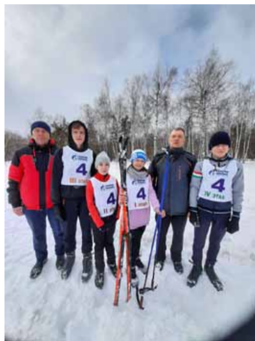
С детской командой лыжников

«Как я уже говорил, для конькового хода нужна трасса. Мы ее каждый год делаем, нас поддерживает местный комитет по спорту. У меня две пары коньковых лыж, а еще люди покупают, профсоюз нам ранее тренировочные приобрел, а в этом году купил восемь