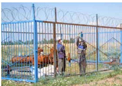
Покраска ограждения крановой площадки