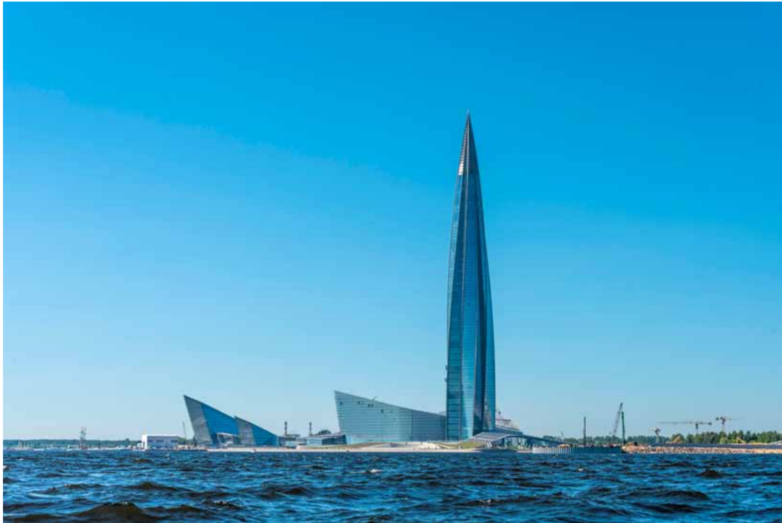
«Лакта - Центр».

30 июня 2023 состоялась годовое Общее собрание акционеров ПАО «Газпром»