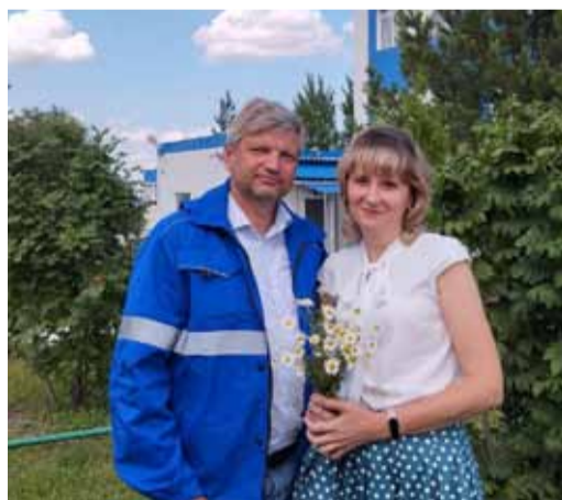
Чета Яниных в родном Пугачевском ЛПУМГ

По итогам работы за 2015, 2021, 2022 годы служба по эксплуатации ГРС Пугачевского ЛПУМГ была признана лучшей в Обществе. Безусловно, это заслуга всех работников службы, но достижению таких результатов способствует грамотное