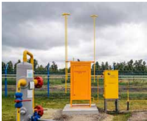
ГРПШ на АГРС-3 с.3-я Александровка

Годовая программа капитального ремонта объектов газового хозяйства в Обществе выполнена в полном объеме. Работы проведены на четырех объектах – ГРС с. Романовка Мокроусского ЛПУМГ, АГРС-10 с. Михайловка Балашовского ЛПУМГ, АГРС-3 с.3-я Александровка Екатеринбургского ЛПУМГ и АГРС-10 п. Заметчино Башмаковского ЛПУМГ.