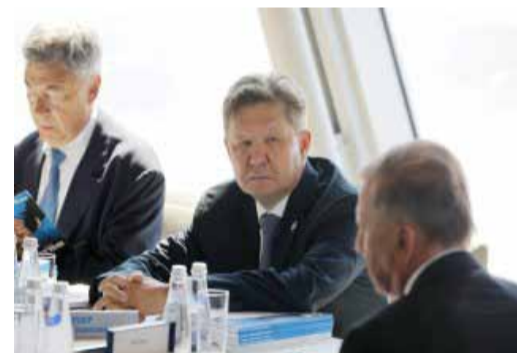
Андрей Акимов, Алексей Миллер и Виктор Зубков