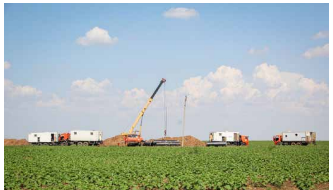
Огневые работы проходили в окрестностях села Борисоглебовка Федоровского района Саратовской области