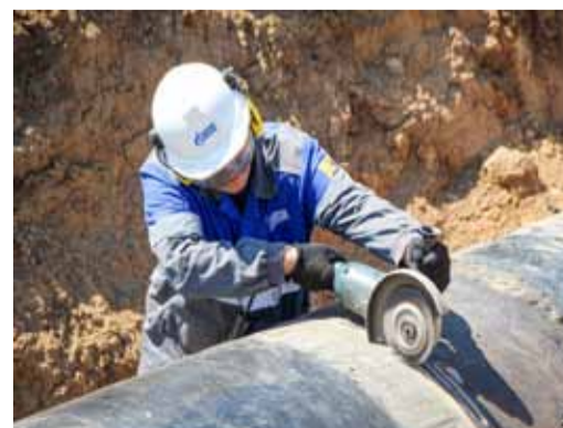
Обработка кромки трубы