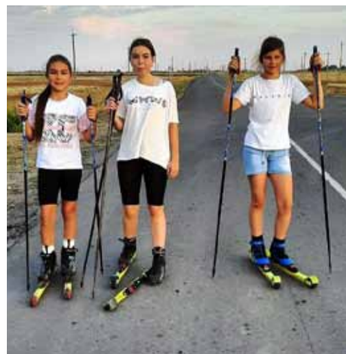
Летом катаемся на лыжероллерах

Наш коллега резюмировал, что увлеченных ребят могло бы быть гораздо больше, однако не все семьи могут позволить себе купить лыжи, коньки и одежду для серьезных занятий спортом. Маленькие лыжники и хоккеисты ищут спонсоров.