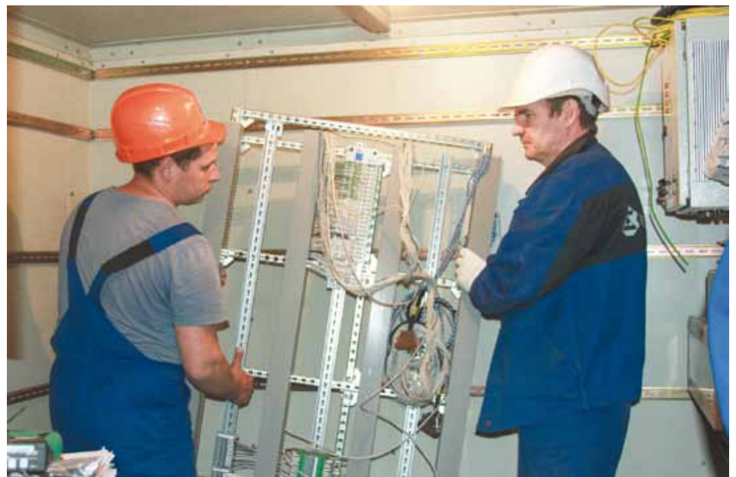
В рамках программы капремонта с использованием КМЧ на ГПА №6 устанавливают отечественное оборудование