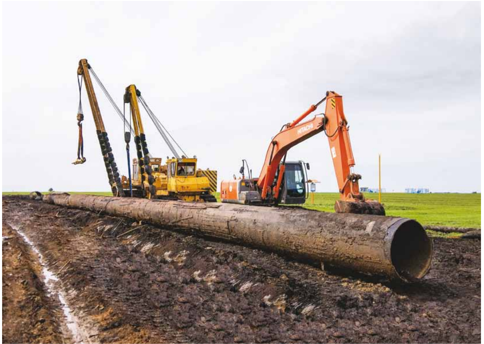
Капремонт газопровода Петровск – Елец – расширение

В итоге специалистами службы ЛЭС, а также работниками УАВР и ИТЦ участок газопровода на автодороге «Свищевка-Каменка» оперативно и в короткие сроки был выведен в ремонт. «Мы произвели все необходимые действия, связанные с выводом участка в ремонт, и передали его подрядчику для проведения даль-