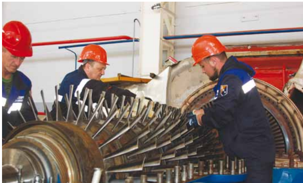
Ремонт ГПА №6 производится силами подрядной организации под строгим контролем специалистов ЛПУМГ

В разгар сезона закачки природного газа в Саратовские ПХГ, влияющего на загрузку газотранспортных мощностей КС «Приволжское», тишина в компрессорном цехе номер 2 объяснялась просто: в Приволжском ЛПУМГ полным ходом ведется экскавация мест шурфования в целях подготовки к технической диагностике подземных трубопроводов для проведения экспертизы промышленной безопасности и осуществляется плановый средний ремонт газоперекачивающего агрегата номер 6.