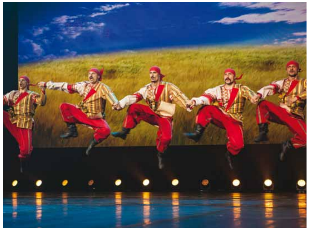
■ Специальным гостем фестиваля стал всемирно известный Государственный академический Кубанский казачий хор