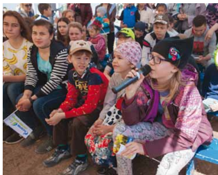
Гостей Экологической станции ждали тематические викторины