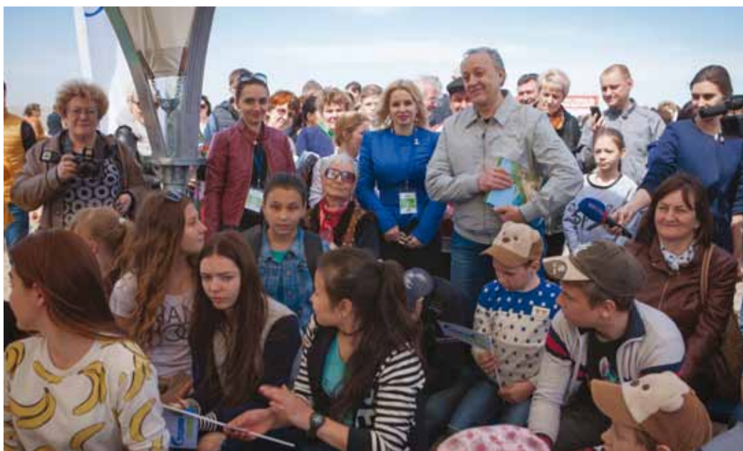
Экологическую станцию общества посетил врио губернатора Валерий Радаев

Гостями экологической станции нашего общества стали в тот день и многие взрослые, в числе которых был врио Губернатора