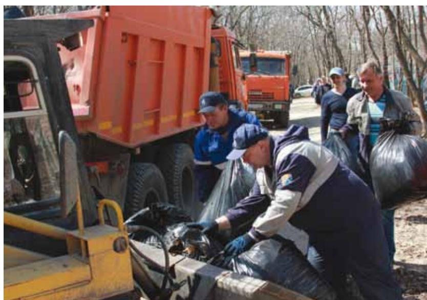
Во Всероссийском субботнике приняли участие более 650 работников нашего общества