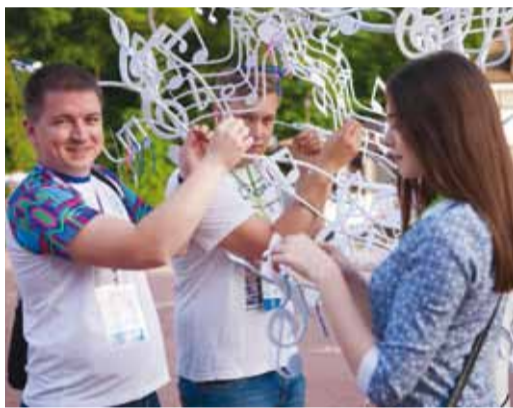
Загадав желание, повязываем цветные ниточки на Дерево Дружбы