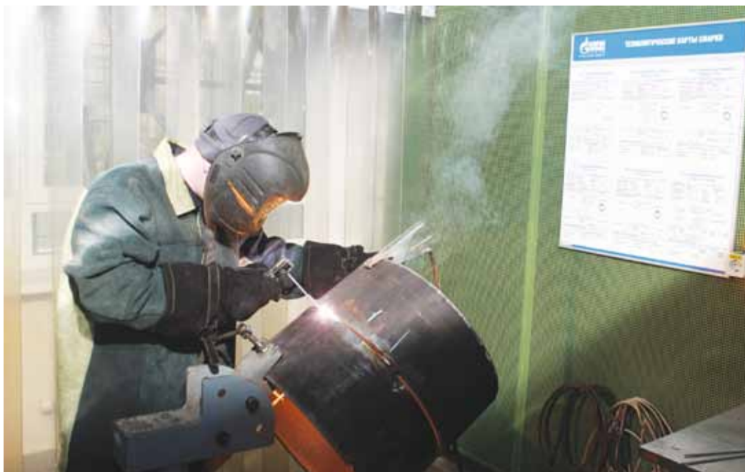
Практическое задание выполняют электрогазосварщики