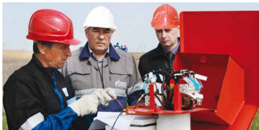
Контроль состояния ЭХЗ газопровода на переходе его через автодорогу