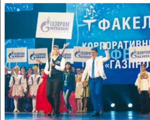
На сцене — делегация нашего общества

Организатором заключительного тура выступил ООО «Газпром трансгаз Краснодар».