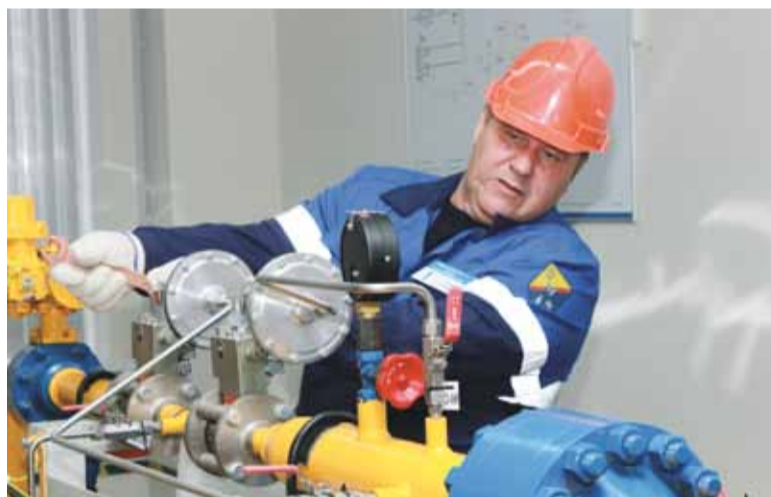
Производится настройка регуляторов и пуск ГРС в работу