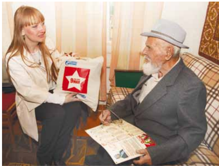
Поздравление ветеранов в Александрово-Гайском районе