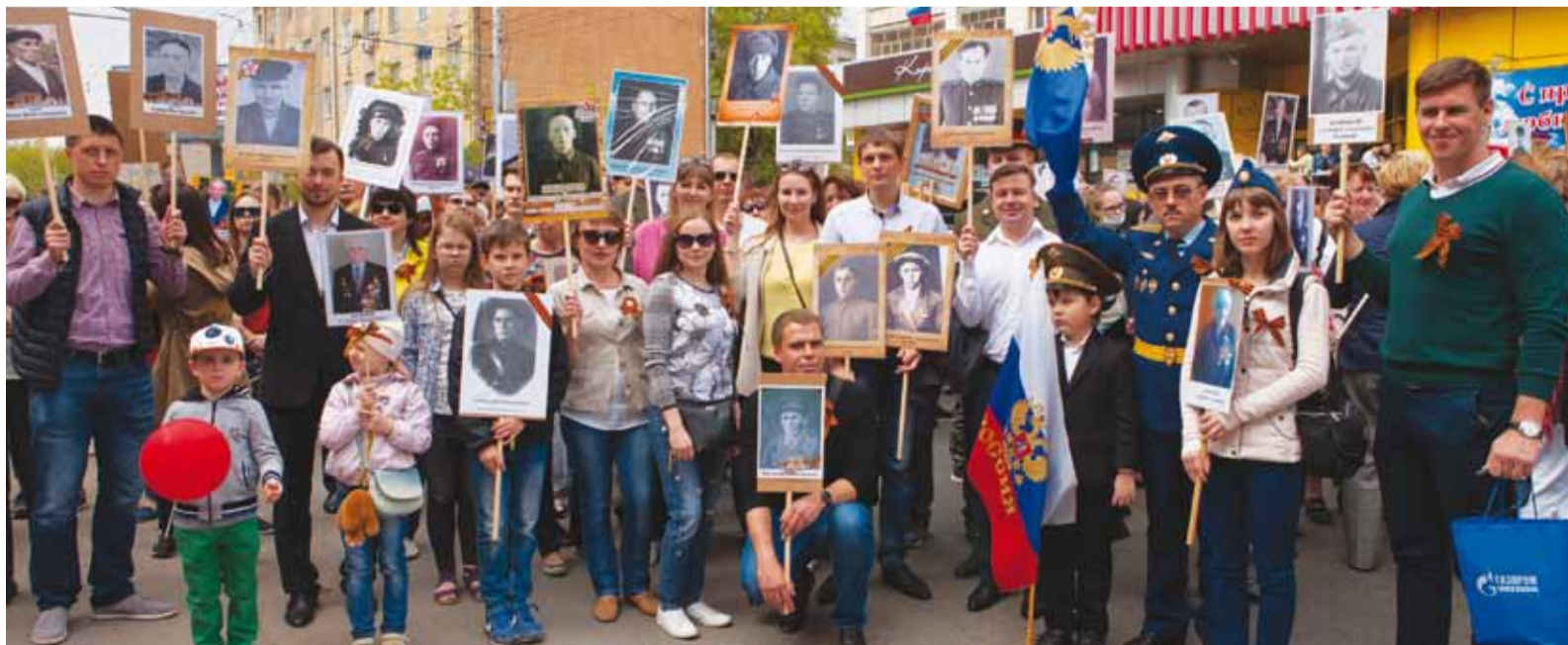
Наш «Бессмертный полк»