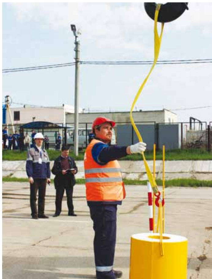
Практическое задание в номинации «Лучший машинист крана автомобильного»