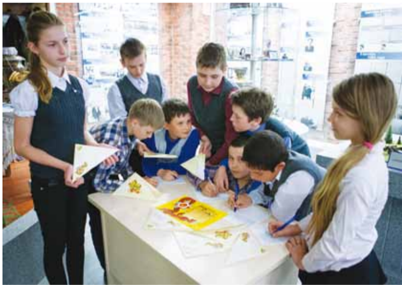
«Письмо ветерану» - от юного поколения