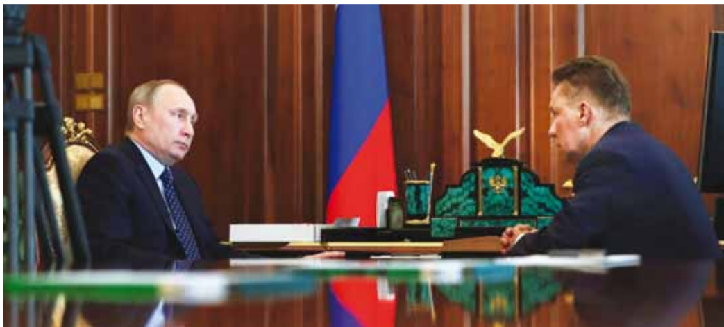
Владимир Путин и Алексей Миллер.

4 мая в ходе рабочей встречи Президента Российской Федерации и Председателя Правления ПАО «Газпром» Алексей Миллер проинформировал Владимира Путина о продолжающемся росте поставок российского газа в дальнее зарубежье и готовности в течение нескольких дней начать укладку морского участка газопровода «Турецкий поток».