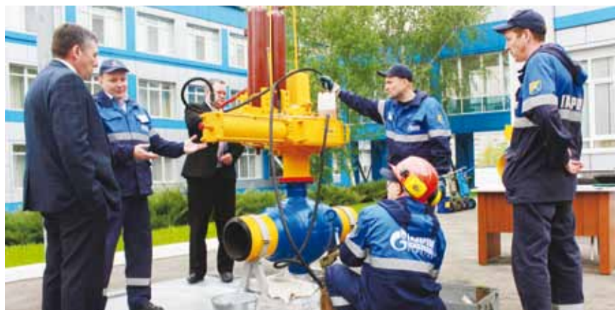
Выполняется перестановка запорной арматуры аварийным комплектом