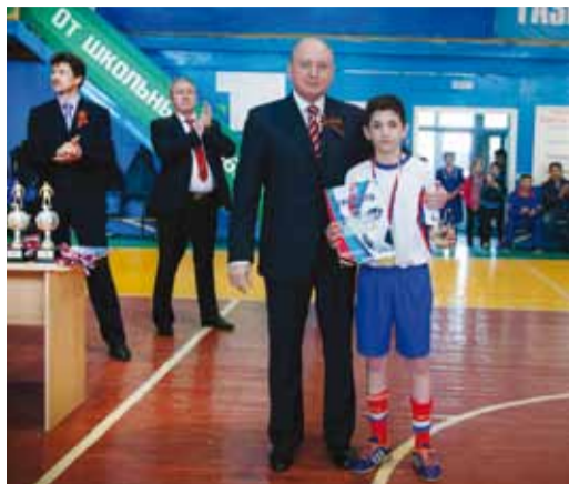
Поддержка массового спорта – одно из стратегических направлений социальной политики нашего общества

ность газоснабжения потребителей г. Саратова и 13 районов области.