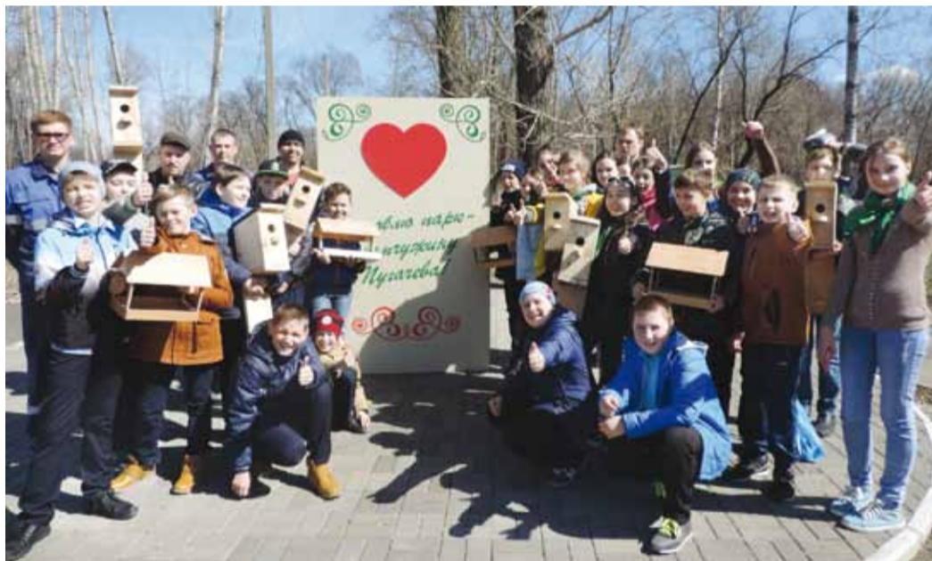
Участники акции «Птичий дом» в Городском парке Пугачева

о Пугачевском линейно-производственном управлении магистральных газопроводов, рассказали о природоохранной деятель-