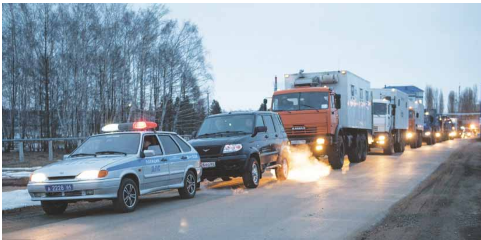
Только со стороны ЛПУМГ в комплексной тренировке было задействовано 12 единиц техники

падение давления. Так 17 марта в Петровском линейно-производственном управлении началась комплексная противоаварийная тренировка.