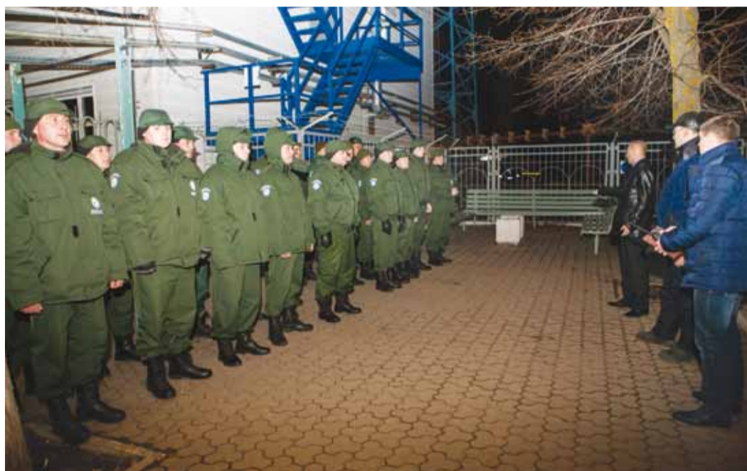
Группа Петровского отделения охраны к выезду на место аварии готова!