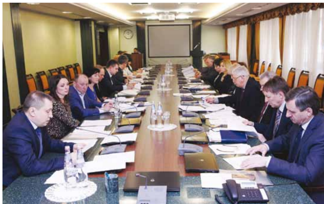
Решение участников конференции было однозначным: все пункты колдоговора выполняются добуквенно