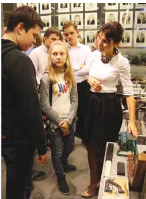
Школьникам показали предметы быта почти вековой давности