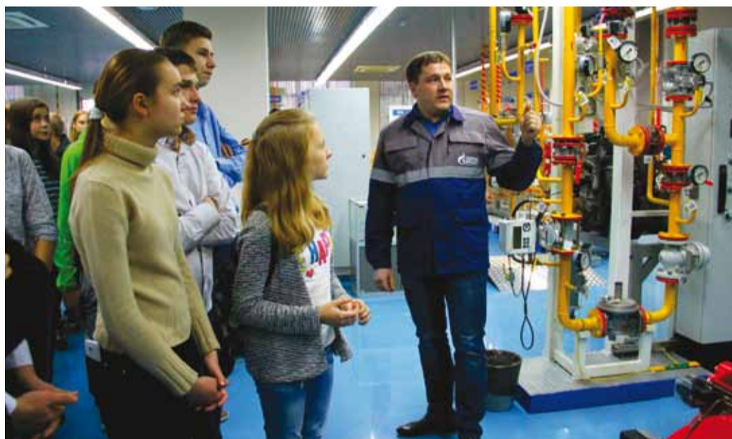
Дети впервые познакомились с устройством котельной