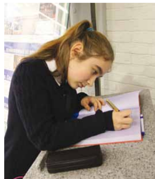
Ребята оставили слова благодарности в книге отзывов музея предприятия