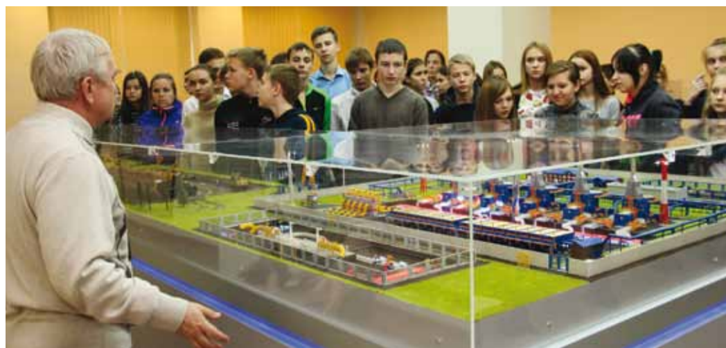
Педагоги Учебного центра рассказали ребятам о технологических процессах на газотранспортном предприятии

После беседы со специалистами Учебного центра для школьников прошла экскурсия в корпоративном музее, где им рассказали о зарождении ведущей отрасли в стране и показали первые газовые приборы и предметы быта почти вековой давности. Также в связи с предстоящими каникулами подросткам напомнили о правилах дорожного движе-