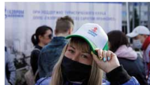
Задание получено – пора в путь!