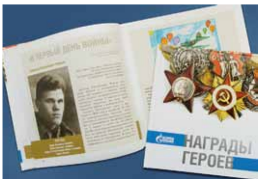
За каждой наградой – своя история