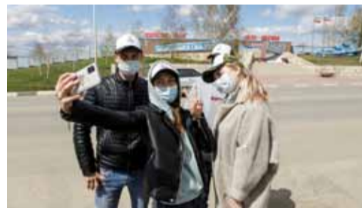
Команда Петровского ЛПУМГ