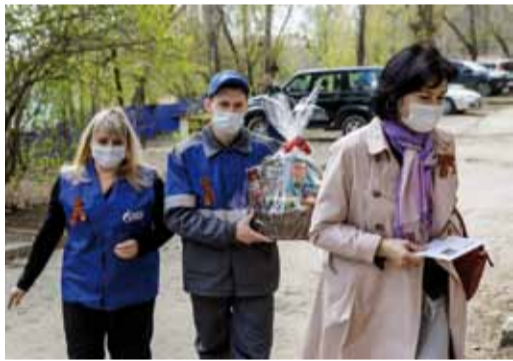
Накануне праздника поздравили 40 ветеранов.

Чтить подвиг наших предков, отдавать дань бесконечного уважения героям – святая традиция для нашего предприятия. Накануне главной даты нашей страны работники филиалов заглянули в гости к своим ветеранам, поздравили их с наступающим праздником и передали подарки.