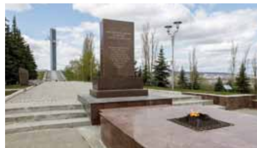
Среди загадок - Аллея Героев в Парке Победы