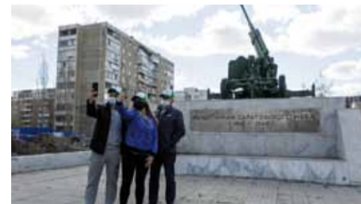
Селфи на фоне памятного места

же писал в своем романе «Жизнь и судьба» Василий Гроссман.