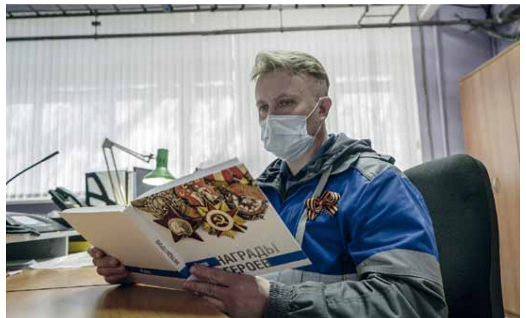
Издание стало подарком к празднику и работникам предприятия и его ветеранам

Были отобраны 44 ордена и медали, которыми награждали участников Великой Отечественной войны. В дополнение к справочной информации о наградах было решено использовать детские сочинения об их родственниках, обладателях данных наград. Каждый участник войны был достоин медалей и орденов, но награждены не все. Сверявшись со списками о родственниках, которые работники предприятия сами заполняли еще пять лет назад, мы отобрали тех, кто был награжден, и попросили, чтобы их дети, внуки, племянники написали сочинения.