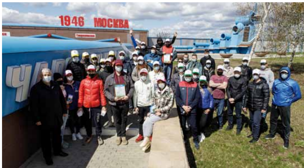
Общее фото на финише автоквеста