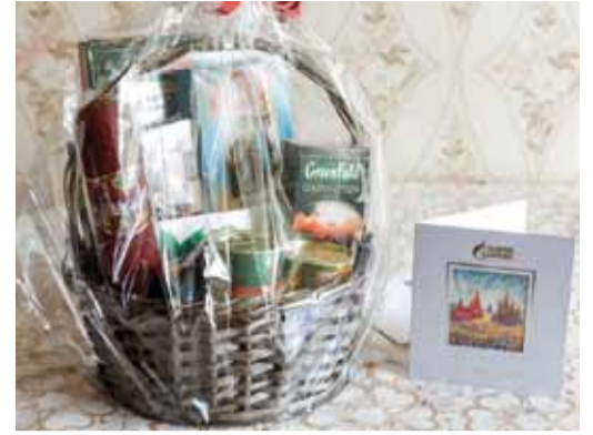
В гости не с пустыми руками.

Своих гостей ветераны не хотели отпустить, звали на чай, задавали много вопросов. «Ну как там на работе сейчас? Что нового?» – спрашивали они. Ведь общение для них как глоток свежего воздуха, его жаждут, и оно окрыляет. А затем они уже сами погружались в водоворот воспоми-