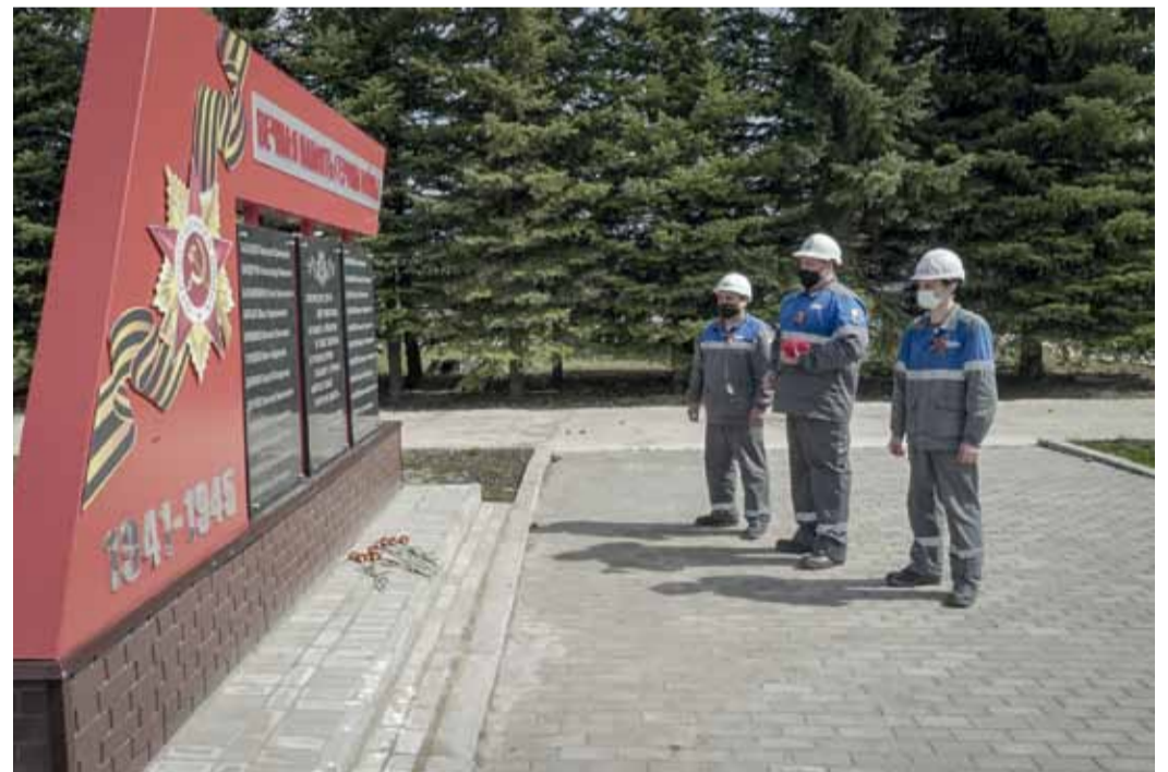
Работники Петровского ЛПУМГ продолжили дело своих предшественников