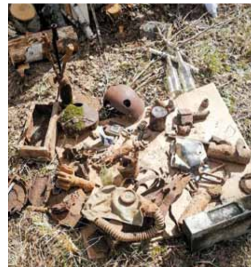
Каждый день – новые находки