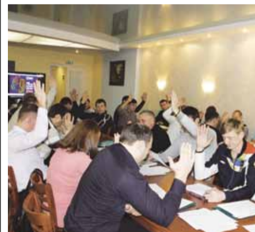
После обсуждений, а, порой, и споров участники семинара пришли к общему мнению

По традиции, в январе в «Родничке» собираются представители профсоюзных комитетов филиалов, ответственные за спортивно-оздоровительную работу. Они подводят итоги года, обсуждают проблемы, утверждают планы на предстоящий сезон.