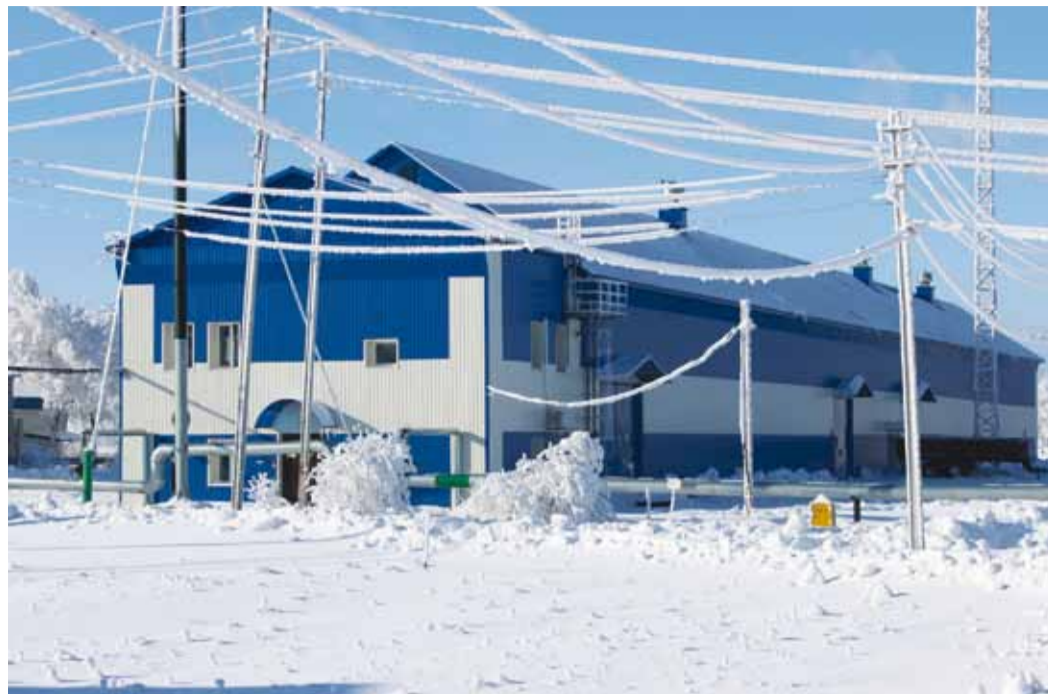
Здание бывшего компрессорного цеха, того самого - первого, сейчас это гараж АТХ