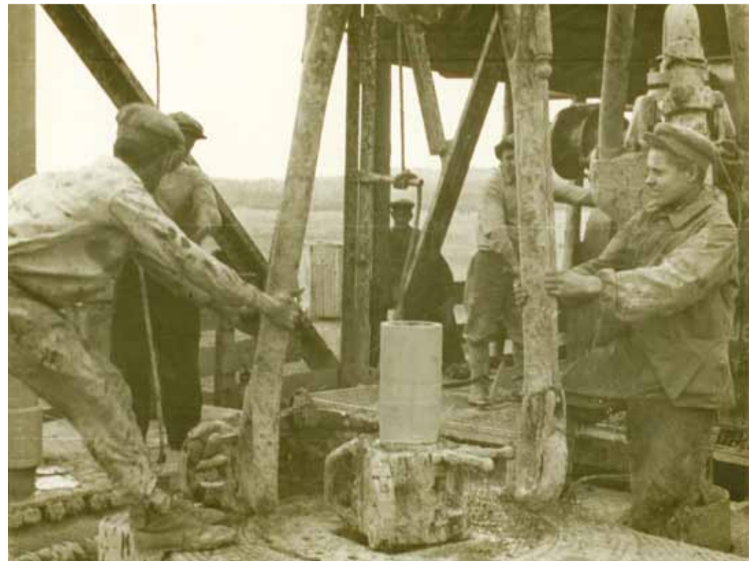
Буровая на Елшанском месторождении. Установка фонтанной арматуры

Вот такая дистанция. И это надо не только знать, но и помнить, чтобы по достоинству оценить все, что своим самоотверженным трудом и смелыми научно-техническими решениями сделали люди – организаторы производства и рабочие, инженеры и ученые, создавшие отечественную газовую промышленность.