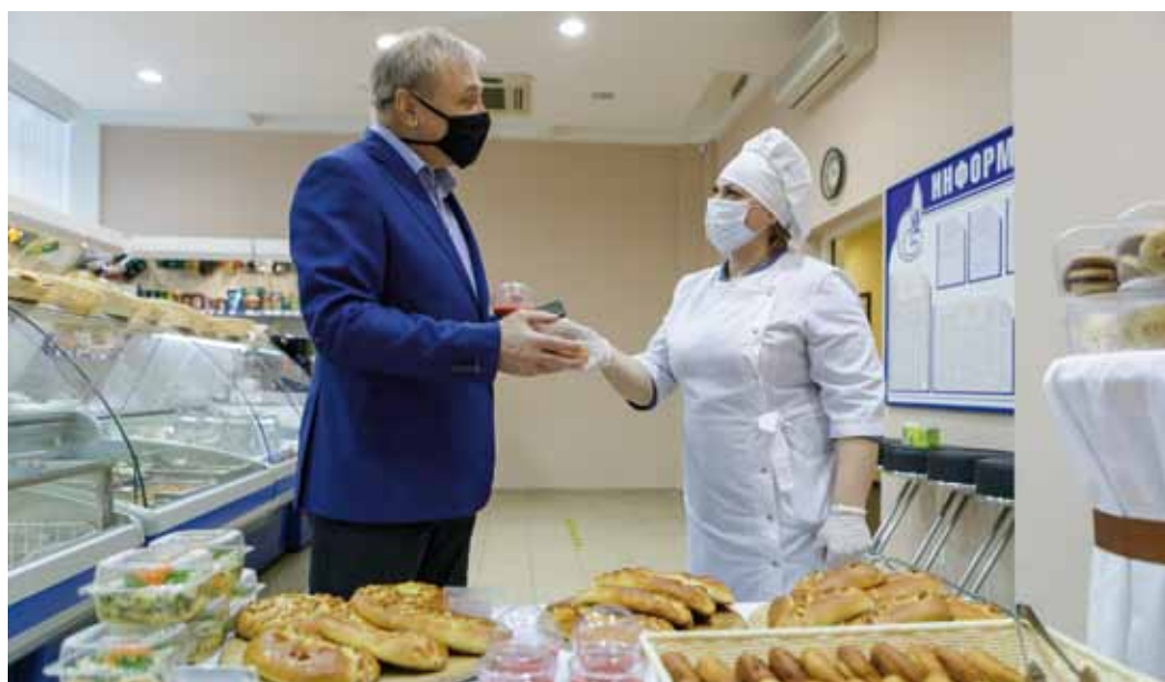
Если в течение рабочего дня захотелось перекусить – магазин всегда рядом