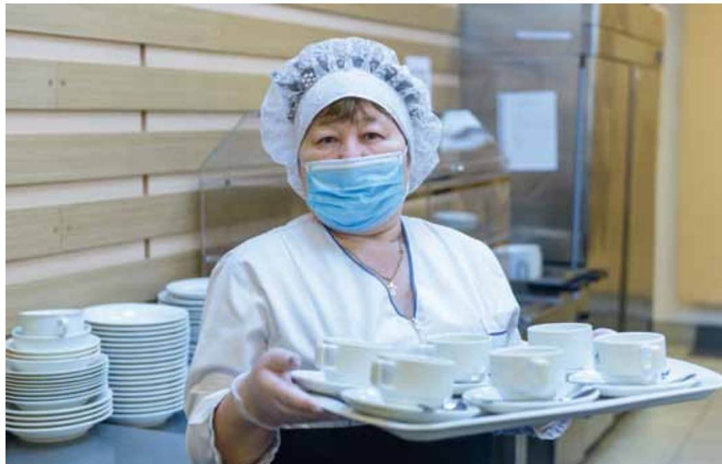
Из-под маски улыбка не всегда заметна, но посетители чувствуют радужный прием

ве проводятся социологические исследования, выявляется как общий уровень удовлетворенности услугами, так и крайне важные нюансы – что люди хотят видеть в меню, от чего можно отказаться, что нравится и нет в сервисе, довольны ли ценовой политикой. И