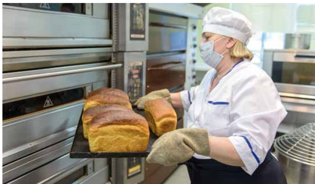
Хлеб собственного приготовления всегда свежий