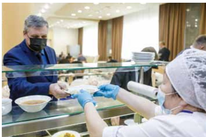
Тарелочка сытного супа придает сил на весь день