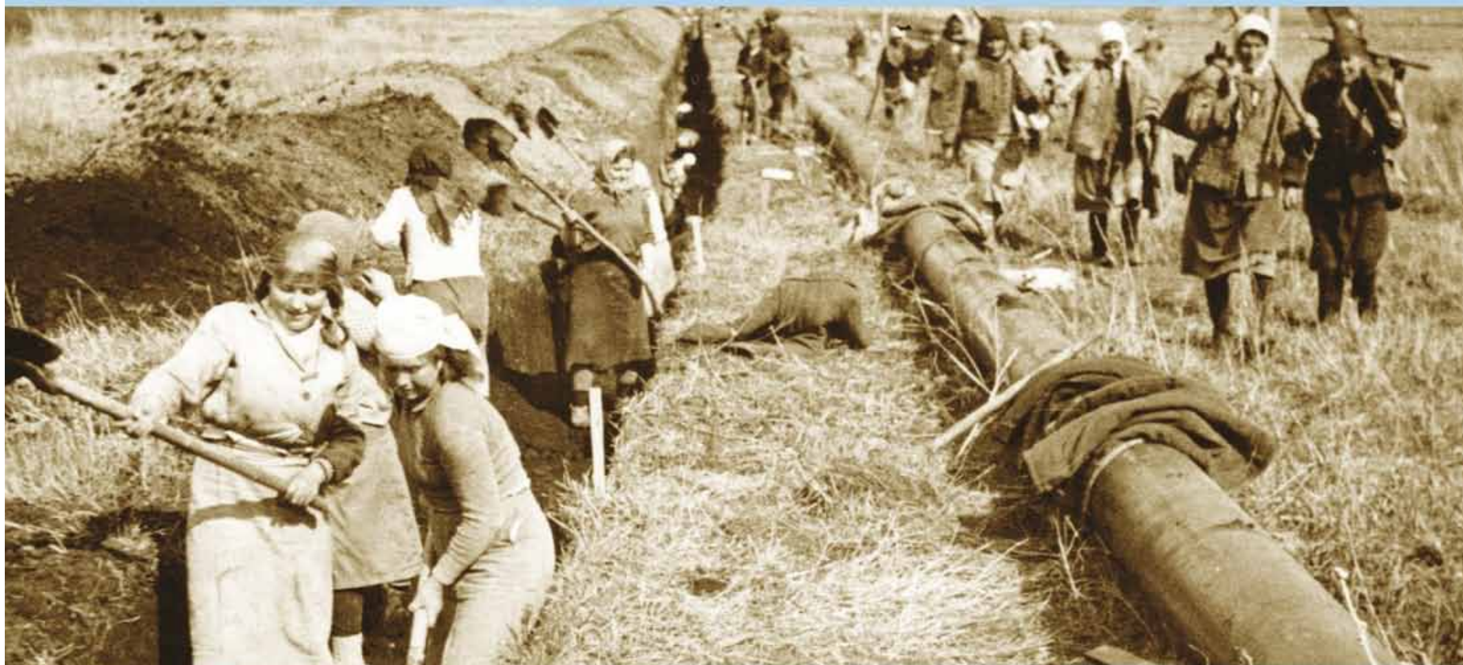
Комсомольская бригада колхоза имени Сталина на строительстве газопровода Саратов – Москва.

В истории нашего предприятия женщины всегда играли и играют важную роль. Одна из самых знаменитых исторических фотографий, отражающих вклад представительниц прекрасного пола в становление газовой отрасли, недавно стала победителем II Всероссийского конкурса фотографии ТЭК «Энергетика современной России». Прошли годы, изменились условия труда, технологии и оборудование, а женщины, как и прежде, ответственно работают во благо нашего предприятия.