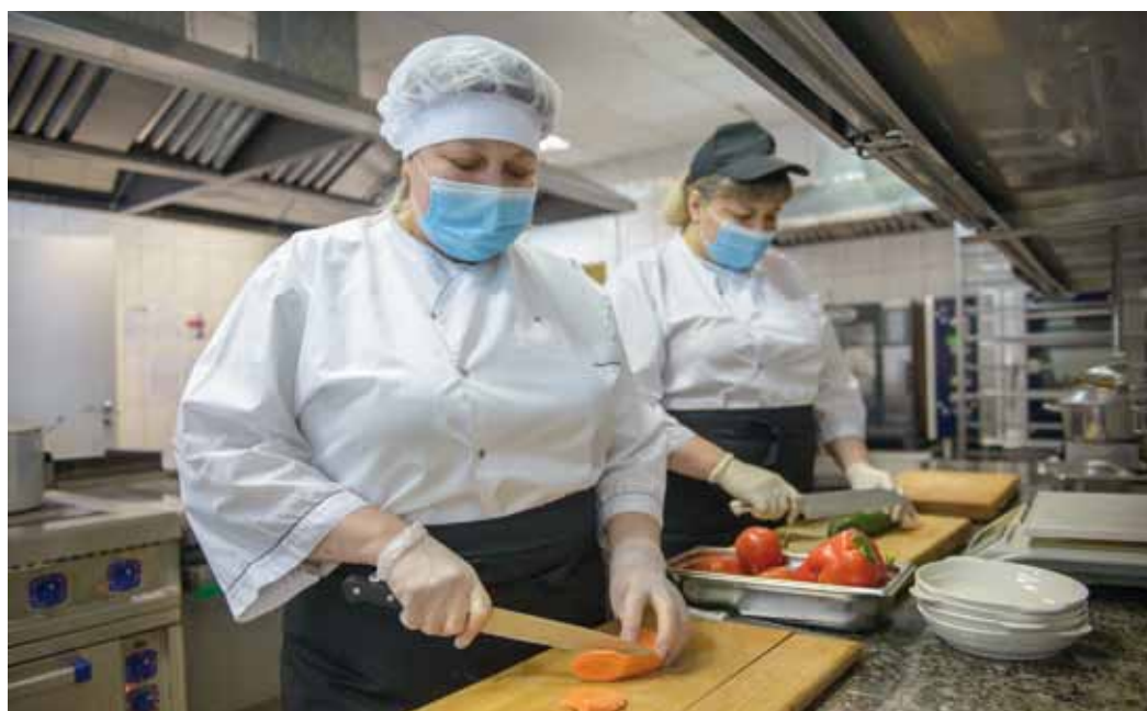
Соблюдению технологии приготовления пищи уделяется повышенное внимание

Главное в философии Саратовского управления по организации общественного питания ООО «Газпром питания» – клиентоориентированность. Причем не формальная, а самая что ни на есть искренняя. Коллектив старается, чтобы человек вышел из столовой, буфета или магазина сытый и довольный. Для этого на постоянной осно-