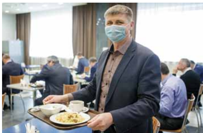
В столовую – только с хорошим настроением!