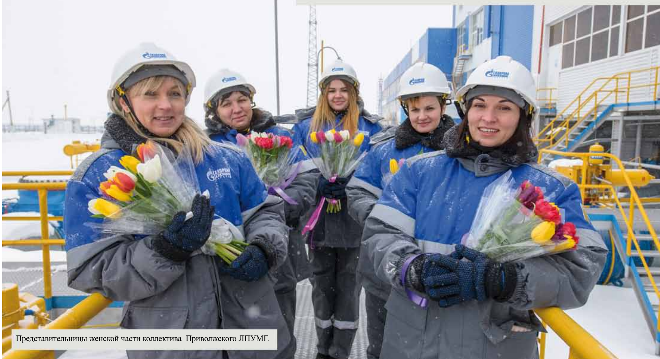
Представительницы женской части коллектива Приволжского ЛПУМГ.

В истории нашего предприятия женщины всегда играли и играют важную роль. Одна из самых знаменитых исторических фотографий, отражающих вклад представительниц прекрасного пола в становление газовой отрасли, недавно стала победителем II Всероссийского конкурса фотографии ТЭК «Энергетика современной России». Прошли годы, изменились условия труда, технологии и оборудование, а женщины, как и прежде, ответственно работают во благо нашего предприятия.