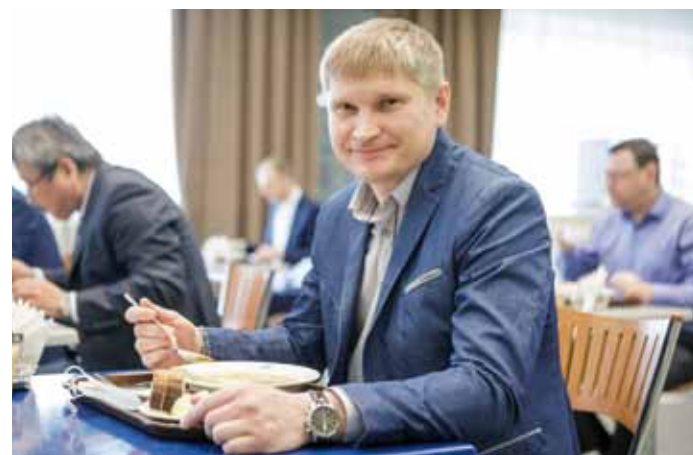
Обед – по расписанию