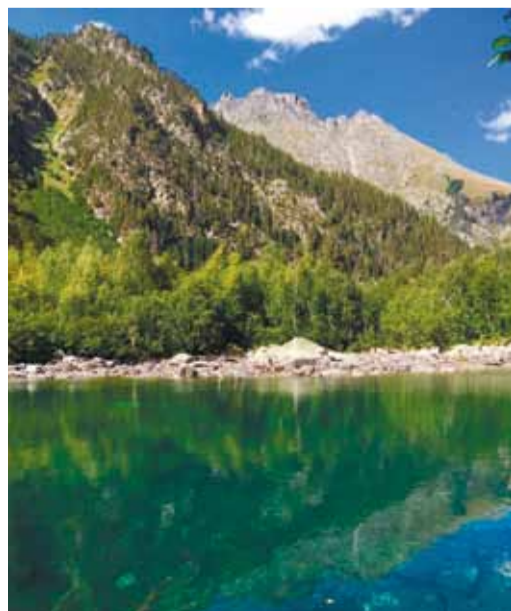
Бадукские озера поразили прозрачностью ледниковой водой

Туристический клуб ОППО «Газпром трансгаз Саратов профсоюз»