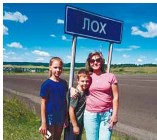
Самое популярное место внутреннего туризма – с. Лох