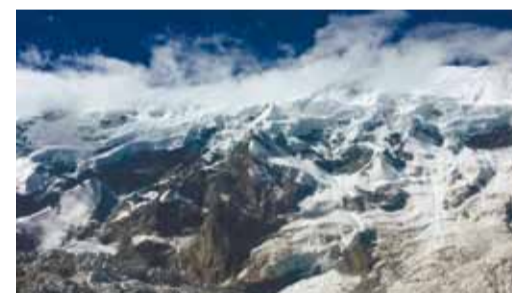
Безенгийская стена протяженностью более 12 км