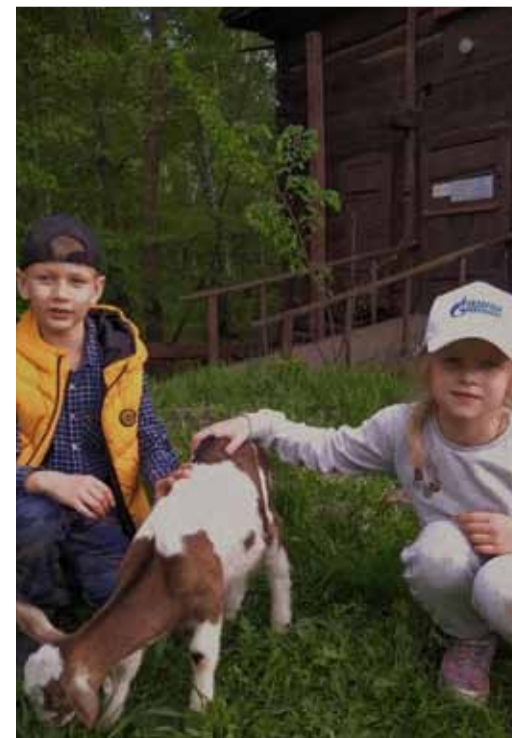
Городские жители познакомились с сельским бытом