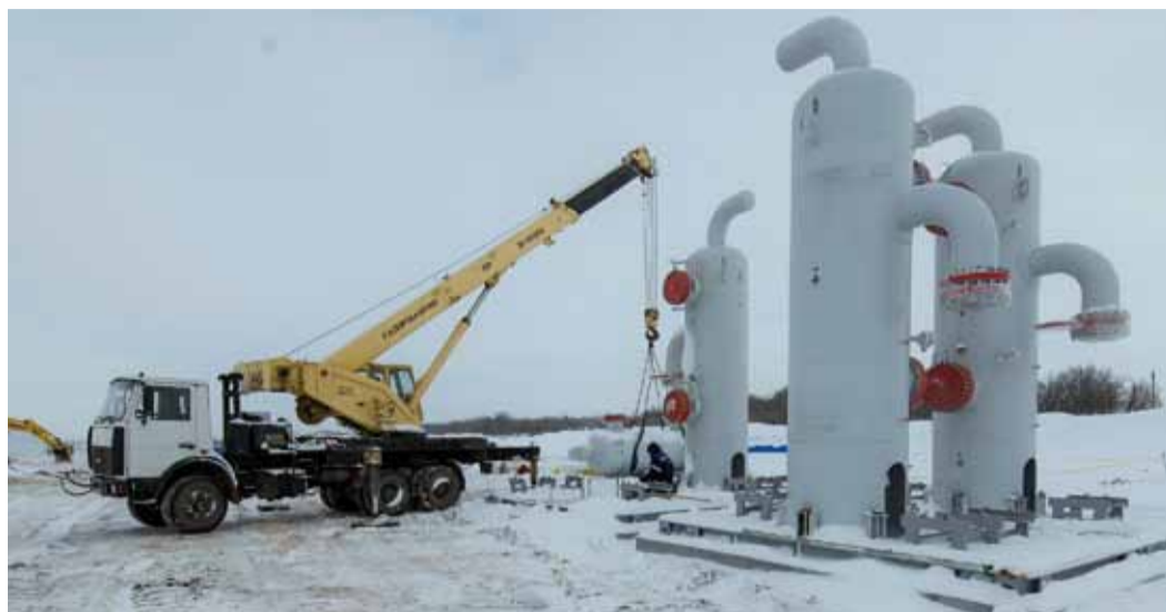
Установка пылеуловителей циклонного типа

Продолжается реконструкция одного из важнейших газораспределительных объектов региона – ГРС-7 города Саратова.