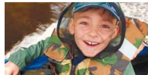
Рыбалка на Хетте – восторг и незабываемые впечатления