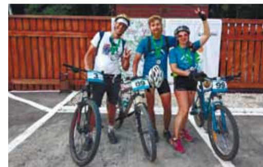
Велосипедные маршруты преодолевали в компании друзей