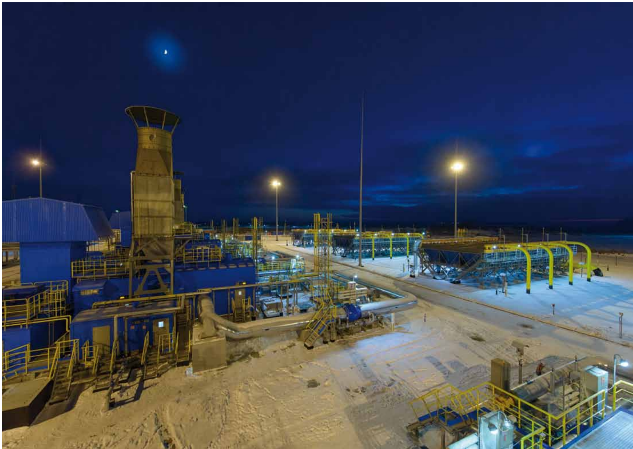
Обновленный компрессорный цех №4 Петровского ЛПУМГ готов к работе

12 января 2021 года после проведенной реконструкции был введен в эксплуатацию компрессорный цех №4 Петровского ЛПУМГ.