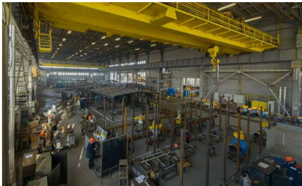
Основное технологическое оборудование станции изготовлено на саратовских заводах

возможность запускать обводную линию без вмешательства оператора. Кроме того, еще одной «фишкой» ГРС-7 можно назвать наличие ультразвуковых измерительных комплексов, которые будут с максимальной возможной точностью вести учет расхода газа.