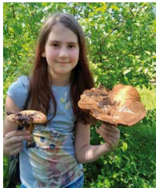
Богатство новобурасских лесов