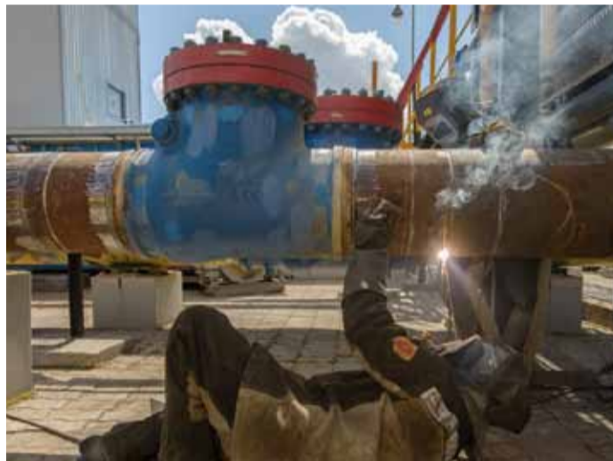
«Огневые» работы в Екатериновском ЛПУМГ