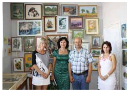
Первая выставка. Работы коллег, 2010 год

Стараясь всегда привнести что-то новое, черпая вдохновение, участвуя в мероприятиях Общества, каждый раз получаешь мощный позитивный заряд энергии. Ведь все что делаешь, делаешь не для «галочки», для людей, к каж-