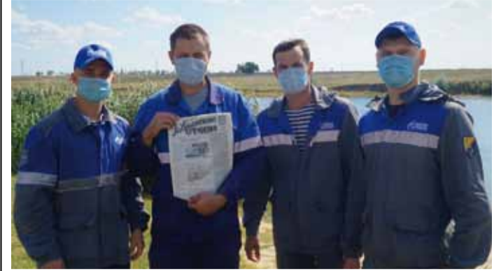
Район должен знать своих героев!

Молодежь Александровогайского ЛПУМГ в очередной раз привела в порядок территорию небольшого пляжа на реке Большой Узень.