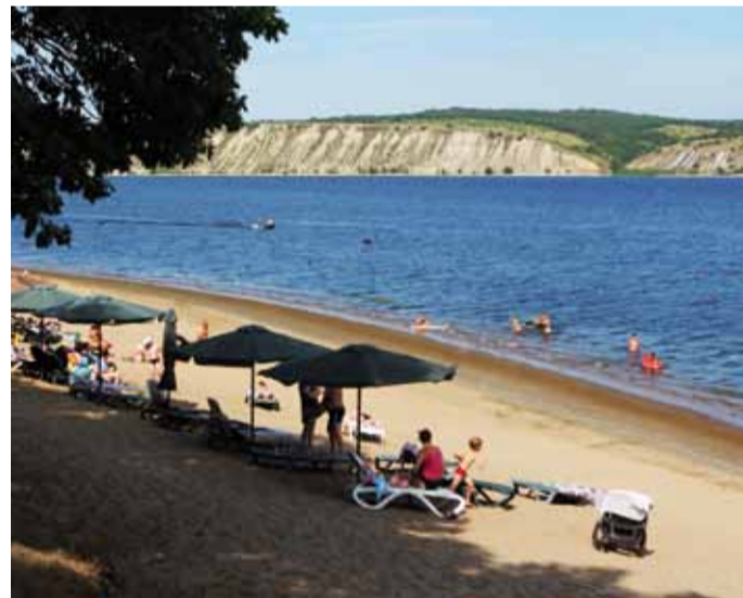
Впереди у отдыхающих бархатный сезон

Заселение в номера будет производиться по 1 человеку в номер, за исключением, когда прибывшие на отдых и оздоровление являются членами одной семьи. Дети до