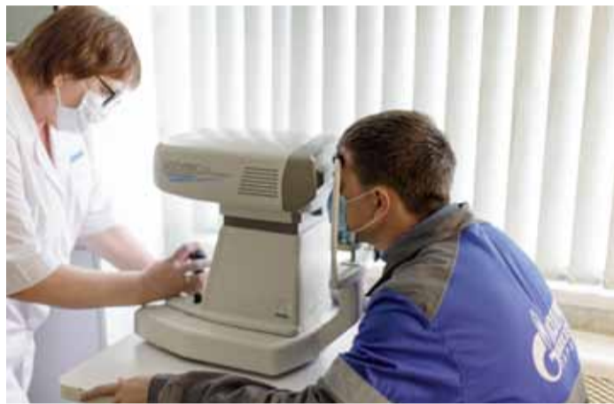
Своевременно и правильно поставленный диагноз – залог успешного лечения

По итогам 2019 года удельный вес болезней глаз в