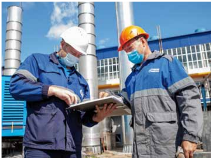
Обсуждение капитального ремонта ГПА в Мещерском ЛПУМГ