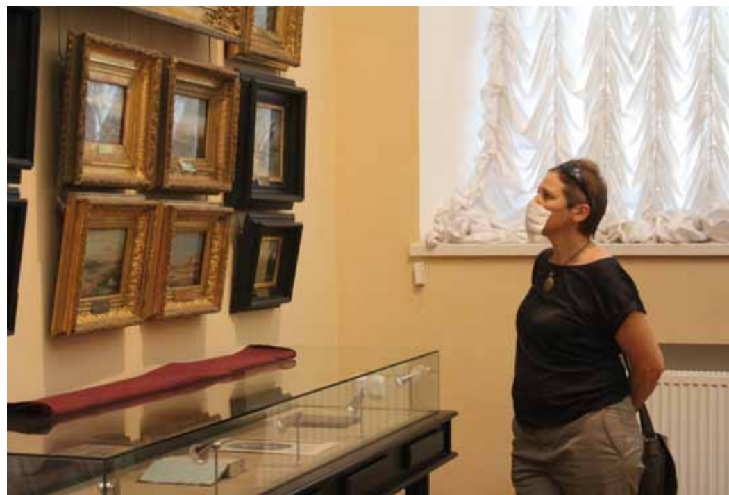
Интерес к коллекции музея не угасает

«Коллектив музея очень благодарен давнему другу и надежному партнеру ООО «Газпром трангаз Саратов» за оказанную помощь. Предприятие поддержало нас в трудную минуту, помогло открыться после продолжительного карантина, за-