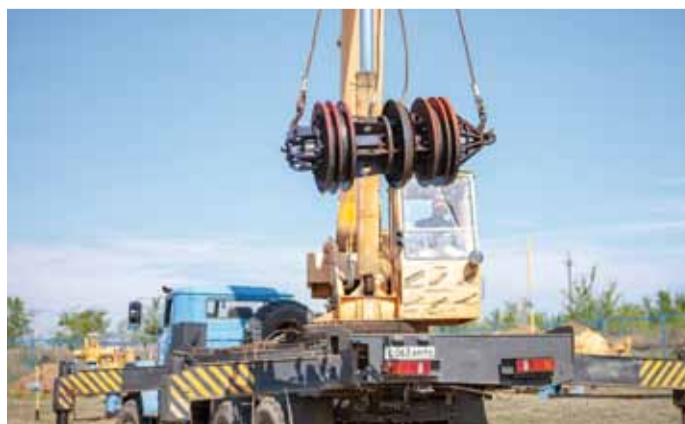
Очистной поршень сделал свое «грязное» дело