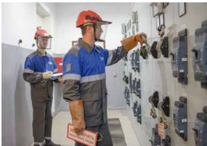
Переключения в трансформаторной подстанции

Служба ЭВС Петровского ЛПУМГ эксплуатирует 7 котельных с 20 котлами, 21,3 км теплосетей, 18,5 км воздушных линий электропередач, 24 трансформаторные подстанции, 7 водозаборных скважин