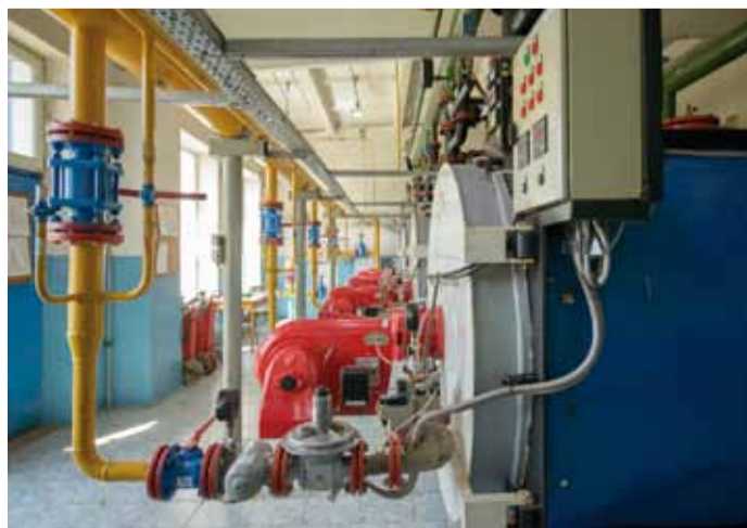
Котельное оборудование будет готово к эксплуатации в срок