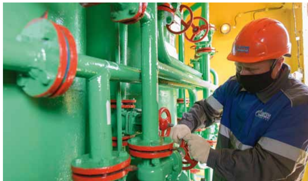
Техническое обслуживание запорной арматуры

Служба ЭВС Петровского ЛПУМГ эксплуатирует 7 котельных с 20 котлами, 21,3 км теплосетей, 18,5 км воздушных линий электропередач, 24 трансформаторные подстанции, 7 водозаборных скважин