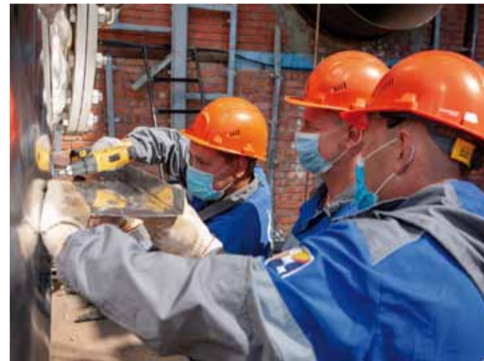
Работники подрядной организации АО «Газпром центрэнергогаз»