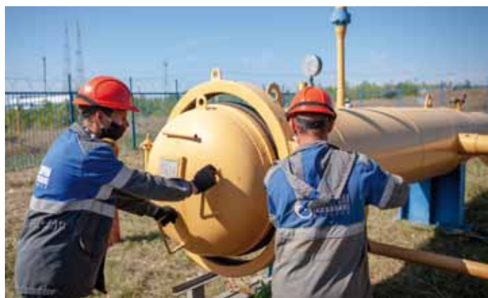
Работы завершены. Затвор камеры закрывается