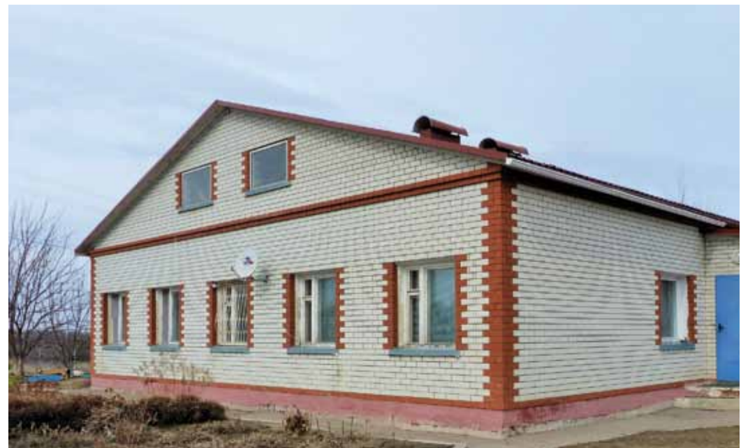
Дом оператора - неотъемлемая технологическая часть ГРС

– В соответствии с законом «О приватизации жилищного фонда в РФ» приватизации гражданами подлежат жилые помещения, находящиеся в государственной или муниципальной собственности. ООО «Газпром трансгаз Саратов» является коммерческой организацией, в связи с чем передача домов операторов на безвозмездной основе не представляется возможной. Положением о порядке отчуждения объектов имущества ПАО «Газпром» и его дочерних обществ, от-