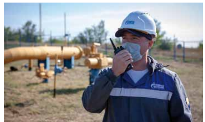
Надежная связь при проведении ВТД играет важнейшую роль