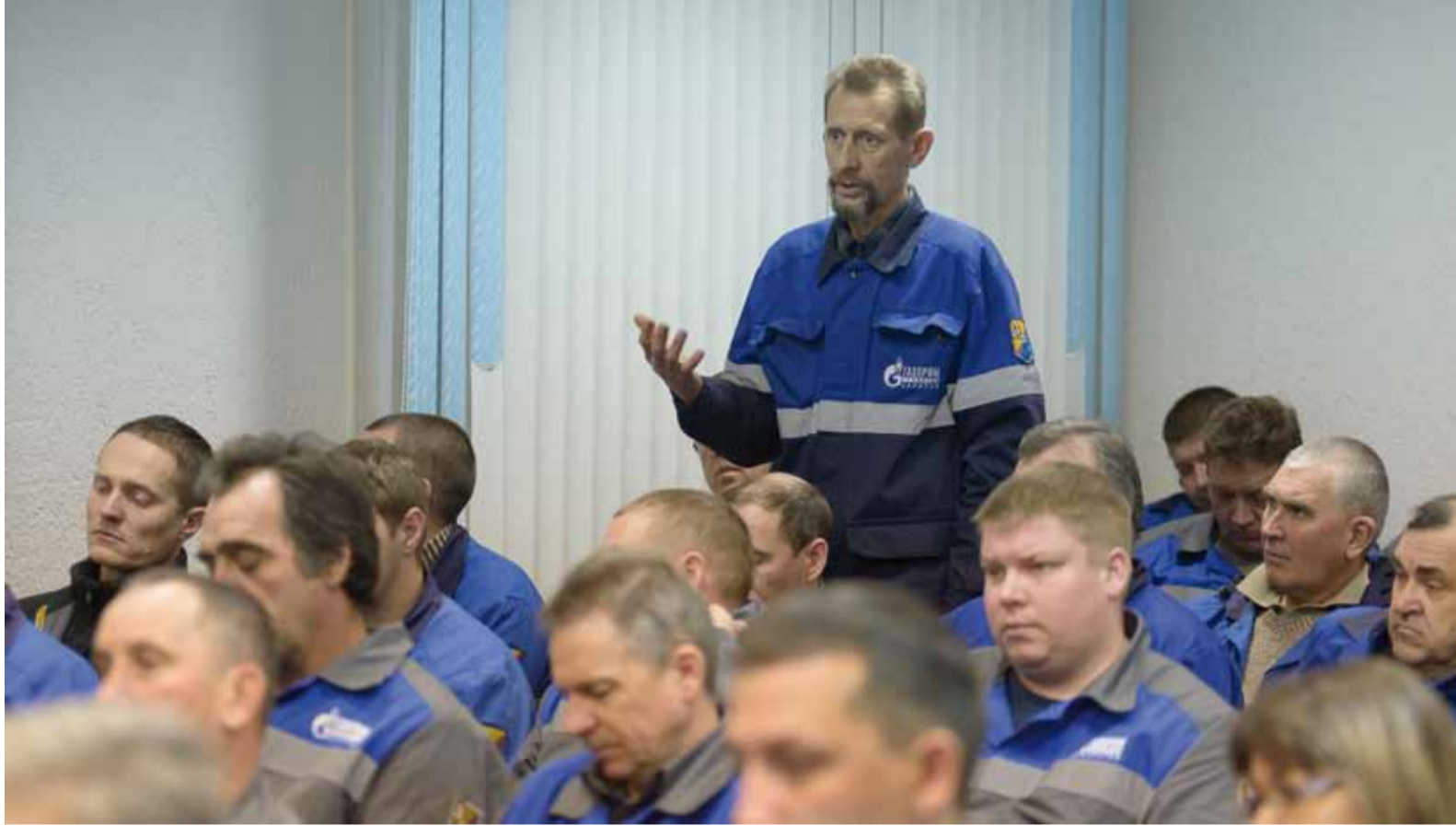
Жилищный вопрос является ключевым для многих работников

Мы продолжаем освещать тему домов операторов ГРС, которая была одной из центральных на прошлогодних встречах руководства Общества с трудовыми коллективами филиалов. Сегодня мы ответим на наиболее часто задаваемые вопросы, связанные с их эксплуатацией, реализацией и ремонтом.