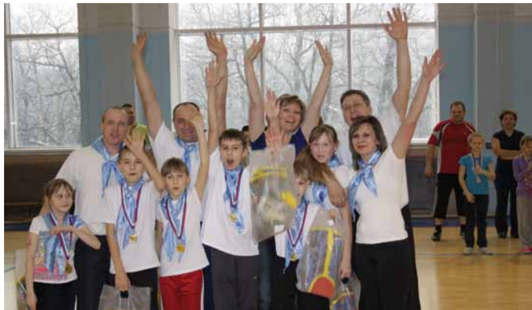
Первые «Веселые старты» в СОК «Родничок», очередная победа, 2010 год