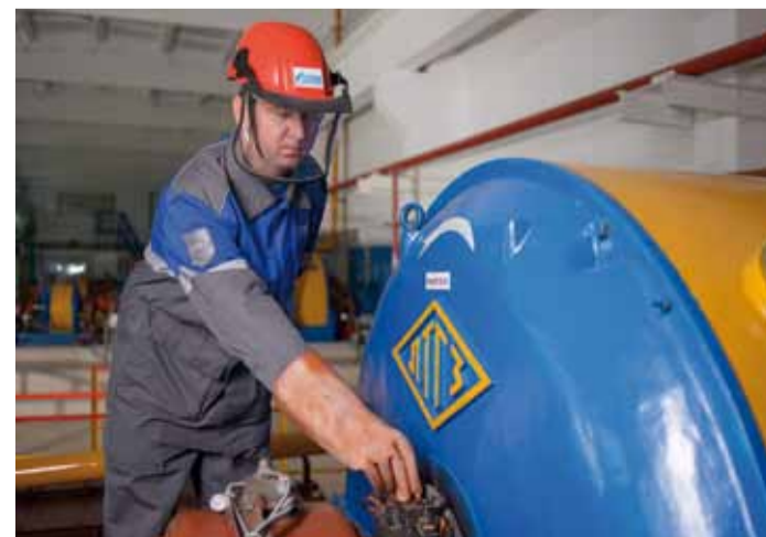
Особое внимание к электрохозяйству компрессорных цехов