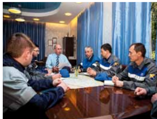
Совещание руководства филиала

За 2019 год работниками филиала: – Сварено 3182 стыка – Выполнено 6 095 резов трубы – Выполнена антикоррозийная изоляция трубопроводов в объеме 2 208 кубометров