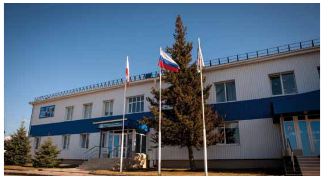
1 сентября 2020 года УАВР отмечает 15-летие со дня основания филиала

За 2019 год работниками филиала: – Сварено 3182 стыка – Выполнено 6 095 резов трубы – Выполнена антикоррозийная изоляция трубопроводов в объеме 2 208 кубометров