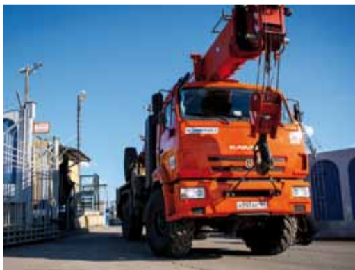
В УАВР 36 единиц спецтехники

Коллектив Управления насчитывает 272 работника. В составе УАВР 12 сварочно-монтажных бригад и 1 бригада изолировщиков.