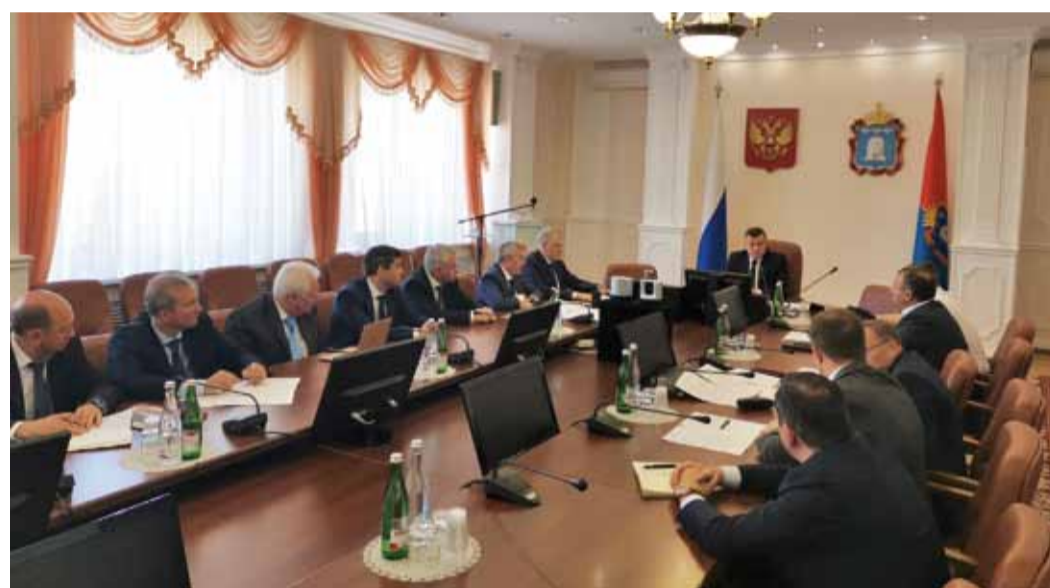
Совещание в Администрации Тамбовской области

Состоялись рабочие встречи глав Пензенской и Тамбовской областей с представителями организаций Группы Газпром. Они были посвящены вопросам газоснабжения и газификации данных регионов. Стороны обсуждали условия реализации программ развития областей до 2025 года. В частности, были рассмотрены конкретные проекты, которые повысят уровень газификации регионов и надежность газоснабжения действующих потребителей. В обсуждении приняли участие представители руководства ООО «Газпром трансгаз Саратов» и филиалов, чьи производственные объекты будут задействованы в рамках реализации программ экономического развития. В скором времени запланирована подобная встреча с руководством Саратовской области и ООО «Газпром межрегионгаз Саратов».