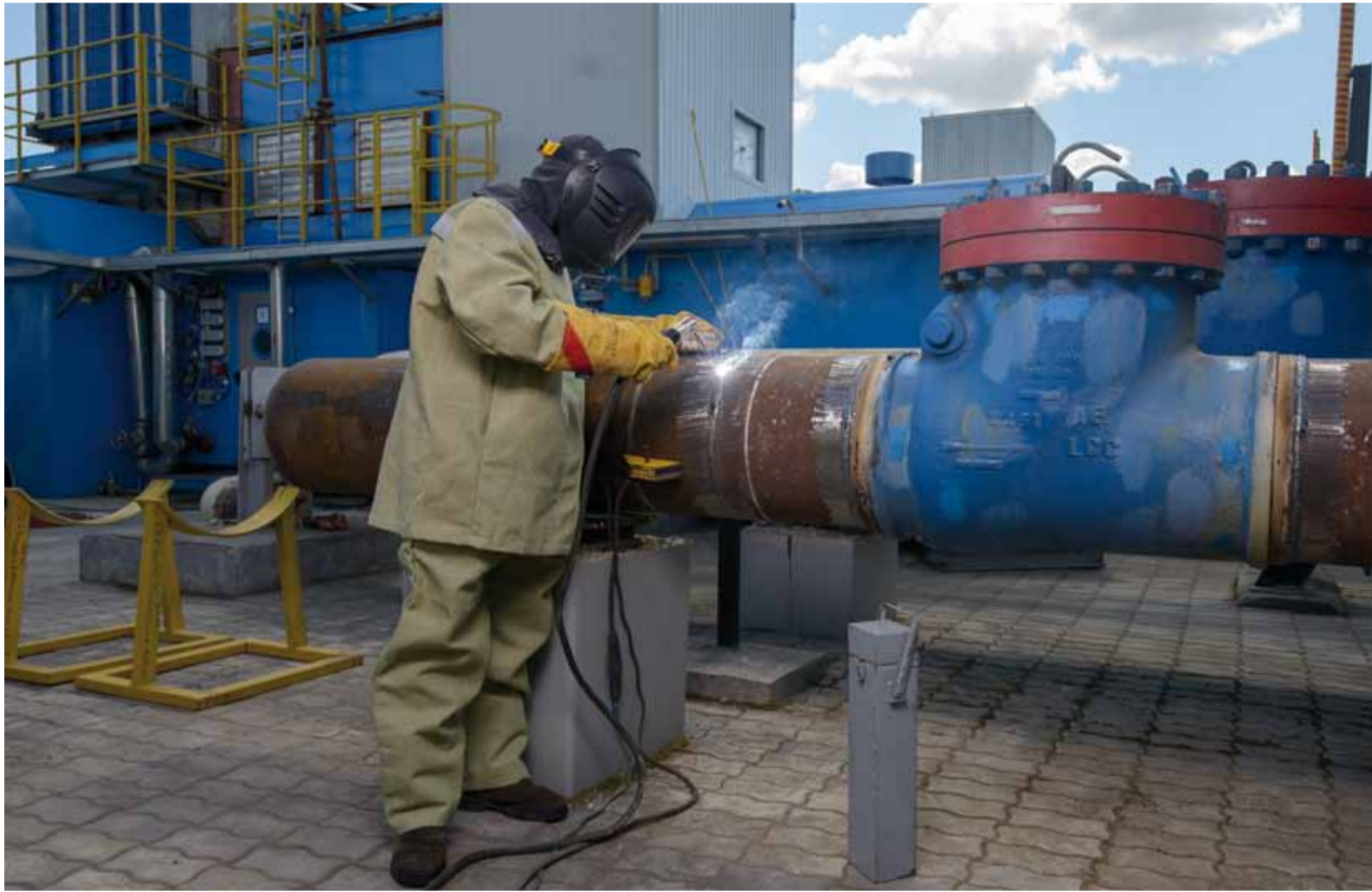
Работники УАВР ежедневно трудятся над повышением надежности и безопасности эксплуатации объектов транспортировки газа

По итогам 2019 года Управление аварийно-восстановительных работ было признано лучшим филиалом ООО «Газпром трансгаз Саратов». Мы решили узнать, за счет чего коллективу Управления удалось добиться столь весомого успеха.