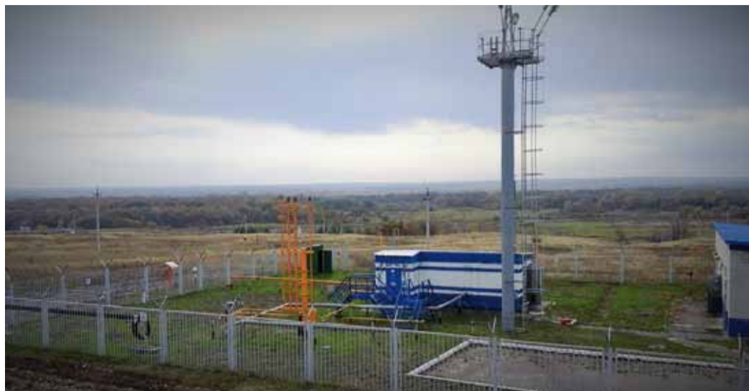
Газораспределительная станция «Широкий Карамыш».

Газовики обеспечат сетевым газом несколько сел Лысогорского района Саратовской области.