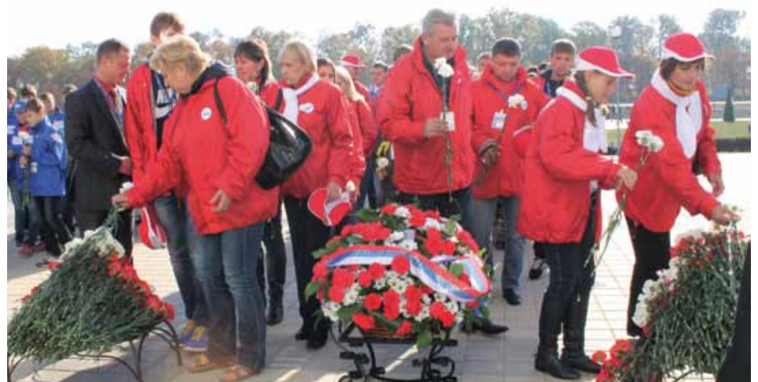
Возложение цветов на мемориале «Прохоровское поле»