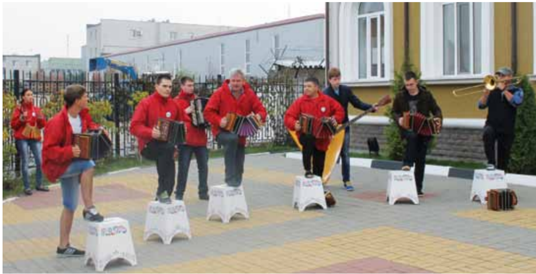
«Саратовские гармоники» время даром не теряли - репетировали даже на свежем воздухе