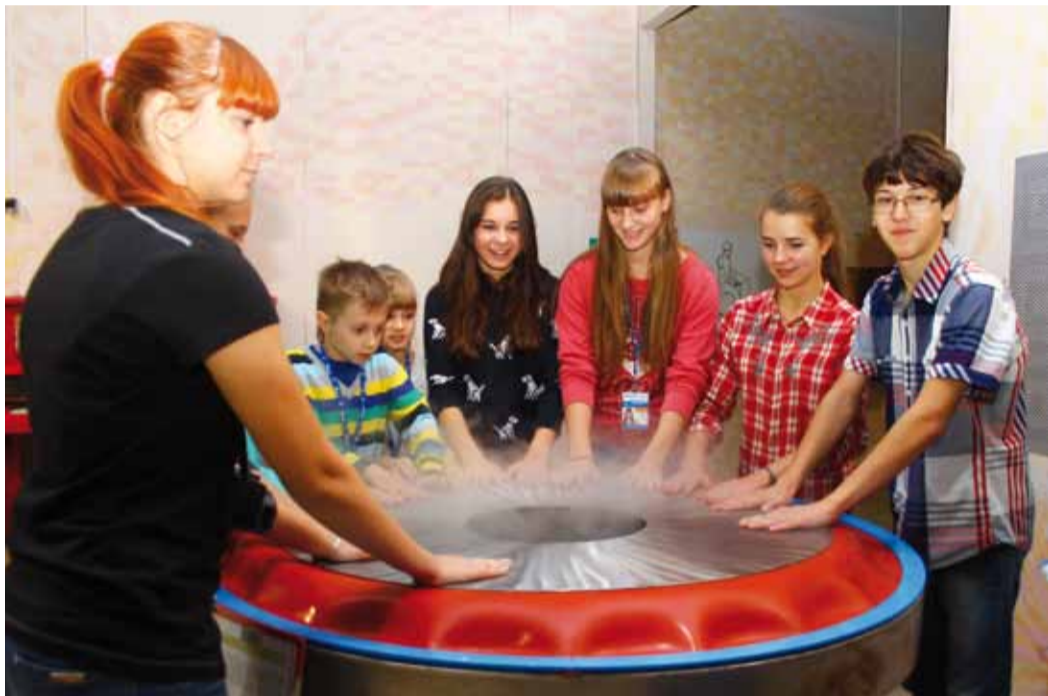
В музее занимательных наук и вправду было интересно