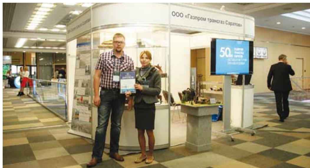
Стенд нашего предприятия на Национальном нефтегазовом форуме

С 22 по 24 октября в Центре международной торговли на Краснопресненской набережной в Москве во второй раз проходил Национальный нефтегазовый форум – первое в современной истории России мероприятие федерального масштаба, организованное Министерством энергетики Российской Федерации совместно с ведущими предпринимательскими и отраслевыми объединениями: Российским союзом промышленников и предпринимателей (РСПП), Торгово-промышленной палатой России (ТПП РФ), Союзом нефтегазопромышленников России, Российским газовым обществом.