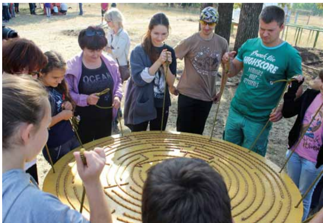
Лабиринт, в конце-концов, был пройден!

Ежегодно во вторые выходные сентября в Саратове отмечается День города. В этом году в честь праздника первичная профсоюзная организация ИТЦ подарила своим работникам и членам их семей целый день в парке приключений ZaDoor, организовав спортивное мероприятие для активного семейного отдыха в рамках Года экологической культуры и активного и здорового образа жизни в ОАО «Газпром».