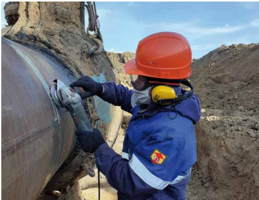
Работы на магистральном газопроводе САЦ-1

плекс огневых работ по монтажу сложных узлов на 204,5 км магистрального газопровода Петровск – Елец (расширение) и на 1687 км магистрального газопровода САЦ-2.