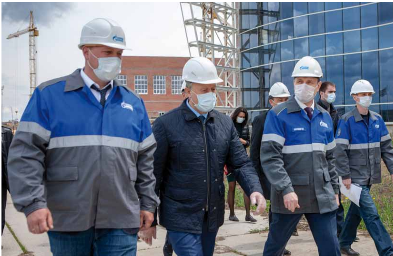
Глава региона и руководство ООО «Газпром трансгаз Саратов» посетили стройплощадку спорткомплекса в Солнечном