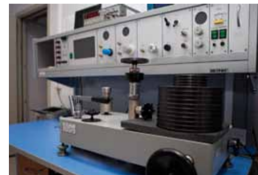
Один из эталонов Общества

Поверка, калибровка, ремонт, техническое обслуживание средств измерений и изготовление государственных образцов природного газа, контроль достоверности измерений технологических параметров, измерений количества (расхода) и показателей качества транспортируемого и поставляемого газа потребителям – далеко не полный спектр работ, выполняемых специалистами-метрологами ООО «Газпром трансгаз Саратов». Общество постоянно работает над повышением уровня и