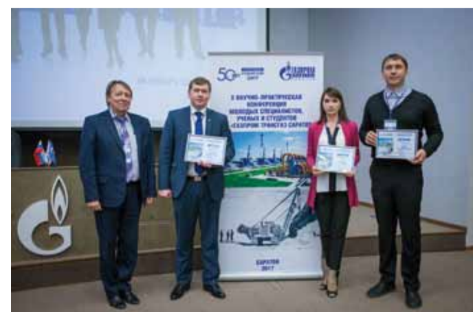
С призами конференции молодых ученых и специалистов Общества