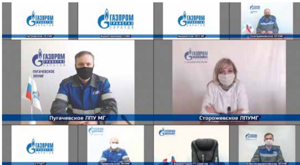
Перед каждой ВКС специалисты Управления связи с коллегами из филиалов тестируют работу оборудования

Санитарно-эпидемиологическая обстановка во всем мире диктует новые правила жизни. Определенные изменения вносятся и в рабочий процесс. В частности, это касается проведения производственных совещаний, к которым сейчас предъявляются новые строгие требования. Большим подспорьем в этих условиях является использование видеоконференцсвязи. Мы попросили специалистов Управления связи рассказать о данной технологии.