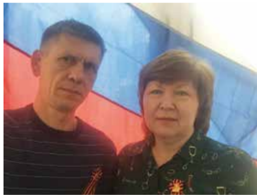
Российский флаг – наша гордость!

В память о бессмертном подвиге отцов, дедов, прадедов мы передавали друг другу #Георгиевские ленточки, вспоминали любимые песни военных лет, участвуя в акциях #Великие песни Великой Победы, репетиро-