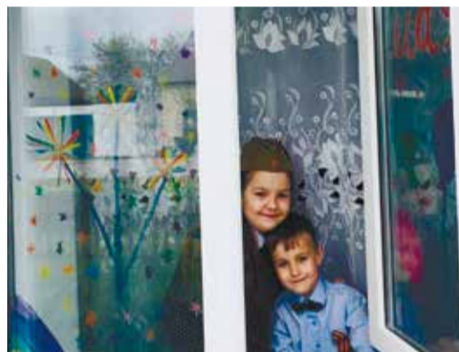
Дети активно участвовали в подготовке к празднику

Балашовского ЛПУМГ. Она спела песню непоколебимой веры в Победу – «Синий платочек».