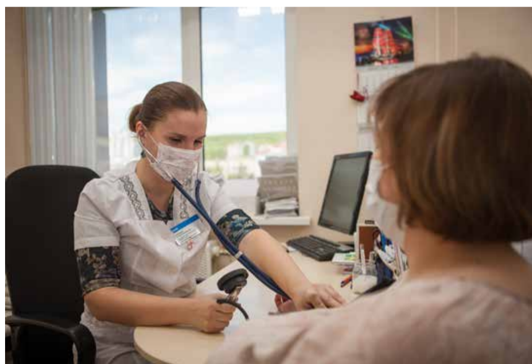
Одна из задач реализации программы – постоянный мониторинг состояния здоровья работников

Для систематизации работы в этом направлении на нашем предприятии реализуется программа профилактики развития сердечно-сосудистых заболеваний и сердечно-сосудистых осложнений у работников ООО «Газпром трансгаз Саратов» на период