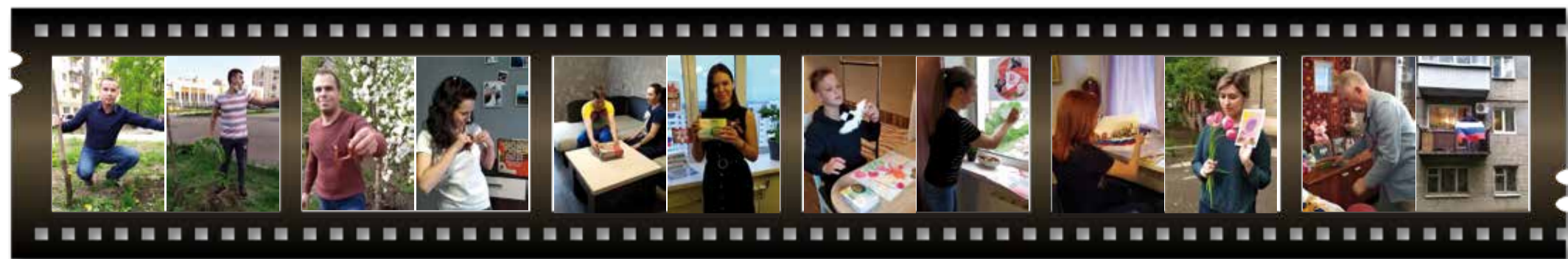
Фрагменты видеоролика об участии работников ООО «Газпром трансгаз Саратов» во всероссийских акциях и мероприятиях, посвященных Дню Победы