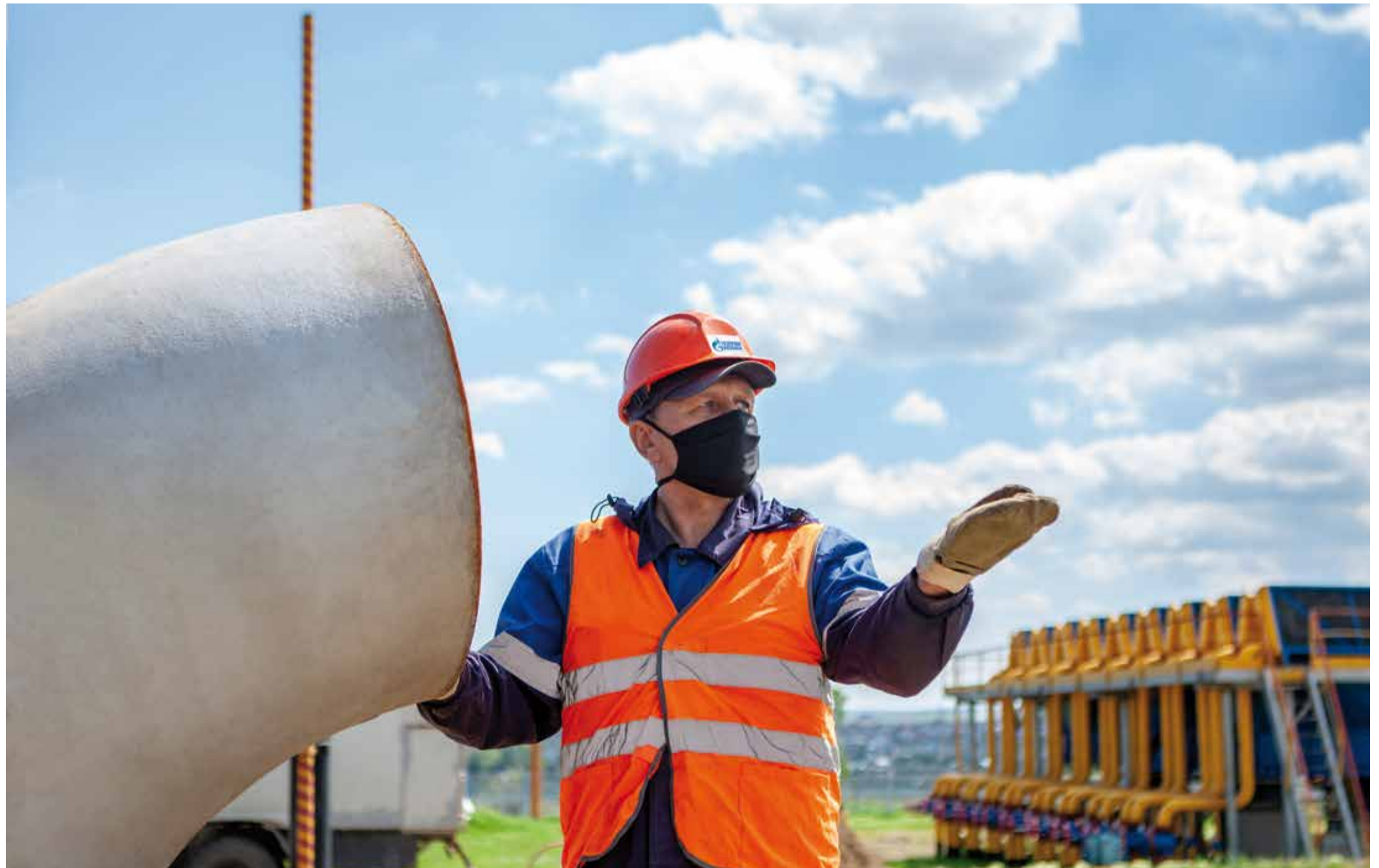
Монтаж соединительной детали на выходной трубопровод технологической обвязки центробежного нагнетателя ГПА-Ц-6,3 №5

В Сторожевском ЛПУМГ продолжается выполнение плана мероприятий, направленных на устранение дефектов сварных соединений трубопроводной обвязки центробежных нагнетателей КЦ №2.