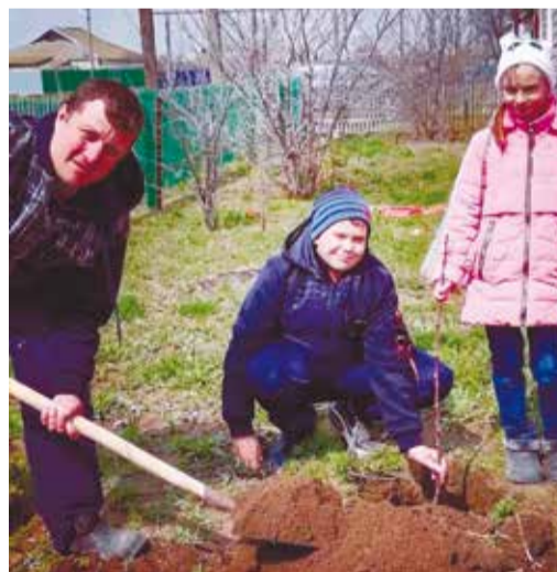
Памятное дерево сажали всей семьей

Большой популярностью среди работников нашего предприятия пользовалась акция #Сад Памяти. На приусадебных участках, дачах, палисадниках около дома участники высаживали деревья и цветы, выкладывая фотографии в социальные сети и отмечая