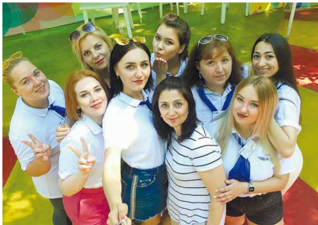
Вожатые «Родничка» – дружная команда единомышленников!

Наверное все было бы по-другому, если бы меня не поддерживала моя семья, так случилось, что она тоже творческая и ее