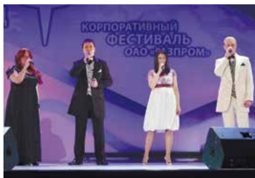
Ансамбль «Высокое давление»

нашлись единомышленники, с которыми мы помимо основной работы творили и создавали интересные проекты. Это и концертные программы, корпоративные мероприятия, поездки в отдаленные районы нашей области с концертами, подготовка номеров к корпоративному фестивалю «Факел» и много, много репетиций, споров, о которых знали только мы – участники квартета «Высокое