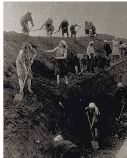
Женщины вручную копают траншею для газопровода