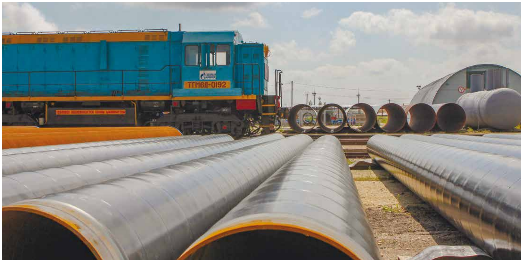
Поставка материалов в УМТСиК и их отгрузка в филиалы производится в штатном режиме

Важнейшая составляющая любого производства – отлаженная система снабжения. О том, сказываются ли вызовы времени на работе Управления материально-технического снабжения и комплектации Общества, читайте в нашем материале.