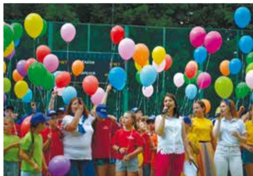
Наша работа – дарить праздник детям

Здесь полет для творческой фантазии не ограничен, проводится по несколько мероприятий в день различной тематики – конкурсы, игры, праздничные программы, викторины, квесты: все это нужно придумать, организовать и воплотить в жизнь. Дети с