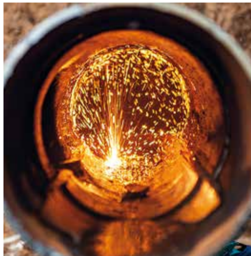
В «огневых» были задействованы 2 сварочно-монтажные бригады УАВР

За время проведения работ в газопровод было врезано 6 «катушек». Сварен 21 стык. Ремонт выполнен в полном объеме и строго в отведенное время.