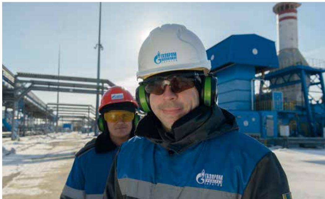
Контроль за использованием работниками спецодежды и спецобуви – важный элемент системы охраны труда

Продолжаем серию публикаций о важности соблюдения требований производственной безопасности. Ранее мы рассказали о первом уровне административно-производственного контроля (АПК), сегодня мы поговорим о втором, который осуществляется руководителем структурного подразделения.