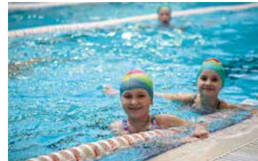
Дети работников – полноценные участники спортивной жизни Общества

Создавая такие условия для своих сотрудников, наш «трансгаз» активно помогает развивать спорт в регионах присутствия.