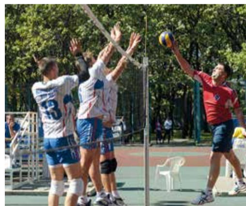
Корпоративный спорт объединяет коллектив

Популярны среди газовиков занятия спортивным туризмом, при объединенной