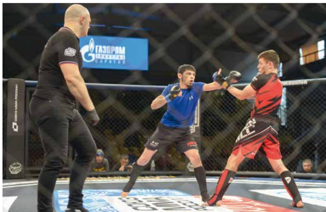
Поддержка спортсменов региона – одна из важных социальных миссий крупного предприятия

Я понял, насколько серьезная работа ведется на предприятии. А начинается все с уровня филиала – здесь между собой соперничают службы и цеха, при этом к названным видам спорта тут могут добавляться, например, рыбалка и дартс. В филиалах спортсменов экипируют, выдают необходимый инвентарь. Победителей награждают призами и подарками. Ну а венчает всю си-