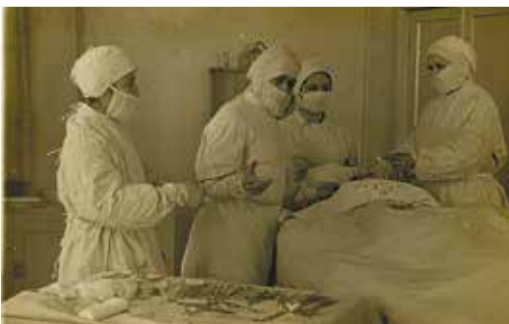
В годы войны в области располагалось более 180 госпиталей

Во время войны рабочий колхоза может стать бойцом, для медработника война не меняет профессию: как и в мирное время он выполняет свой долг – спасает жизни.