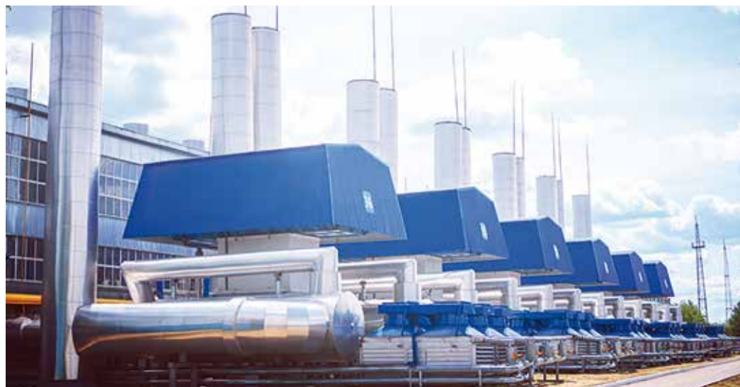
Каждый производственный объект филиала проверяется не реже одного раза в полгода