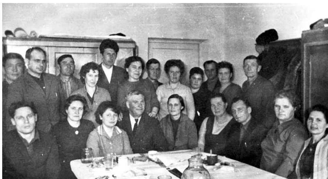
Коллектив Саратовской конторы газопередачи.