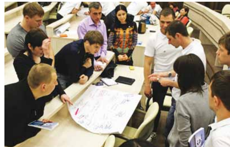
На одной из рабочих площадок форума