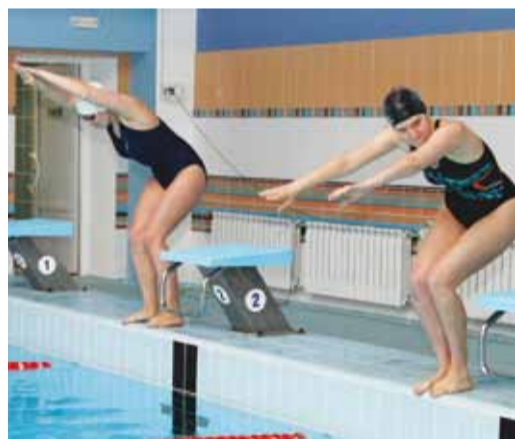
Волнительное ожидание старта

В день соревнований на Саратов неожиданно обрушилась метель, и город оказался в снежном плену. Однако капризы погоды не помешали 28 энтузиастам, приверженцам активного образа жизни, собраться в спортивно-оздоровительном комплексе «Родничок». Соревнования не просто состоялись – получился яркий праздник спорта и дружбы.