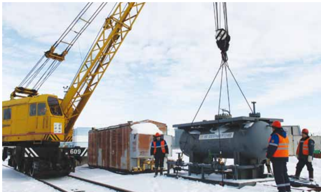
Идет разгрузка оборудования

Много интересных культурно-массовых мероприятий проводится и внутри филиала. Все это я считаю важной частью жизни коллектива, которая способствует его сплю-