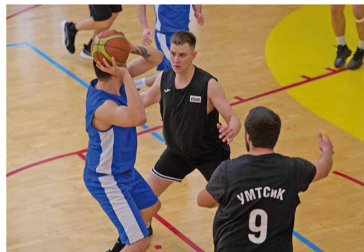
Полуфинал: Балашовское ЛПУМГ – УМТСиК