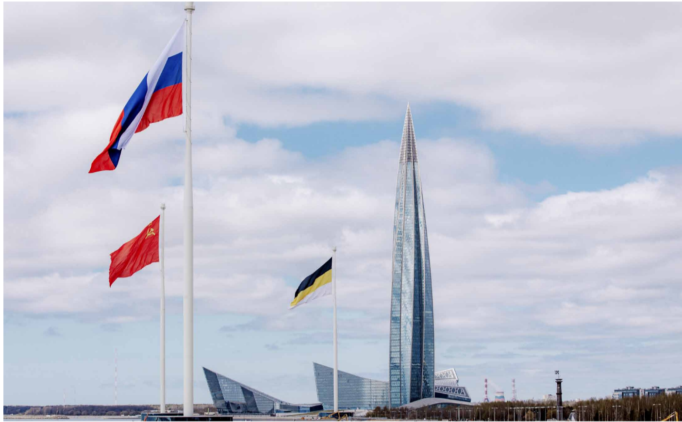
Лакhta Центр.

В центральном офисе ПАО «Газпром» в Санкт-Петербурге состоялось совещание по рассмотрению производственно-хозяйственной деятельности ООО «Газпром трансгаз Саратов» за 2024 год.