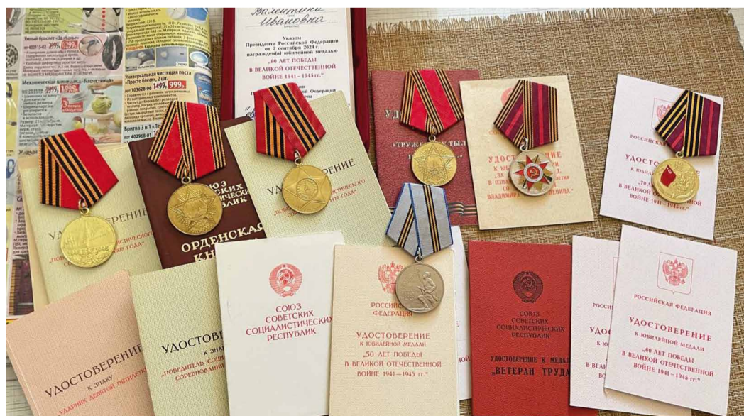
Бережно хранимые награды