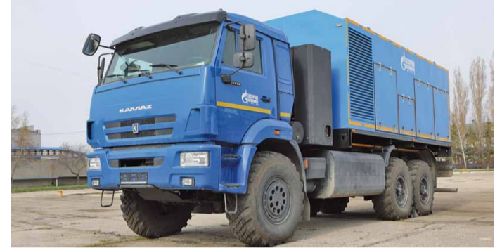
Азотная КС на базе УМТСuK

Парк автомобильной спецтехники ООО «Газпром трансгаз Саратов» пополнился азотной компрессорной станцией СДА-5/11М производства Уфимского компрессорного завода на шасси КАМАЗ-43118.