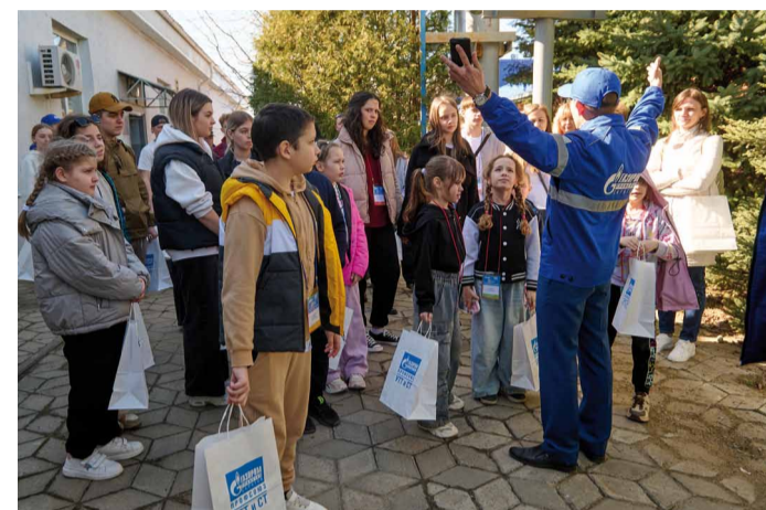
Работа в Газпроме дает вот такие возможности!