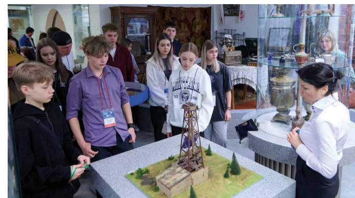
В Музее трудовой славы Общества

Экскурсанты проявили большую заинтересованность увиденным, они активно фотографировались на память, задали сопровождавшим их взрослым множество вопросов и получили на них ответы