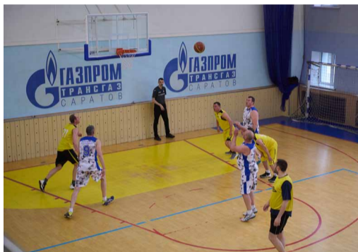
Матч за «бронзу»: УАВР – Башмаковское ЛПУМГ

В итоговых играх приняли участие баскетболисты Башмаковского, Петровского и Балашовского ЛПУМГ, а также Администрации, УАВР и УМТСиК.