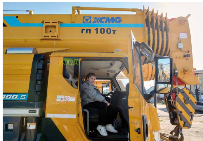
Эмоции – положительные