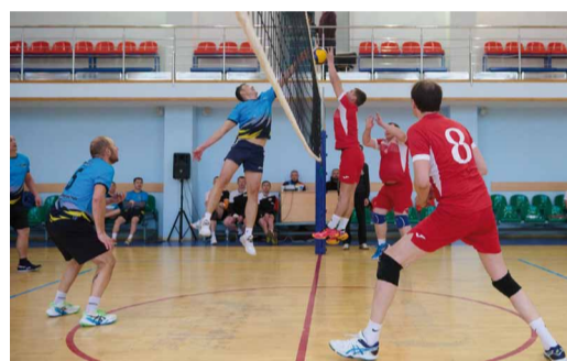
Борьба за мяч