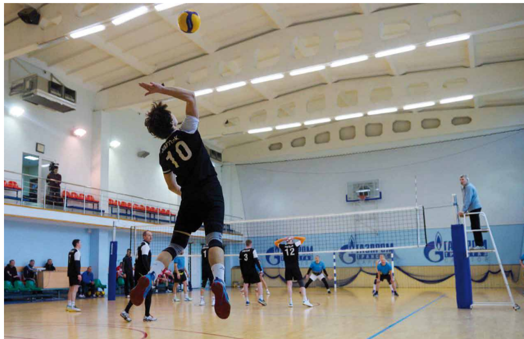
В полете игры