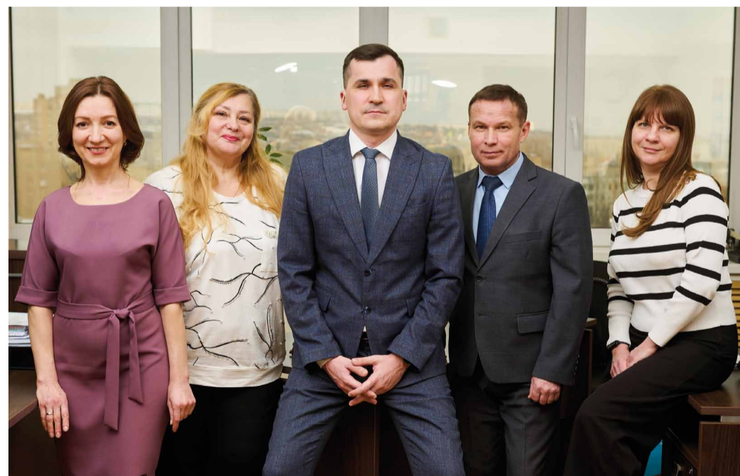
Отдел подготовки и проведения закупок

В 2014 году, с внедрением в компаниях Группы Газпром автоматизированной системы электронных закупок (АСЭЗ), работниками отдела при технической поддержке