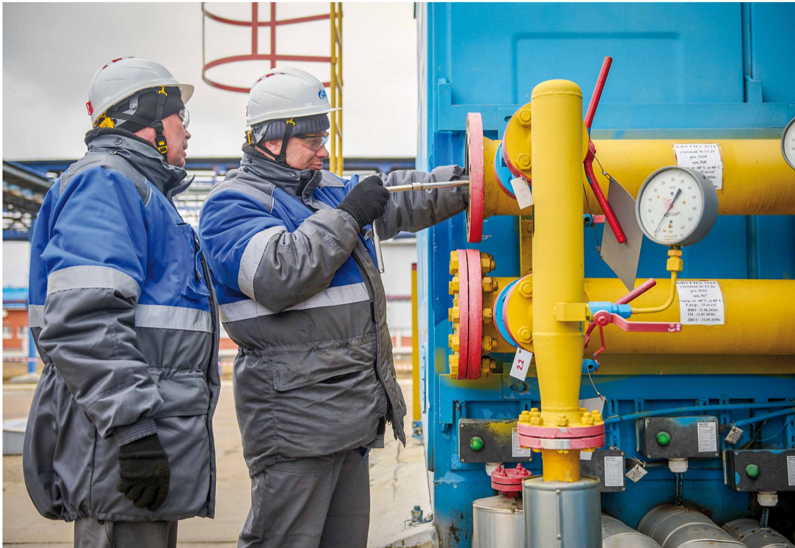
Осмотр и замена топливных фильтров в рамках среднего ремонта ГПА на КС «Новопетровская»

В ООО «Газпром трансгаз Саратов» набирает ход реализация программы текущих, средних и капитальных ремонтов газоперекачивающих агрегатов (ГПА).