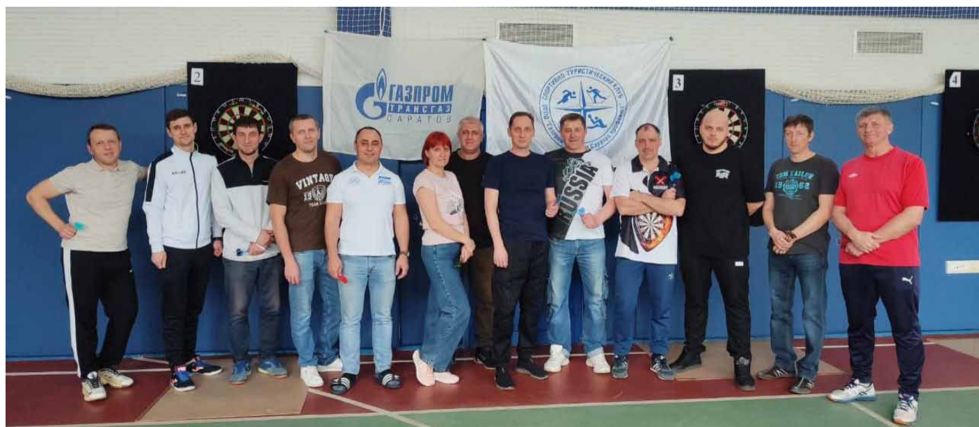
Участники 1 тура Дартс Лиги – 2025