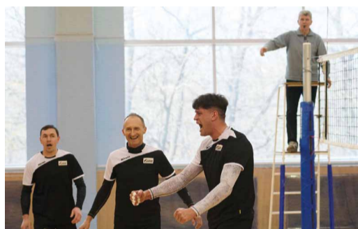
Мы сделали это!