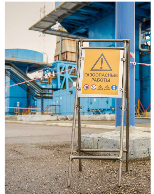
Безопасность выполнения работ – в приоритете

ООО «ГАЗПРОМ ТРАНСГАЗ САРАТОВ» В СОЦИАЛЬНЫХ СЕТЯХ