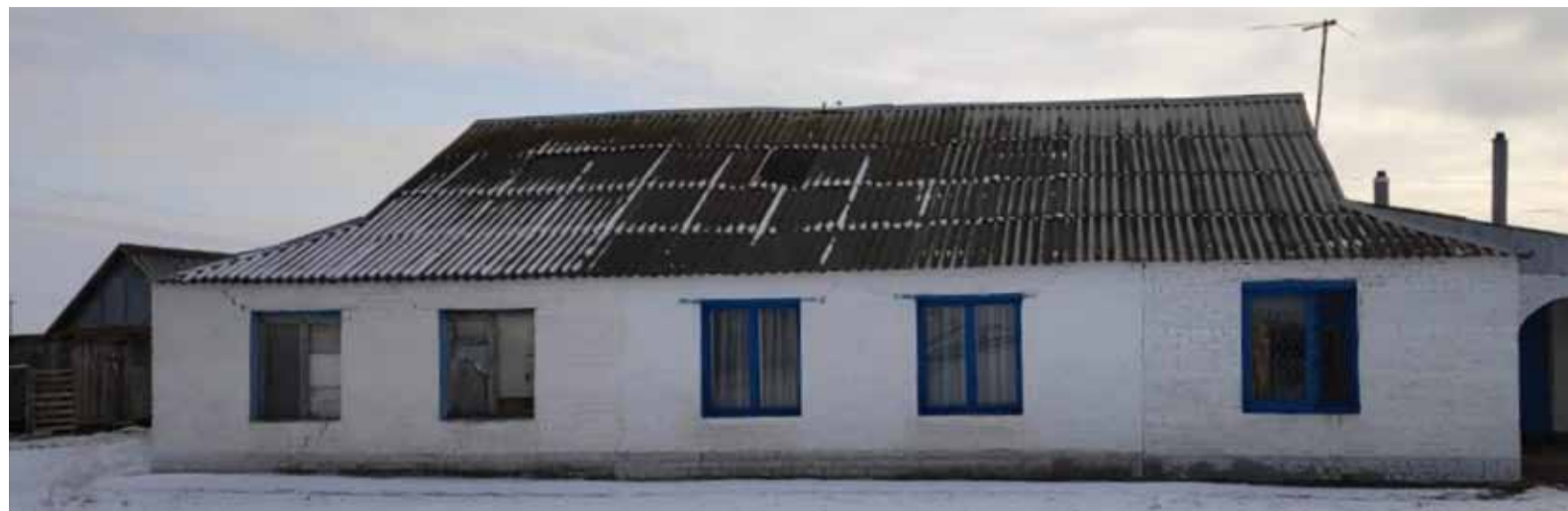
Дом оператора газораспределительной станции «Новостепное» – один из 46 домов, которые проверяются комиссией на необходимость и объемы ремонта

В Обществе продолжается работа по выполнению Плана мероприятий по результатам встреч руководства предприятия с трудовыми коллективами филиалов.