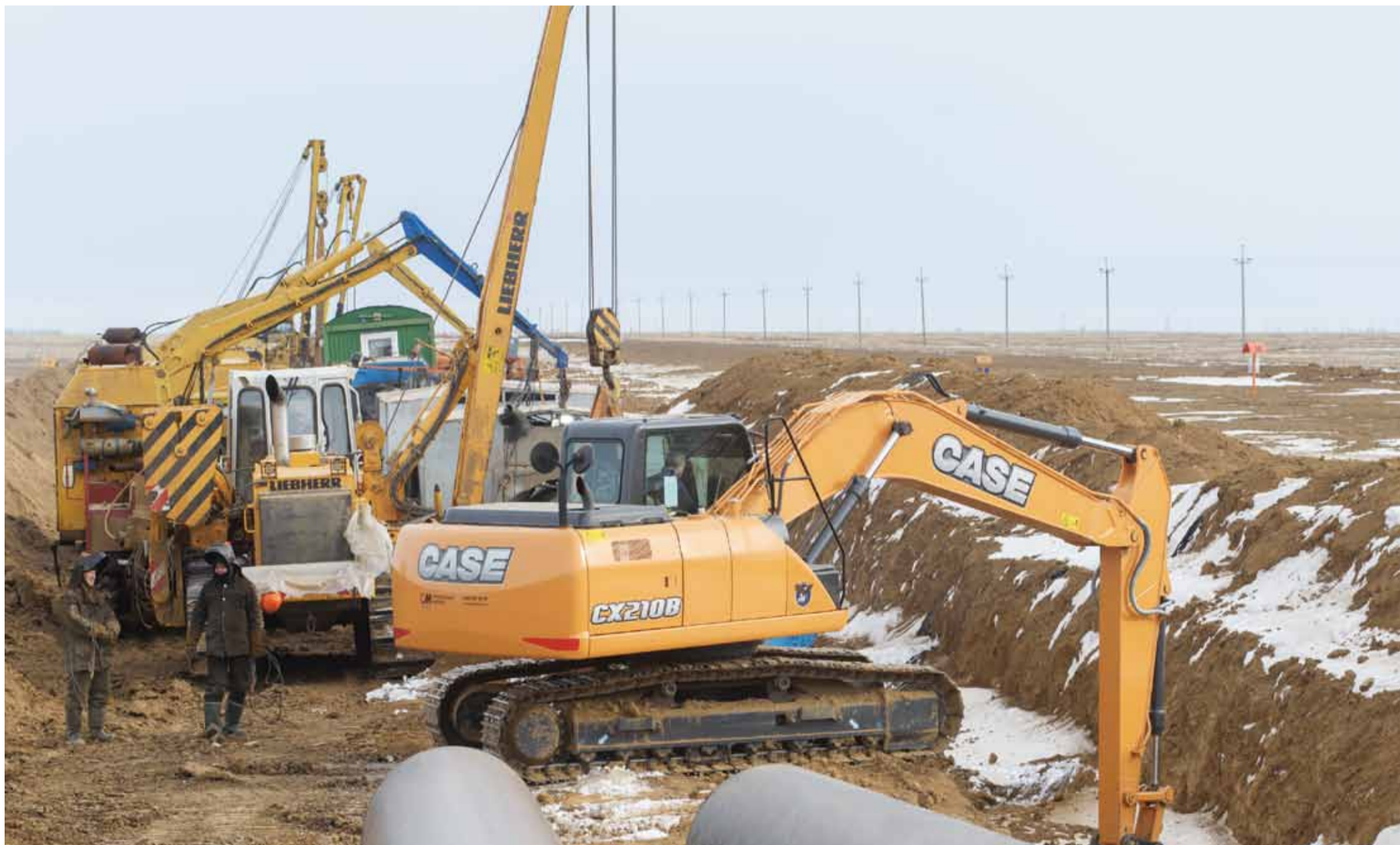
Всего в рамках работ прошлого и текущего годов на магистральном газопроводе «Оренбург – Новопсков» будет капитально отремонтировано около 40 км трубы

В Александровогайском линейном производственном управлении магистральных газопроводов проводятся одни из самых значимых ремонтных работ текущего времени в Обществе.