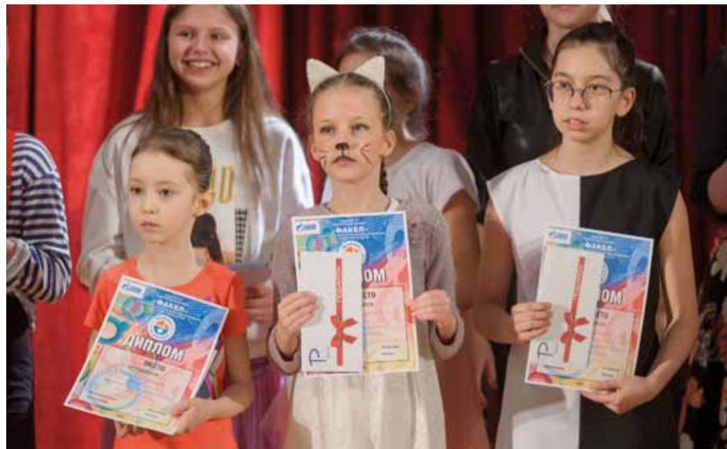
Время подготовки ко второму этапу ограничено: всего месяц!

Что ж, победители и призеры определены и уже вовсю начинают готовиться ко 2-му этапу отборочного тура фестиваля, который пройдет с 29 февраля по 1 марта. Это значит, что у конкурсантов есть всего лишь месяц, чтобы дополнить или усовершенствовать свой номер и покориť жюри.