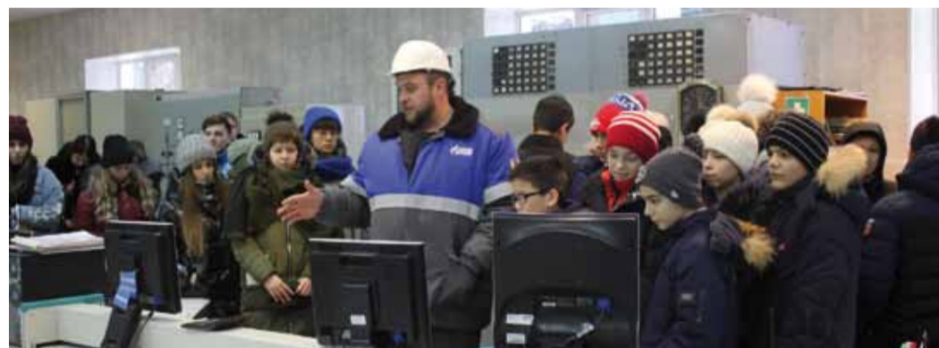
Школьникам рассказали об основах процесса транспортировки газа