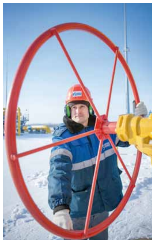
Соблюдение норм охраны труда – в приоритете

Основную идею Программы сформулировал Председатель Правления ПАО «Газпром» Алексей Миллер в обращении, направленном руководителям дочерних предприятий. «В сегодняшней быстро меняющейся среде руководство должно быть более ориентировано на внедрение новых подходов, а не на использование стандартных практик управления. Это особенно актуально, когда речь идет о вопросах производственной безопасности. Наша об-