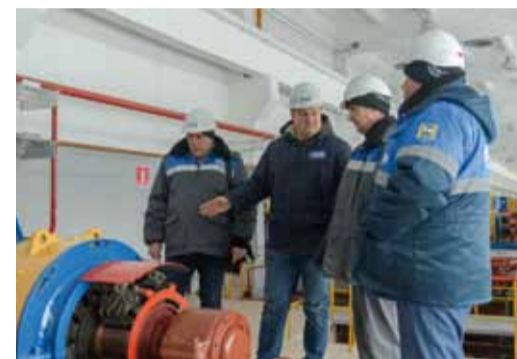
Особое внимание – оборудованию компрессорных цехов