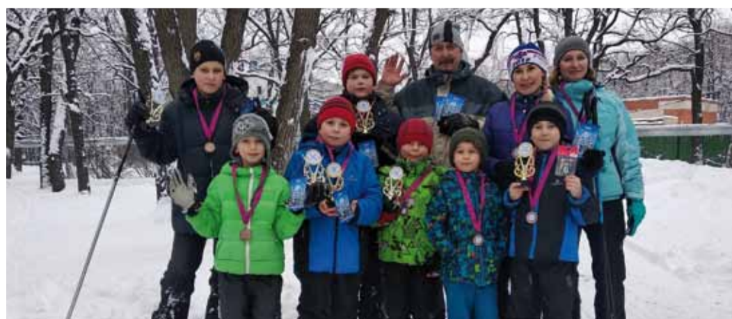
Детям тоже скучать не пришлось