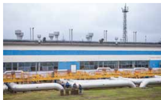
Две гитары – обвязка ЦБН и музыкальный инструмент