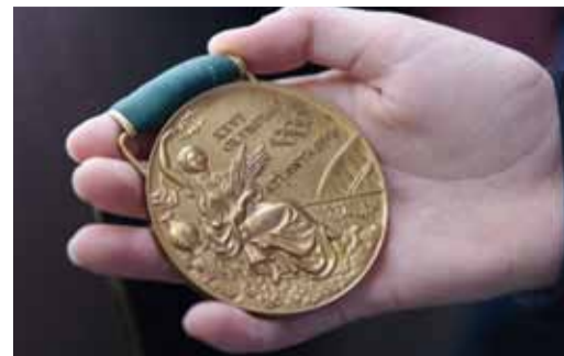
Бронзовая медаль Олимпиады-1996 в Атланте