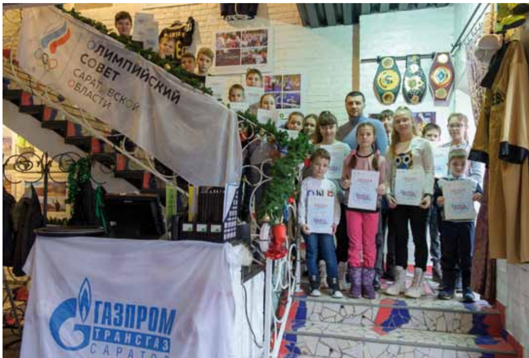
Участие в мероприятии – одна из форм мотивации к занятию спортом для детей разных возрастов

«А сфотографироваться с настоящей медалью Олимпийских игр можно?» – спрашивали мальчишки и девчонки. «Конечно», – отвеча-