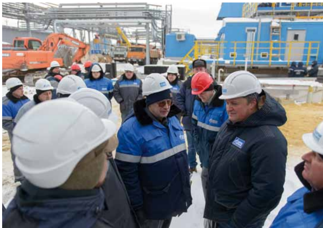
На площадке реконструкции компрессорного цеха №4