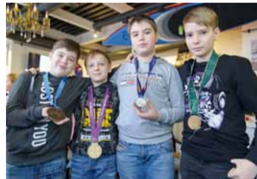
Теперь ребята знают, сколько труда в этих медалях!