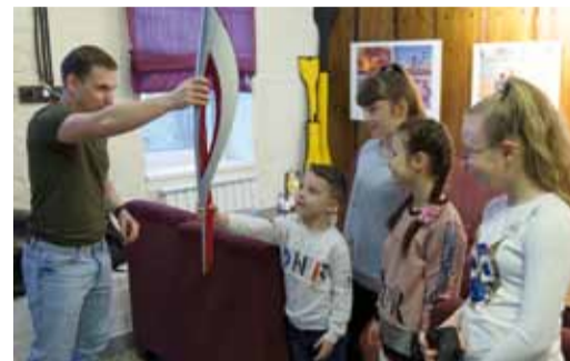
Факел Олимпиады-2014 в Сочи