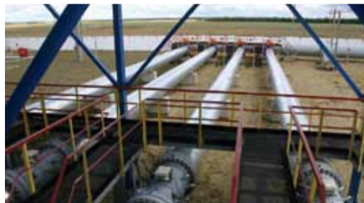
«Струны» ГИС и струны гитары. Похожи?

По «гитаре» газ поступает к ЦБН. Нагнетатели, в свою очередь, являются одними из основных элементов ГПА, так как именно они сжимают газ. К слову, ЦБН бывают полнонапорными и неполнонапорными, что очень важно, ведь это влияет на схему КС и обвязку, которая тоже бывает двух видов – последовательная и параллельная.