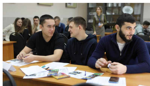
Есть что обсудить