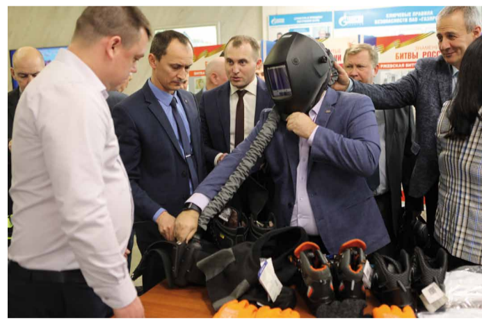
Важно проверить СИЗ на себе