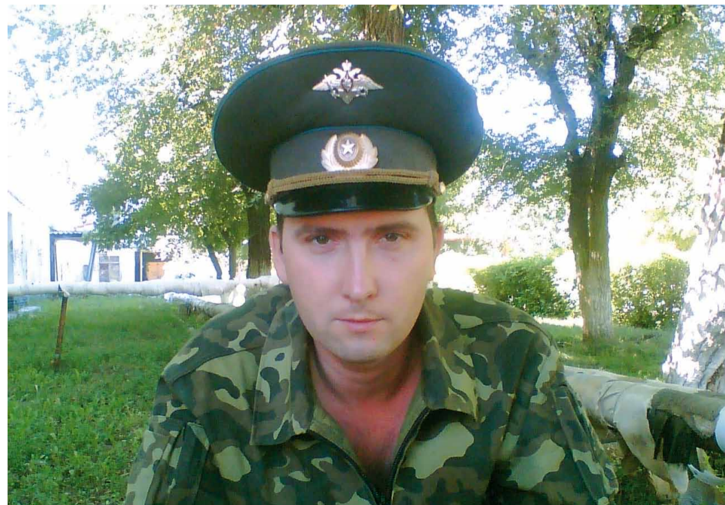
На боевом дежурстве