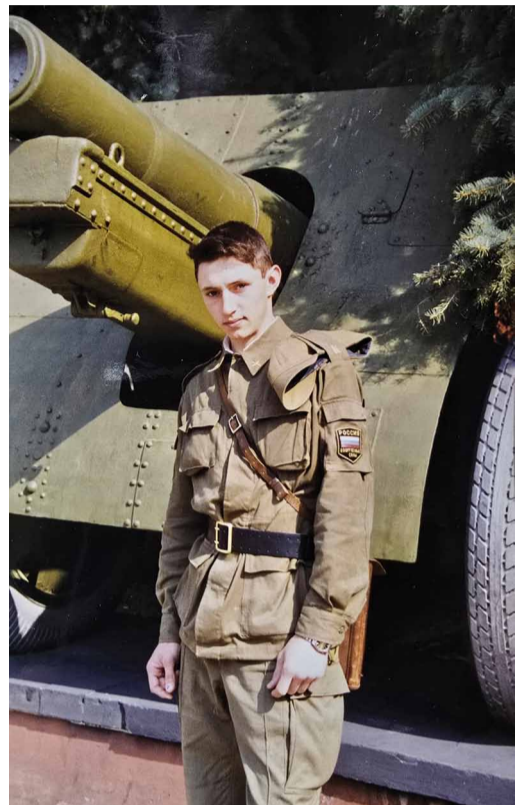
В годы учебы