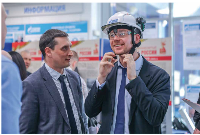
Новое – качественное и удобное