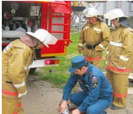
Представитель Госпожнадзора проводит инструктаж перед соревнованиями