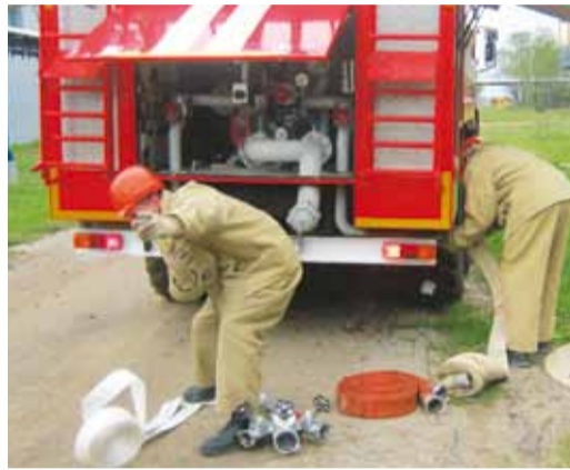
Пожарная дружина КС-1,2 производит боевое развертывание и подключение к пожарному гидранту

Ежегодно в Александровогайском ЛПУМГ проводятся соревнования между добровольными пожарными дружинами цехов и служб. Соревнования, прошедшие осенью прошлого года, показали, что пожарные добровольцы находятся в хорошей боевой готовности.