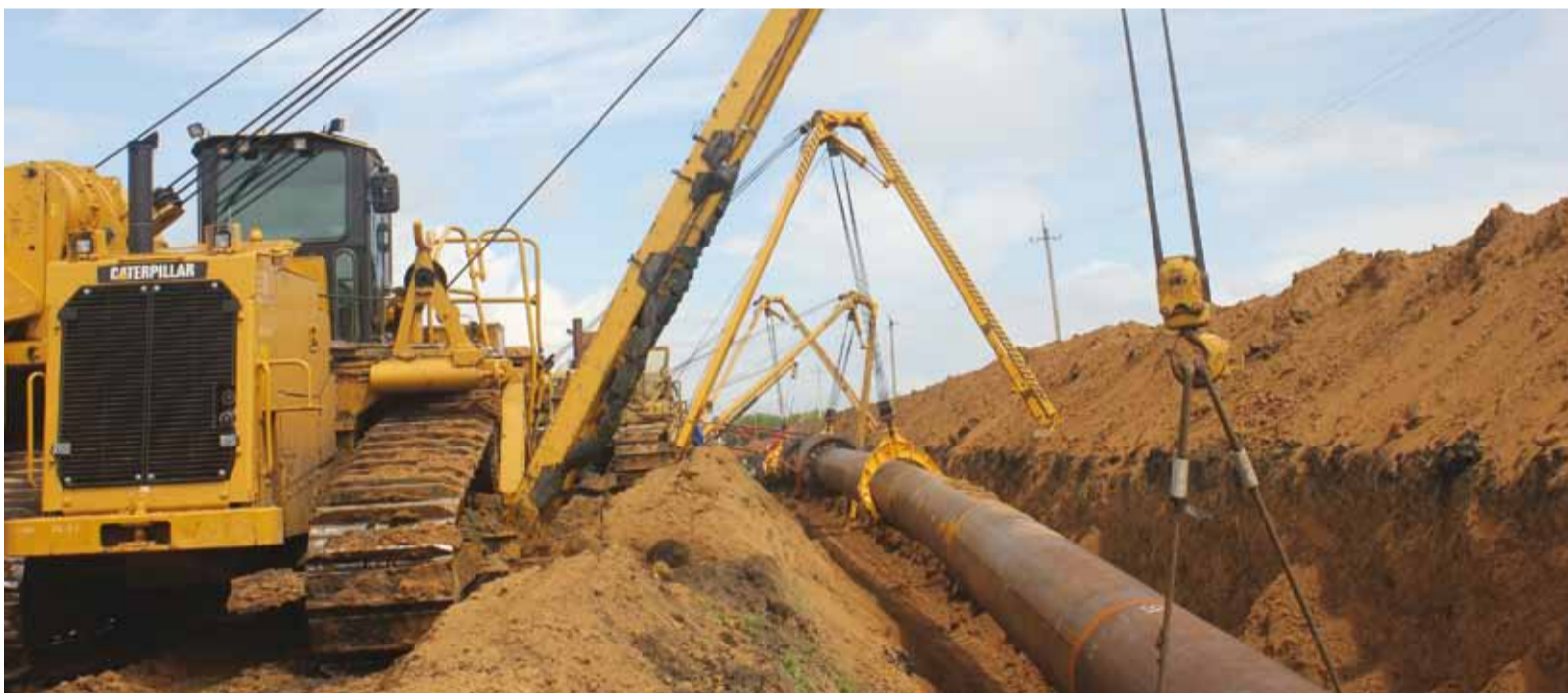
Лето 2013 года. Ремонт газопровода «Уренгой - Новопсков» на участке зоны ответственности Екатериновского ЛПУМГ