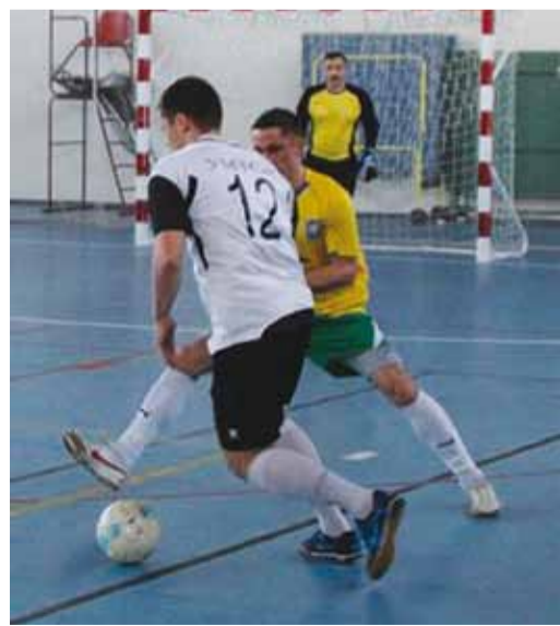
Футболисты УМТСиК атакуют

Ведется активная работа по привлечению к спорту и активному образу жизни сотрудников филиала вместе с членами семей. Хочется отметить инициативность наших мо-