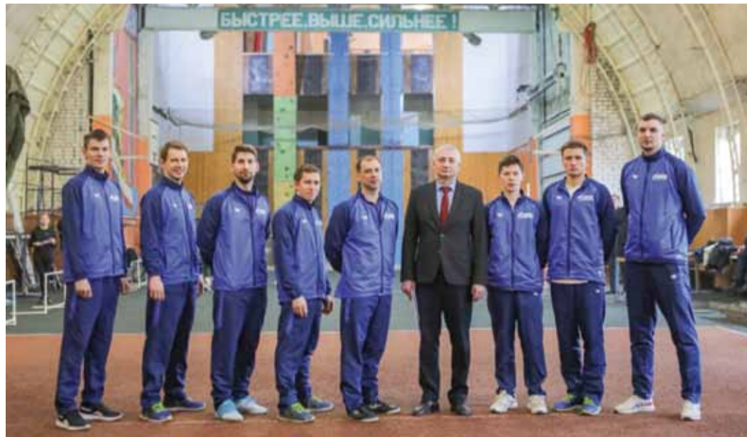
Команда Общества по пожарно-спасательному спорту