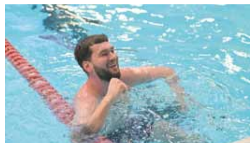
Когда увидел быстрые секунды