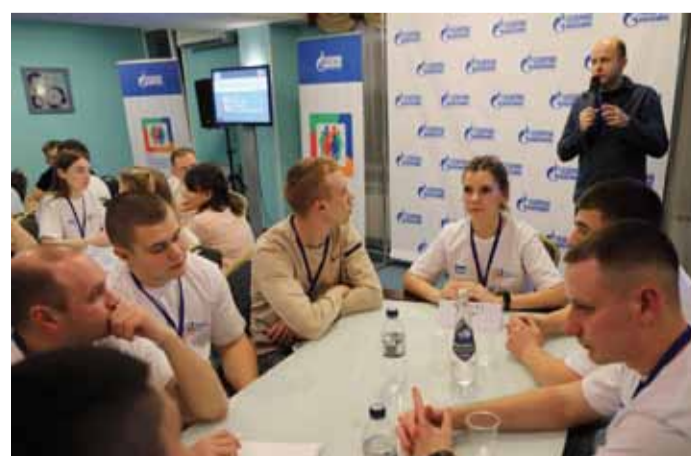
Интеллектуальная игра – познавательно и интересно