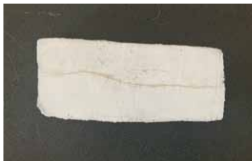
Рационализаторство как искусство

На сегодняшний день в лаборатории неразрушающего контроля Общества по-