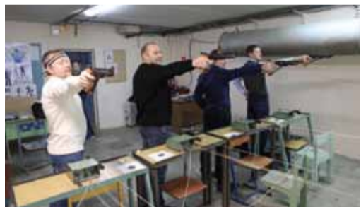
На изготовке – стрелки ИТЦ