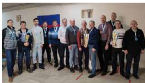
Призеры соревнований по пулевой стрельбе

В четверг, 30 января, Спартакиаду открыли несколько десятков газовиков, увлеченных пулевой стрельбой. Соревнования прошли в тире саратовского лицея № 36. Наши коллеги поразили мишени из профессиональных пневматических пистолетов.