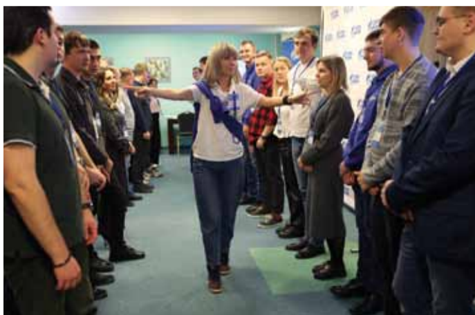
Рождение новой команды