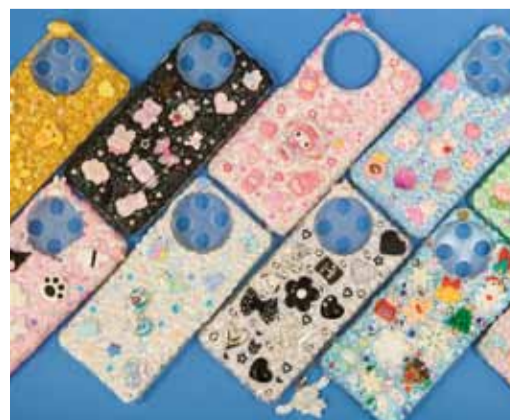
Чехол для телефона может быть и таким