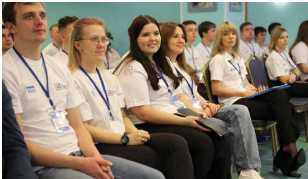
Не каждый день выпадает возможность прямого общения с генеральным директором

В Обществе состоялся Слет молодых работников, приуроченный к 80-летию Победы в Великой Отечественной войне.