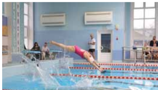
Хороший старт – половина дела