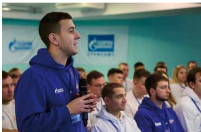
В чем секрет успеха на трудовом пути?