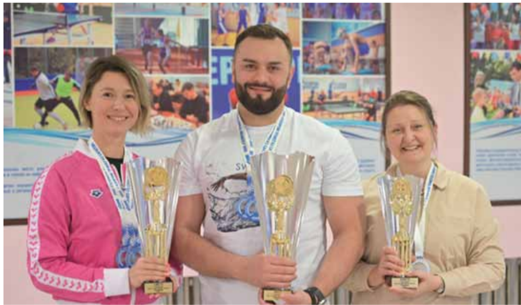
Капитаны команд-призеров в соревнованиях по плаванию

Стартовала ежегодная Спартакиада ООО «Газпром трансгаз Саратов». Работники Общества проявили мастерство в соревнованиях по двум видам спорта.