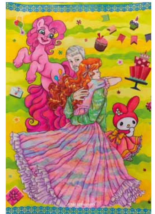
Что-то на эльфийском