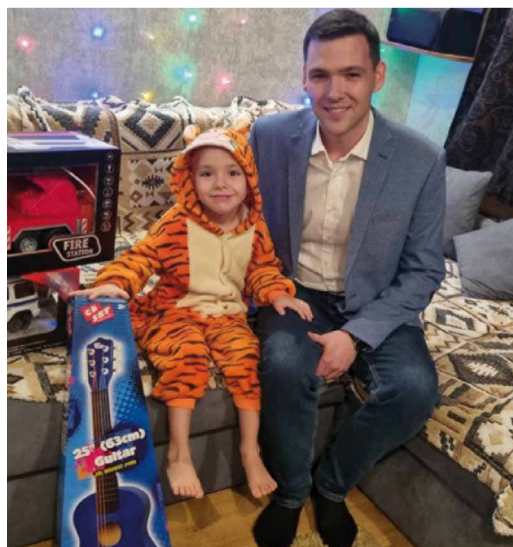
... и тиграм

Производственный отдел по эксплуатации компрессорных станций вручил шести-