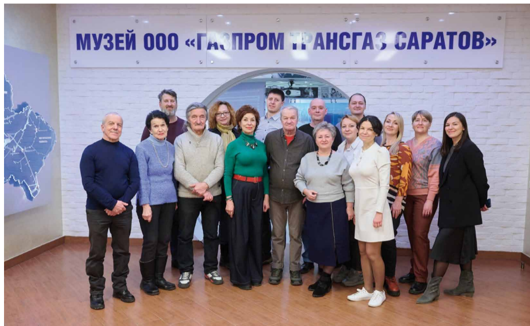
Работники редакции разных лет и служба по связям с общественностью и СМИ

В Учебно-производственном центре состоялась встреча работников редакции газеты «Голубая магистраль» разных лет. Мероприятие было посвящено 40-летию корпоративного издания и Дню российской печати.