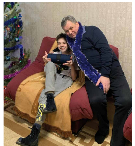
... фанатам и газавикам