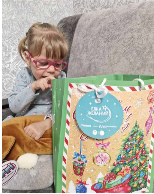
Что год грядущий нам несет...

В конце 2024 года работники Общества во второй раз приняли участие во Всероссийской акции «Елка желаний» в офлайн-формате и подарили радость и ощущение новогоднего волшебства детям с ограниченными возможностями здоровья, а также проживающим в семьях с низким доходом, исполнив более 40 желаний.