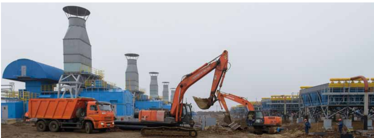
Строительно-монтажные работы должны быть выполнены уже через несколько месяцев