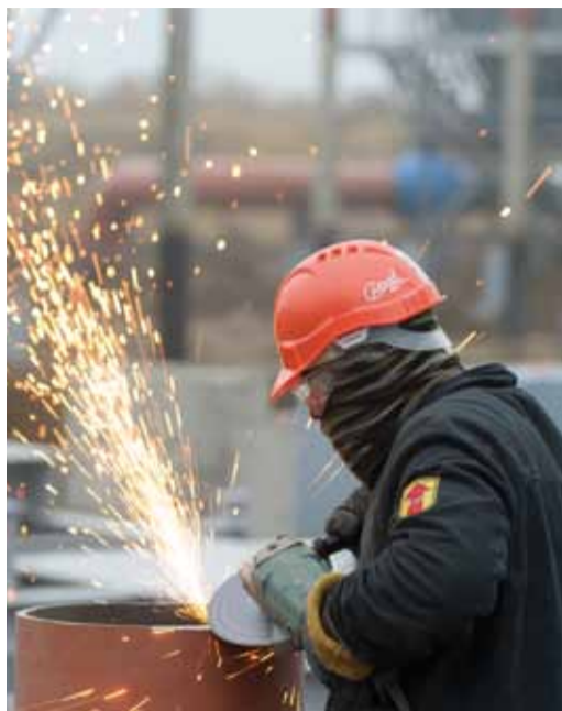
В реконструкции задействовано более 300 рабочих