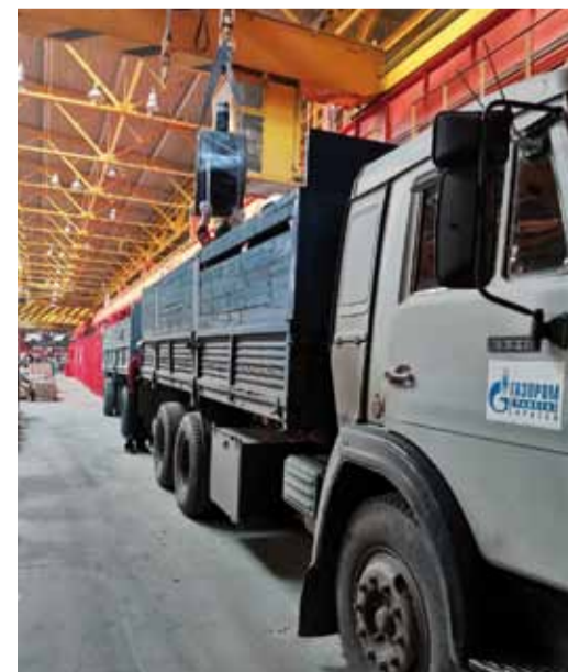
Погрузка на заводе в Челябинске