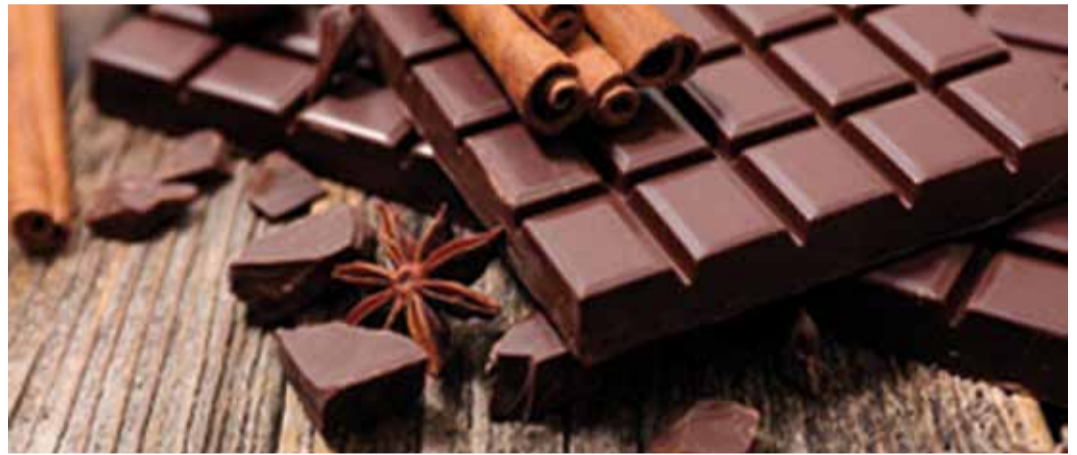
Шоколад, который знаком нам всем