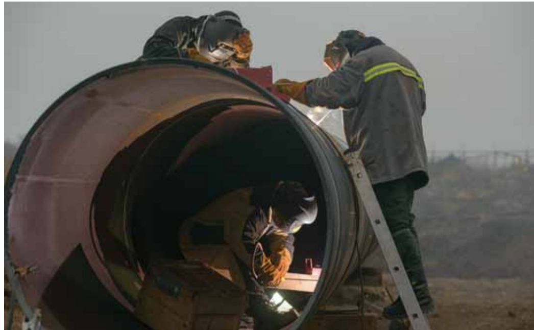
С целью соблюдения установленных сроков работы ведутся параллельно сразу на нескольких объектах цеха