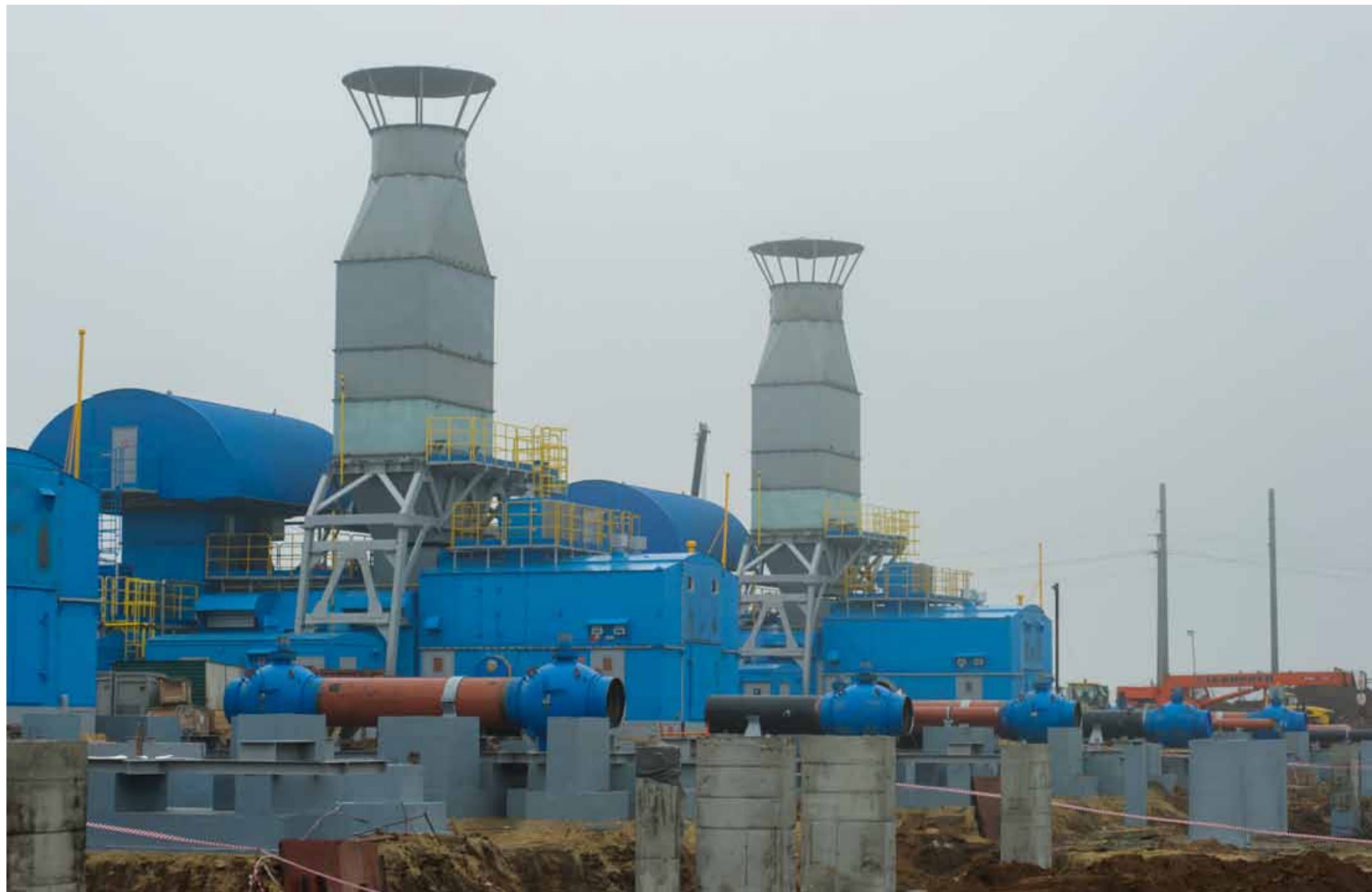
Реконструкция компрессорного цеха №2 Балашовского линейного производственного управления магистральных газопроводов

В Балашовском линейном производственном управлении магистральных газопроводов продолжается реконструкция компрессорного цеха номер 2.