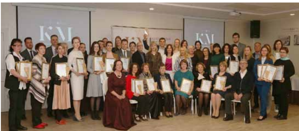
В творческом соревновании были представлены 92 проекта от 44 организаций