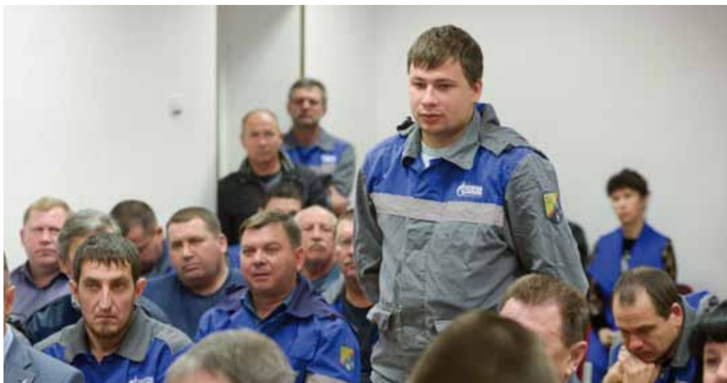
Вопрос жилищного обеспечения интересует, в первую очередь, молодых работников филиалов

«По существующим требованиям Общество может компенсировать затраты на отдых