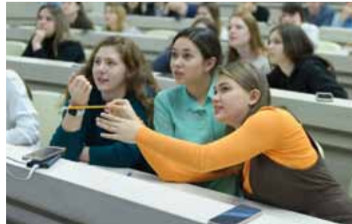
Риск - дело интеллектуальное

К слову сказать, размышлять над ответом приходилось на каждом вопросе. Например,