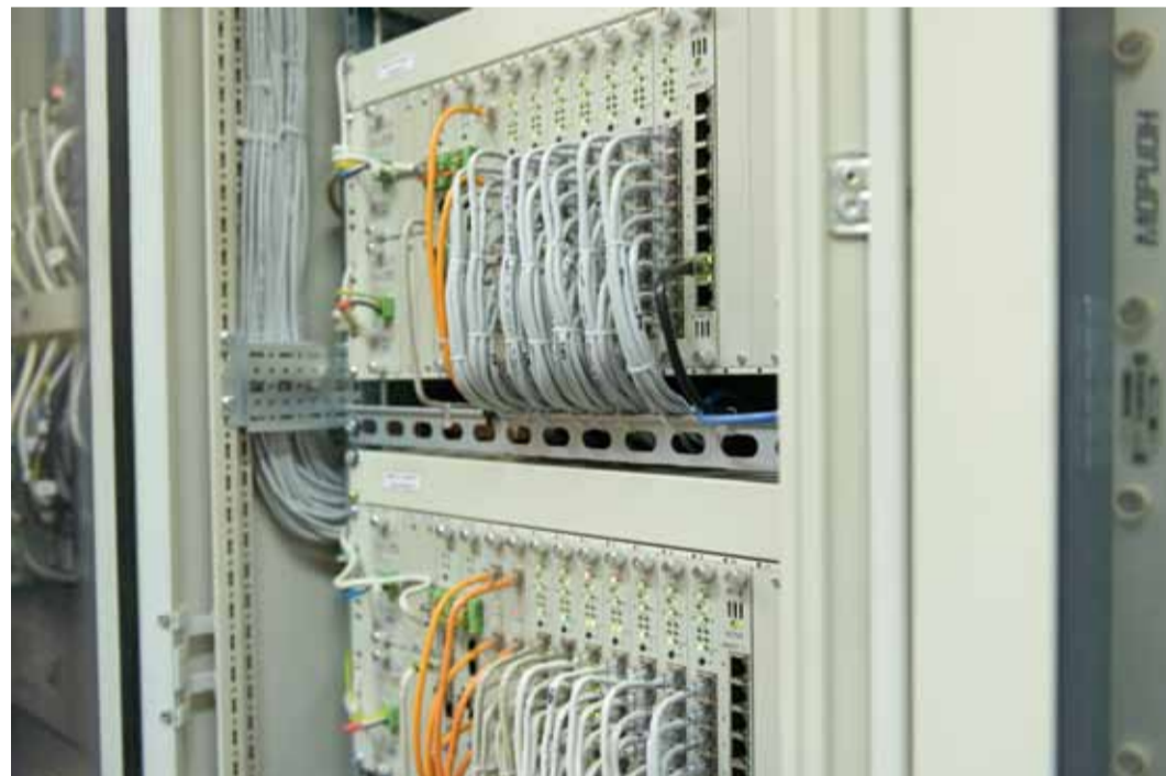
Повышение надежности связи – главная цель капитального ремонта

Роль технологической связи для газотранспортной системы трудно переоценить. Объекты Общества находятся порой на расстоянии нескольких сотен километров друг от друга, но при этом должны быть обеспечены качественной, устойчивой и защищенной связью. Сигнал, проходя свой протяженный путь, должен доходить до абонента нужную информацию независимо от внешних факторов.