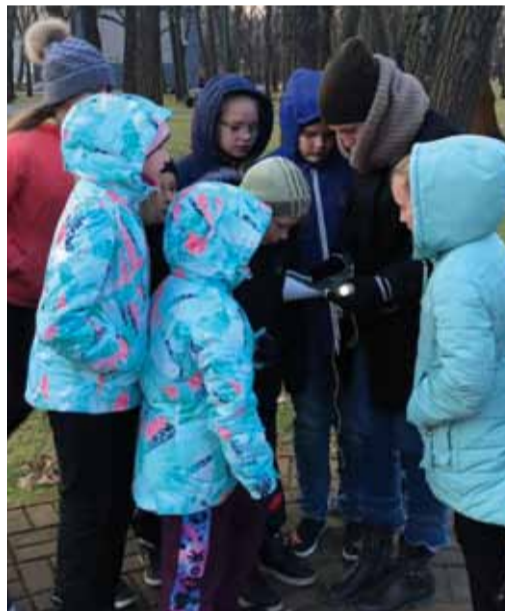
Чтобы найти сокровища нужно работать вместе