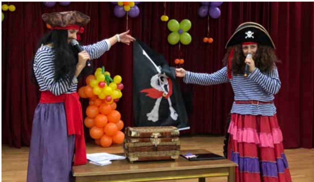
Работники СОК «Родничок» старались максимально разнообразить досуг ребятшек и это им удалось!