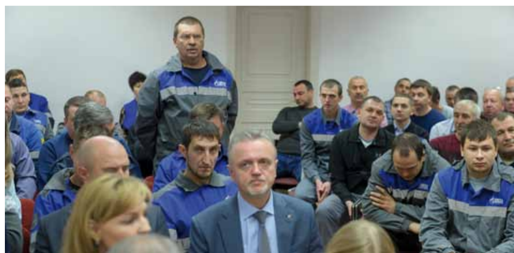
За один час встречи работники УТТиСТ задали руководству около 20 вопросов

Объяснимое волнение работников, ощущавшееся на первых минутах, быстро проходило и начиналась доверительная беседа, плоды которой, и в этом не приходится сомневаться, мы увидим уже совсем скоро. До конца текущего года выездные встречи руководства с трудовыми коллективами охватят все филиалы Общества.