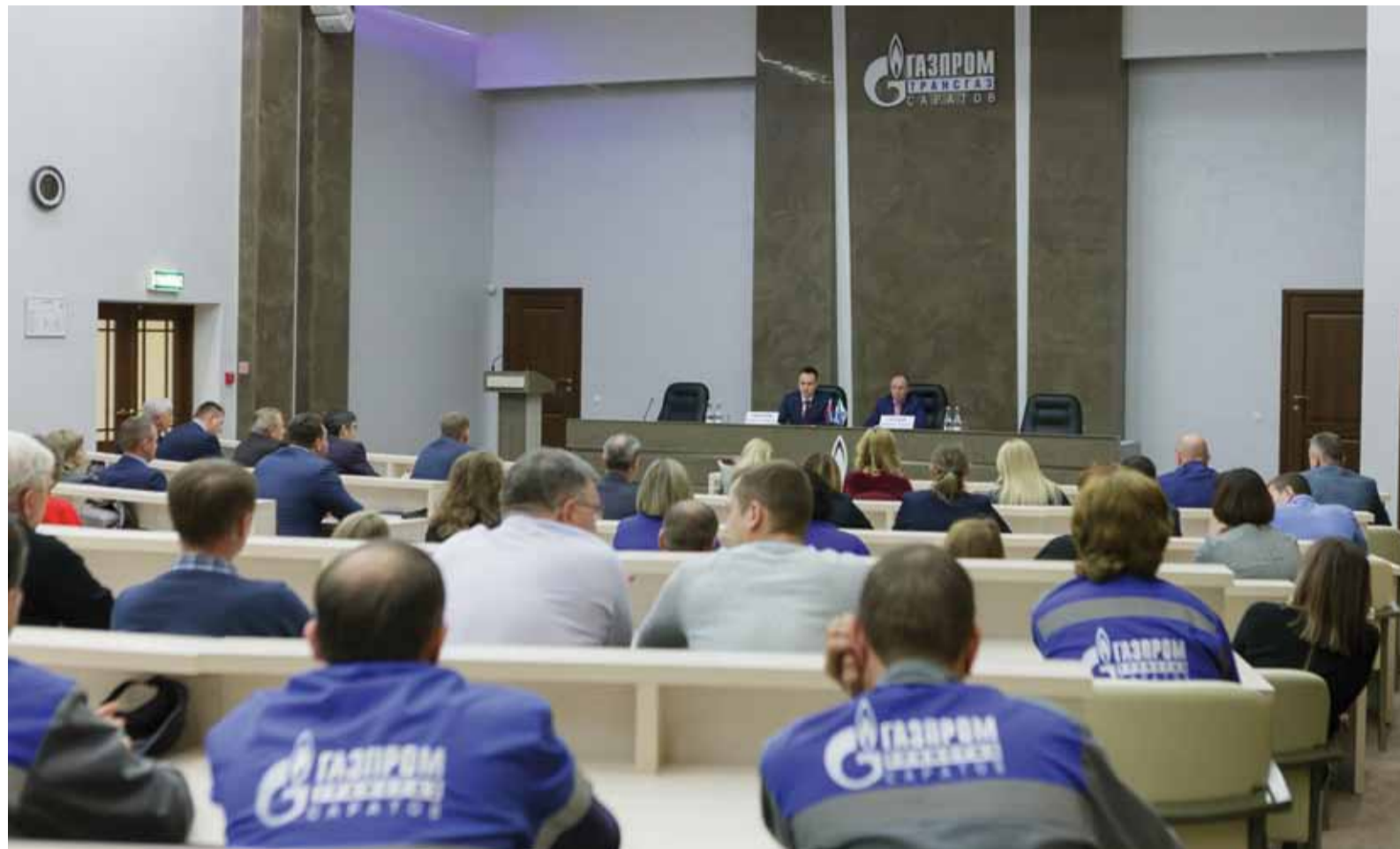
Встреча с коллективами Учебно-производственного центра и Управления организации восстановления основных фондов

Началась серия выездных встреч руководства Общества с трудовыми коллективами филиалов.