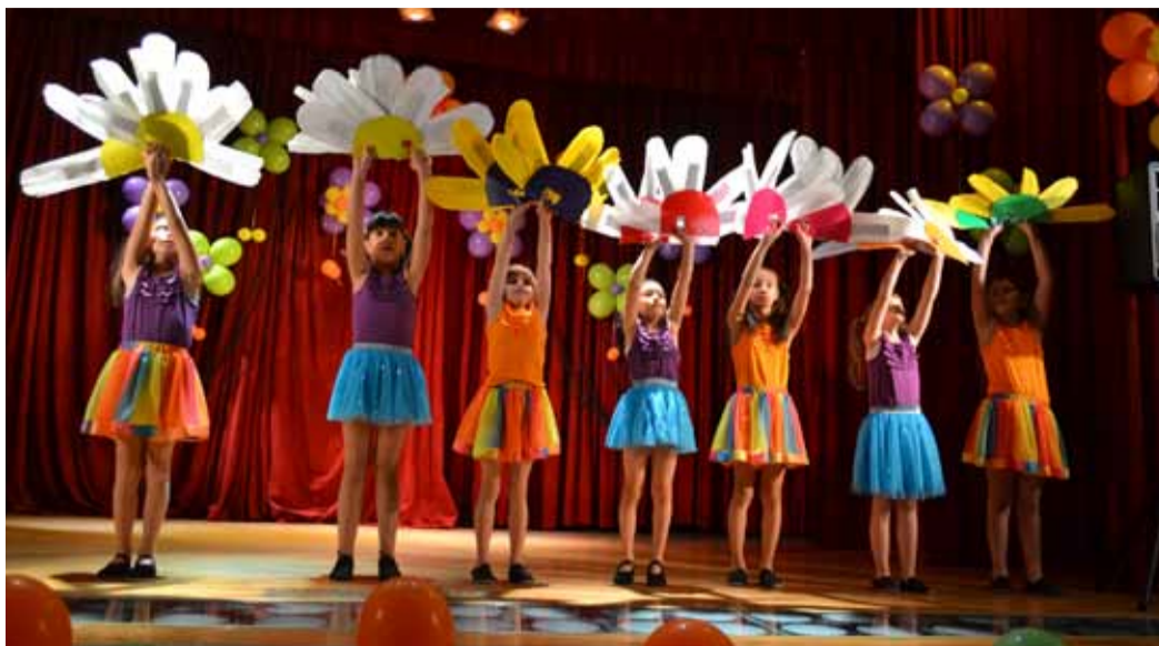
Концерт венчавший осеннюю смену был подготовлен всего за неделю, но был таким же ярким как и летом

Короткая недельная смена завершилась ярким концертом. Причем готовили его сами