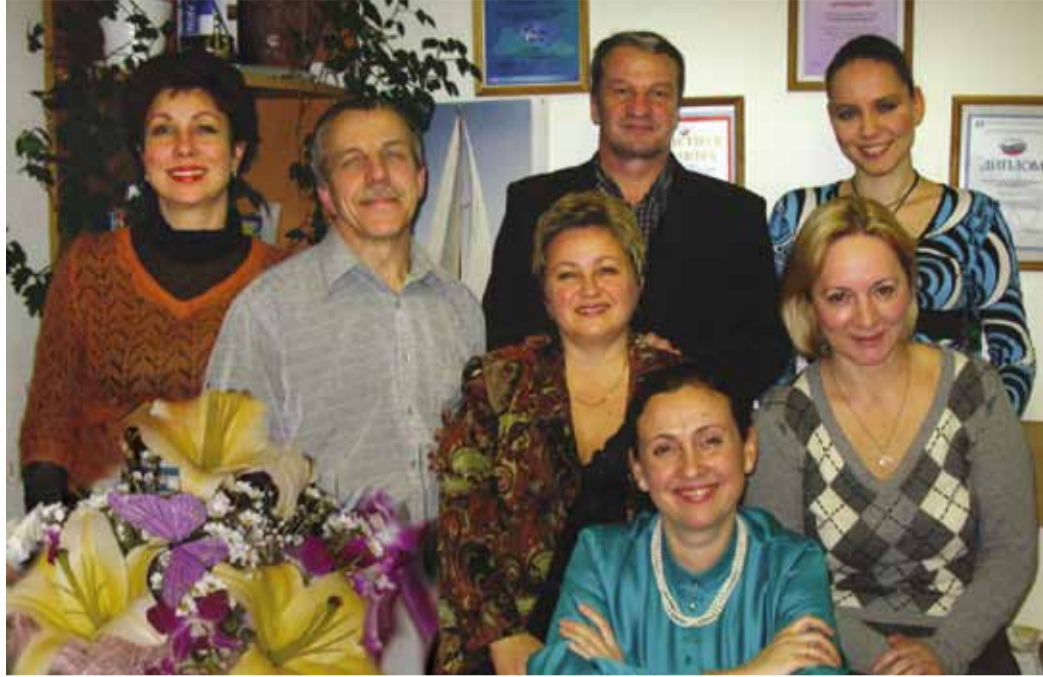
Коллектив редакции и ССОуСМИ в первой половине 2010-х

«А мы – обычные люди с улицы – в ней ничего не понимали. Но как-то же надо было выходить из положения! Значительная часть материалов посвящалась в те времена общечеловеческим темам – писали поздравления с днями рождения, описывали происшествия просто по факту. У нас в каждом ЛПУМГ был свой человек – как правило,