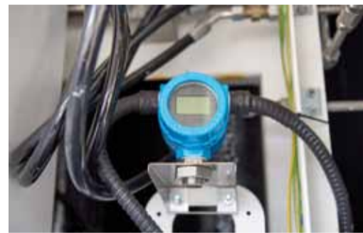
ПАГЗ оснащен современными средствами измерений

ляется ООО «Газпром газомоторные системы». На данный момент Общество располагает шестью ПАГЗами: о двух из них мы написали выше, четыре единицы объемом 5000 м 3 работают в Башмаковском, Пугачевском, Мещерском и Приволжском ЛПУМГ.