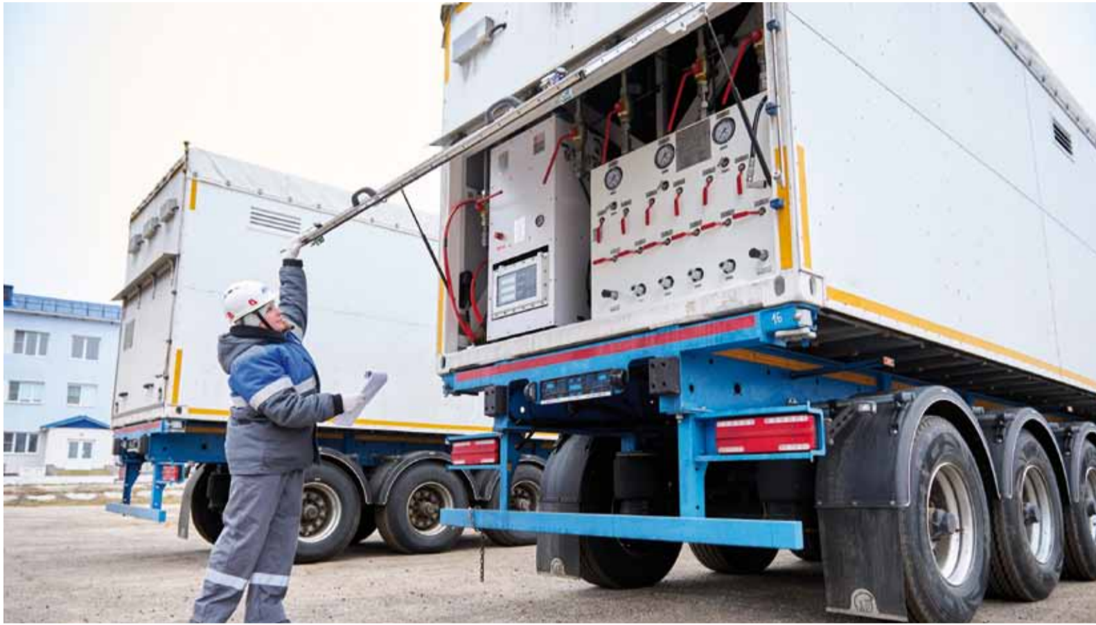
Входной контроль прибывшей техники на базе УМТСиК

В УМТСиК поступили две единицы передвижного автомобильного газового заправщика (ПАГЗ). До конца текущего года Общество ожидает еще пять их «собратьев».