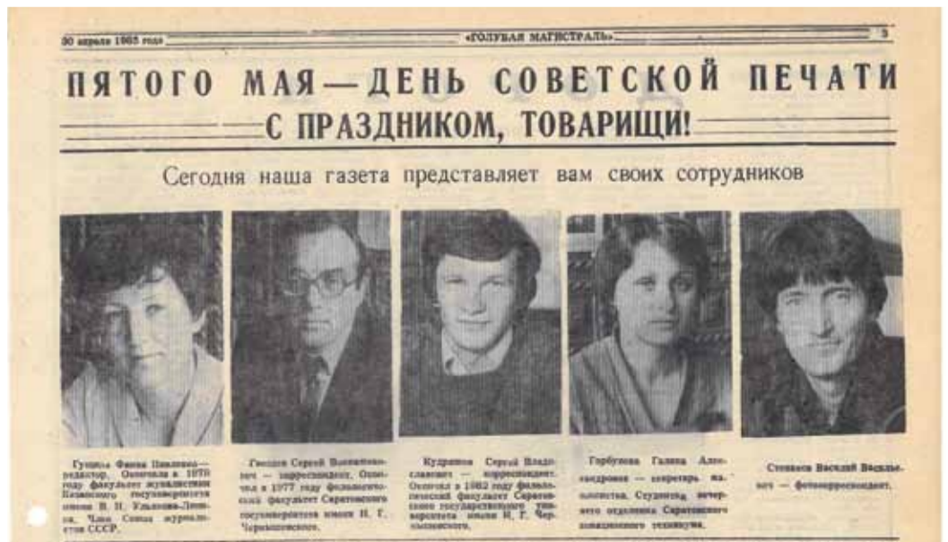
Публикация в «Голубой магистралей» о составе редакции образца 1985 года

В первое время редакция газеты размещалась в небольшом кабинете на девятом этаже административного здания ПО «Саратовтрансгаз», по соседству с техническим отделом, где в свое время и появилась идея о вы-