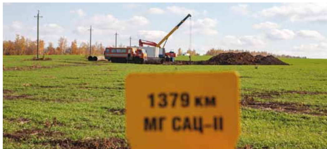
На данный момент выполнена замена около половины всех выявленных дефектных участков МГ САЦ-2