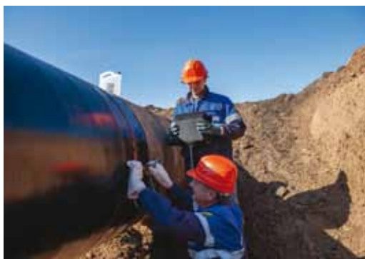
Ультразвуковое обследование сварного шва