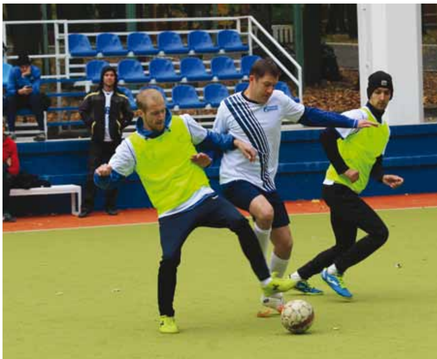
Борьба на каждом участке поля. Никто не хотел уступить.