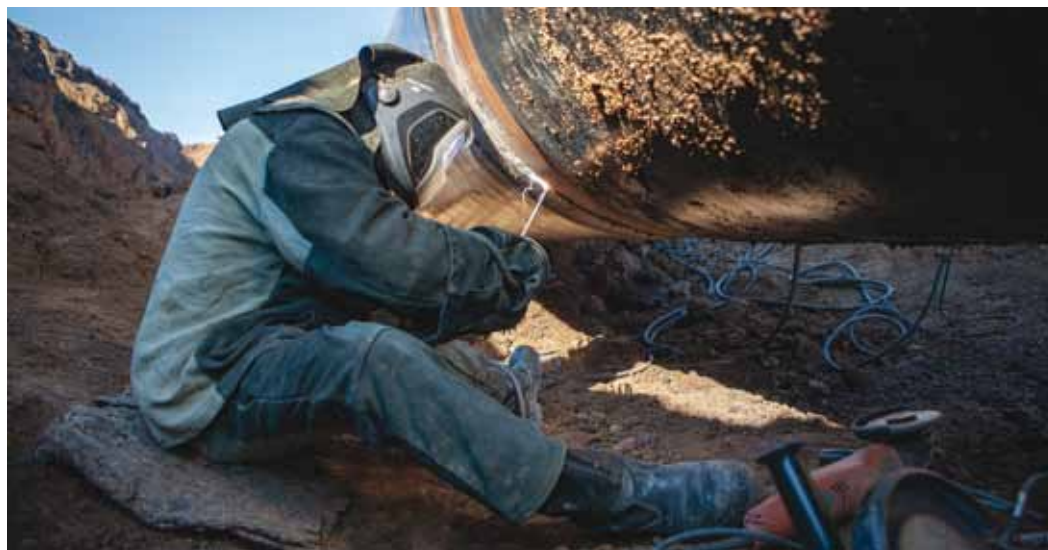
На объекте работают две сварочно-монтажные бригады УАВР