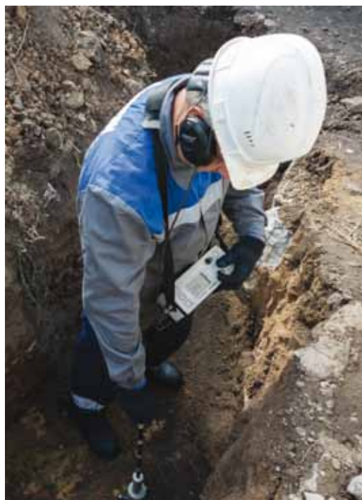
Процесс поиска места повреждения кабеля

Специалисты лаборатории по диагностике электротехнического оборудования Инженерно-технического центра продолжают нести свою непростую службу на производственных объектах Общества.