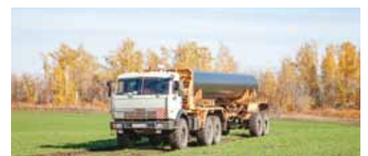
Очередная труба для ремонта прибыла на объект