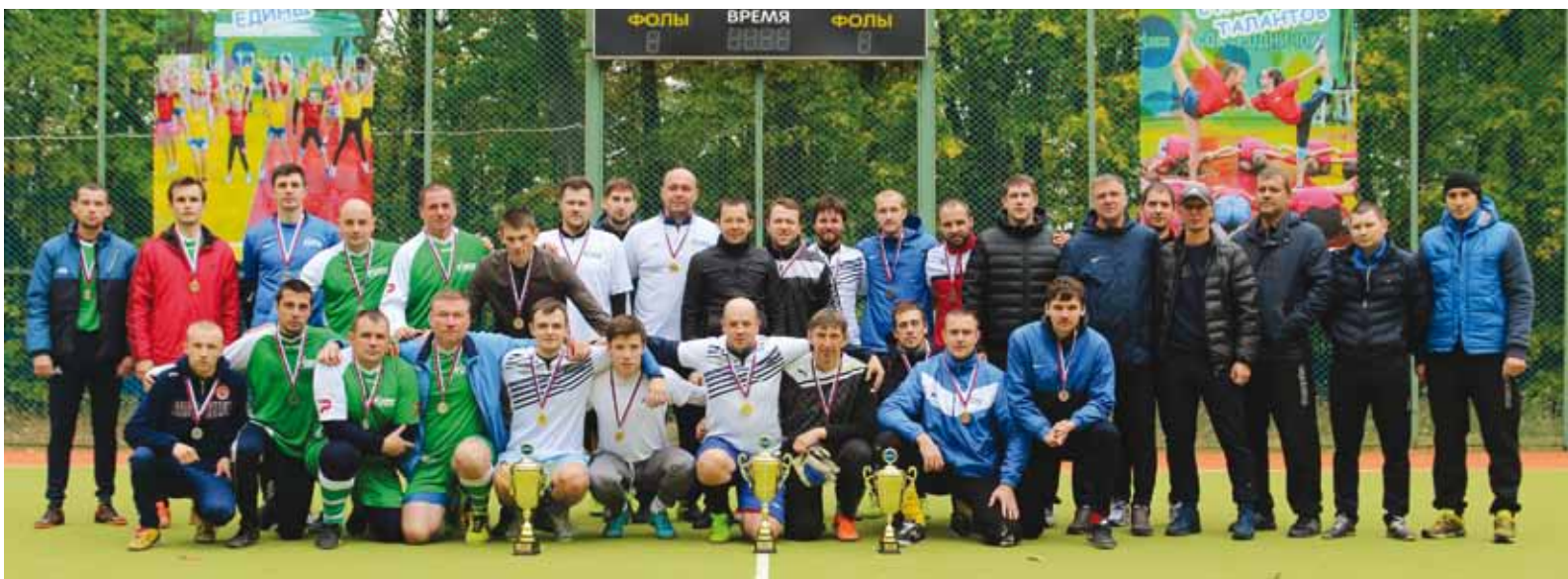
Торжество спорта и корпоративного единства. Мини-футбольные турниры в рамках Спартакиады всегда проходят в прекрасной дружеской атмосфере