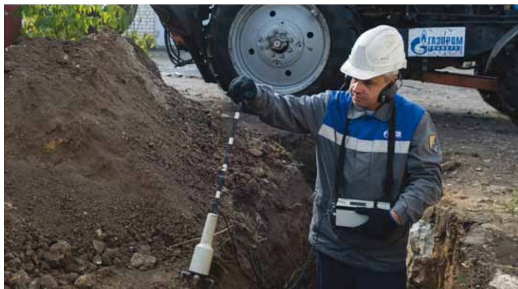
Обрыв кабельной линии подтвержден, пора приступать к устранению неполадки

Порядок работы сотрудников лаборатории при авариях неизменен: определение места повреждения, ремонт кабельных муфт и испытание повышенным напряжением