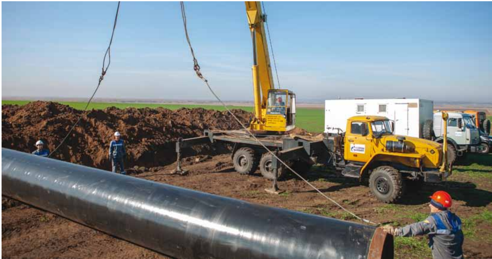
Ремонт МГ САЦ-2 проводится по результатам внутритрубной дефектоскопии

В Приволжском линейном производственном управлении магистральных газопроводов проводится капитальный ремонт участка магистрального газопровода САЦ-2.