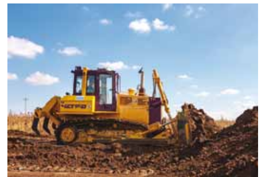
В деле - бульдозер ЧЕТРА