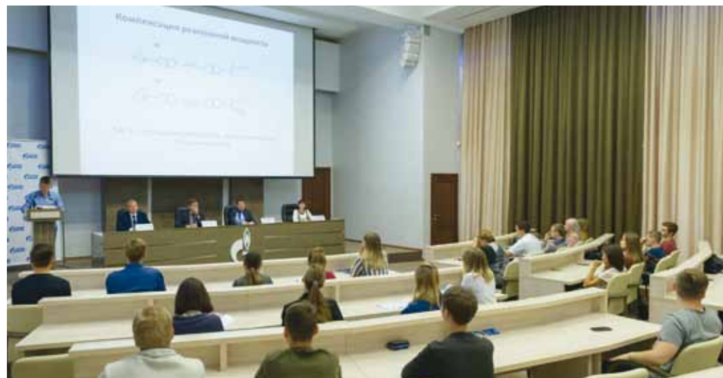
Рассматриваемые темы были самыми разнообразными: от производства до воспитания молодого поколения

Он также обратил внимание, что Общество занимается экологическим просвещением населения и регулярно принимает участие в природоохранных акциях, часть которых организуется именно нашим предприятием. Напомнил он и про фитомелиорацию. Данный процесс позволяет восполнить плодородность почв, которая могла быть наруше-