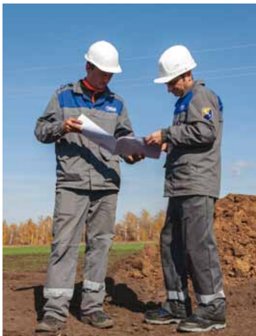
Обсуждение технологии производства работ