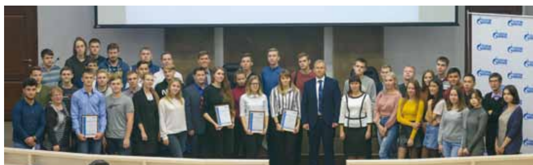
Участникам мероприятия были вручены сертификаты и подарки от нашего предприятия

на в результате производственной деятельности.