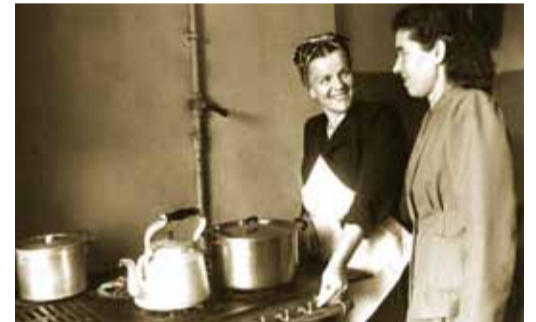
Саратовский газ пришел в квартиры москвичей