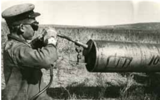
Подготовка труб к сварочным работам