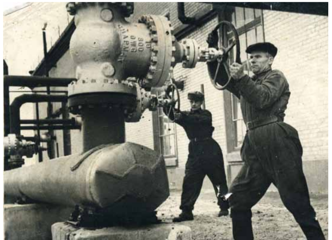
Кологривовская компрессорная станция №1. 1946 г.

введен ряд компрессорных станций – Кологривовская, Кирсановская, Ртищевская. В 1942 году в Саратове уже было изобретено газобаллонное оборудование для работы автотранспорта на природном газе. Газовая отрасль благодаря самоотверженному труду специалистов динамично развивалась: с момента пуска первого магистрального газопровода «Саратов-Москва» буквально за несколько лет с нуля была создана гигантская система обеспечения страны «голубым топливом» и немалый вклад в это внесли именно саратовские специалисты.