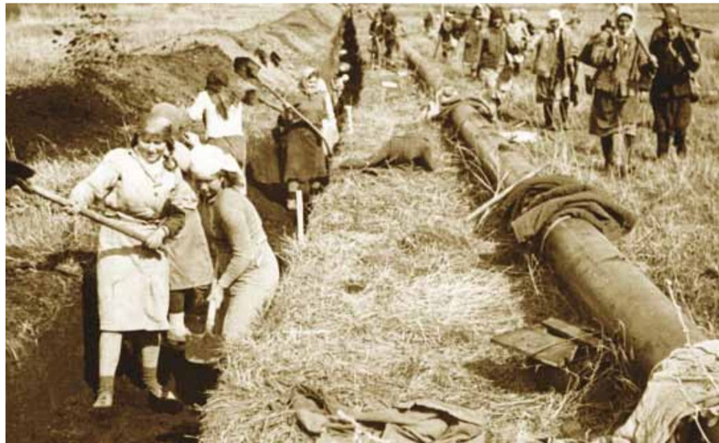
Комсомольская бригада из колхоза им. И.В. Сталина. Саратовская область. 1945 г.