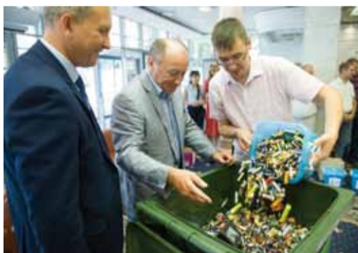
Подведение итогов конкурса «Сдай батарейку»