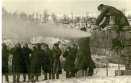
Продувка скважины в селе Елшанка. 1944 г.