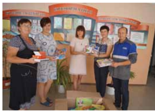
Александровогайские газовики - школьникам!