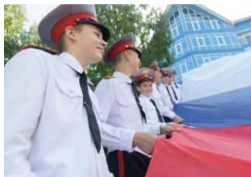
Акция, посвященная Дню государственного флага РФ