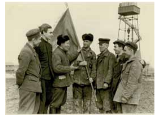
Передовики строительства газопровода. 1945 г.