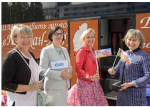
В донорской акции приняли участие более 100 работников