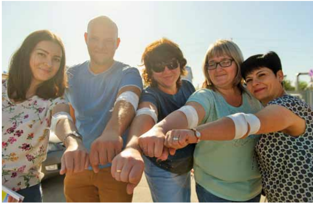
Участники акции «От сердца к сердцу», проведенной совместно с Саратовским областным «Центром крови»

ведены итоги корпоративного конкурса «Сдай батарейку». За два месяца работниками предприятия было собрано более 20 тысяч отработанных батареек, общий вес которых превысил 400 кг. Лидерами «улова» старых элементов питания стали коллективы Екатериновского, Пугачевского и Мещерского ЛПУМГ.