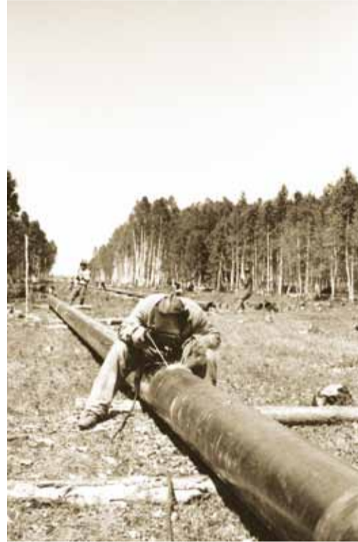
Сварка труб газопровода «Саратов – Москва». 1945 г.