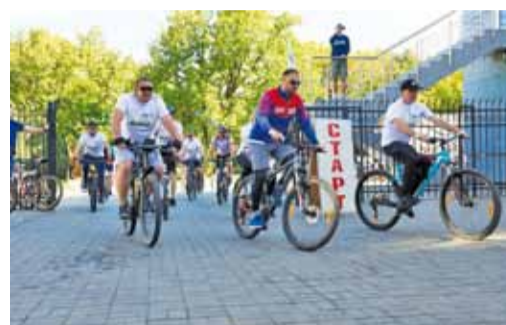
На старт! Внимание! Марш!