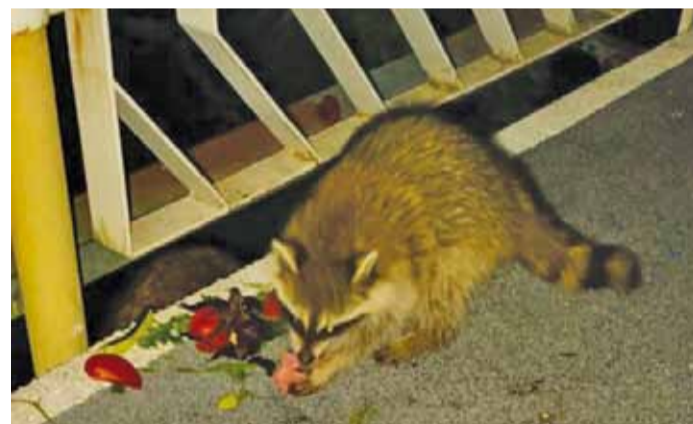
Еноты были в гости к нам

«В Небуге мы не в первый раз – любим это тихое, спокойное место для семейного отдыха. Моего десятилетнего сына особенно восхитил тот самый лифт, в котором нужно ехать, чтобы попасть на пляж. Он находится на скале и проделывает путь к земле, окруженный кроной деревьев. При этом выполнен из прозрачного материала, что позволяет наслаждаться видами. У санатория своя прибрежная территория, доступные шезлонги и зонтики. Приятно, что пляж находится на открытом побережье, то есть не в бухте и не в заливе – море всегда чистое, даже если накануне был шторм».