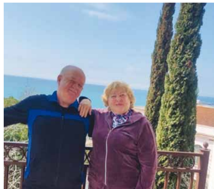
Если пенсия, то такая