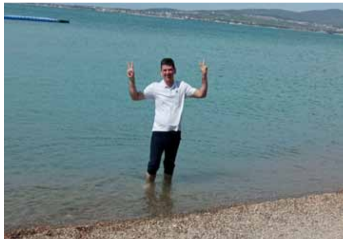
В апреле на пляже немногочисленно

«Мы с женой отдыхали в санатории им. М.В. Ломоносова в Геленджике в апреле. В это время город активно готовился к приему туристов, что позволило нам гулять свободно, а не в потоке. Мы побывали на экскурсии по Гуамскому ущелью, отведали форели, выловленной в горной реке Курджипс, которая по случаю весны была полноводна, и адыгейского сыра. Купались в термальных источниках, окунались и в море, хотя температура воды была 17 градусов. Также заглянули в Парк Галицкого в Краснодаре и прогулялись по ночному Волгограду по пути к месту назначения. Парк поразила размерами и строениями из белого камня, а также своей геометрией и интересными ландшафтными решениями».