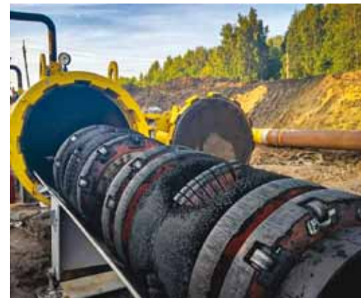
Прием снаряда в Петровском ЛПУМГ