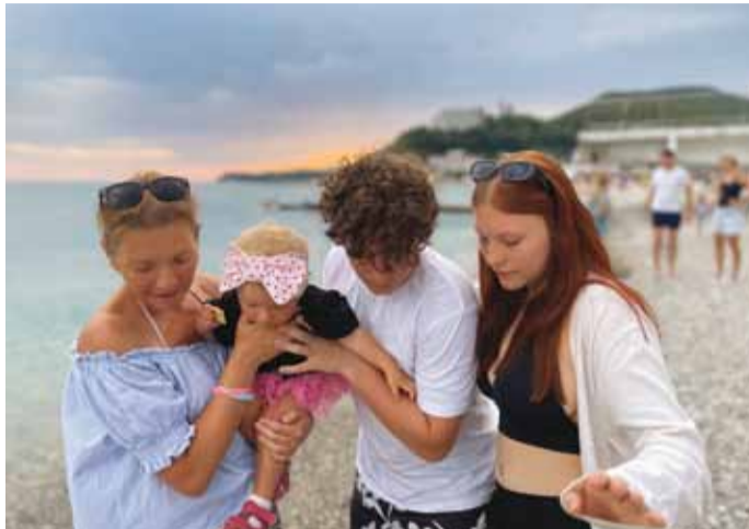
На море много интересного

«Я в первый раз был на море летом. Из-за того, что занимаю руководящую должность, обычно в это время года на работе, так как ведутся ППР и капремонт. А тут удалось вырваться. Поехали с супругой в Евпаторию, разместились в санатории «Орен-Крым». К сожалению, не удалось взять с собой детей – была пора экзаменов. Нас ждали старинный город с богатой историей, а также интересные экскурсии. Например, на Розовое озеро или в Ласточкино гнездо. Санаторий очень понравился – лечение, питание – все на хорошем уровне. Было приятно, когда мы отправились на экскурсию на весь день, а персонал собрал нам с собой в дорогу что-то перекусить. Мы провели в Крыму 12 дней».