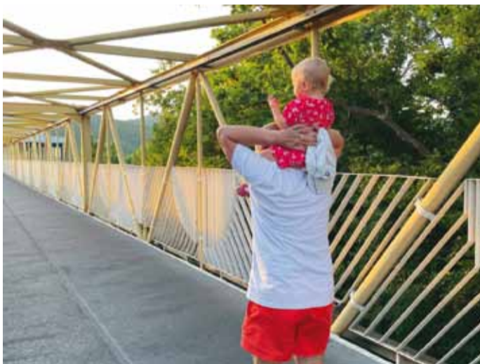
В начале большого пути

Могу посоветовать коллегам, что ехать на машине в это место не стоит – лучше выбрать другие виды транспорта. Так я со старшими детьми добирался на автомобиле, а супруга с малышкой летела на самолете. Когда мы встречали их с самолета, пришлось выстоять изнурительную пробку».