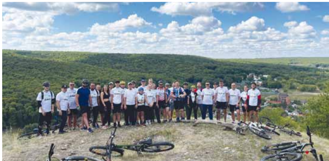
Одна из групп велопробега на Кумысной поляне

С 3 по 17 августа 2024 года состоялся велопробег, посвященный 55-летию ОППО «Газпром трансгаз Саратов профсоюз».