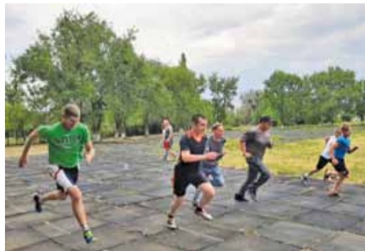
Сдача нормативов в Мокроусском ЛПУМГ

Работники Общества продолжают сдавать нормативы Всероссийского физкультурно-спортивного комплекса «Готов к труду и обороне».