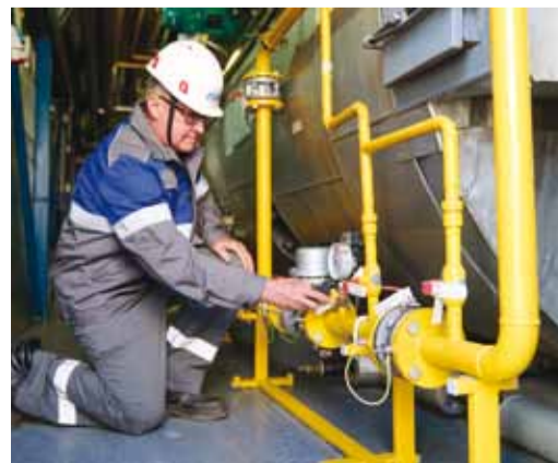
Безопасность – превыше всего