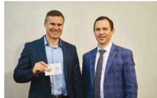
Вручение наград в администрации

В соответствии с Приказом Министерства образования России № 1147, наличие знаков отличия комплекса ГТО учитывается при приеме в вузы. Обучающимся, имеющим золотой знак отличия комплекса ГТО, может быть назначена в установленном порядке повышенная государственная академическая стипендия. С 2025 года для тех, кто регулярно, на плановой основе проходит диспансеризацию, а также успешно сдает нормативы ГТО, планируется предоставление налоговых вычетов.