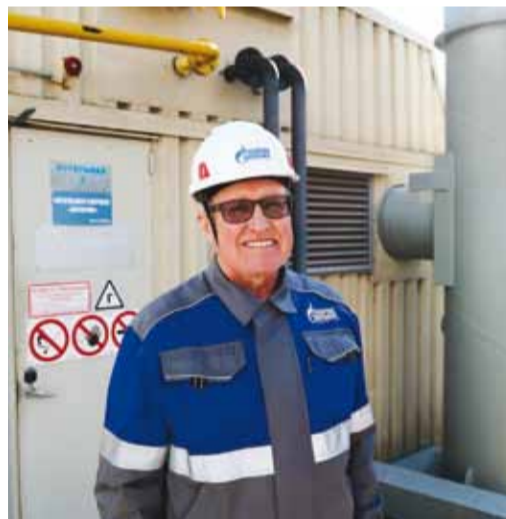
На работу – с улыбкой