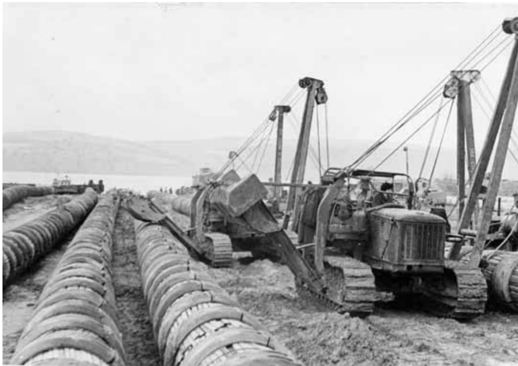
Строительство подводного перехода через Волгу

Помимо сложных погодных и бытовых условий, строители испытали немало дру-