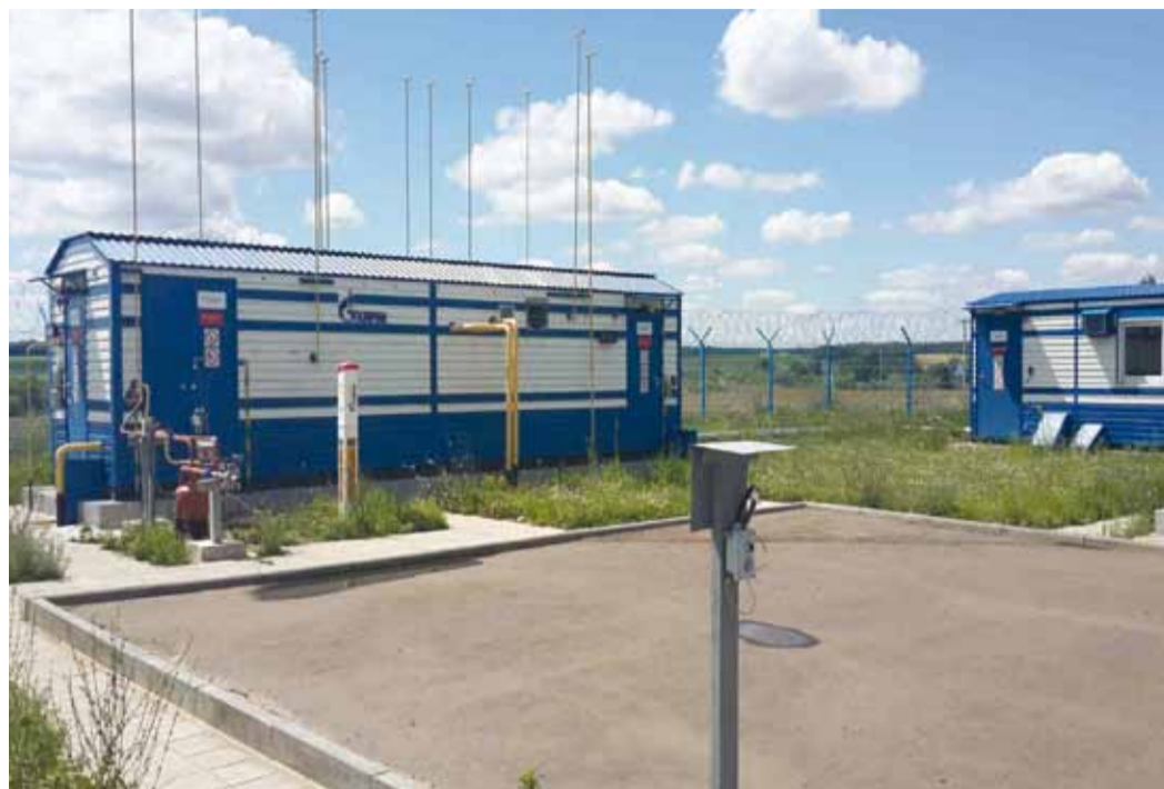
Газораспределительная станция «Даниловская». Реконструирована в 2018 году.

- Важен не сам статус, а реальные дела, практическая польза для региона. В соответствии с приоритетным проектом «Газпрома» - программой газификации России, деятель-