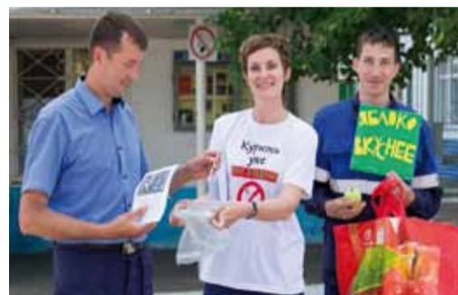
Вместо сигарет - сладости и фрукты

Корпоративная солидарность в поддержке здорового образа жизни также проявилась в участии коллег в акции «Конфета вместо сигареты», приуроченной к Международному дню отказа от курения. Сотрудники с вниманием слушали о вреде курения и способах избавления от вредной привычки.