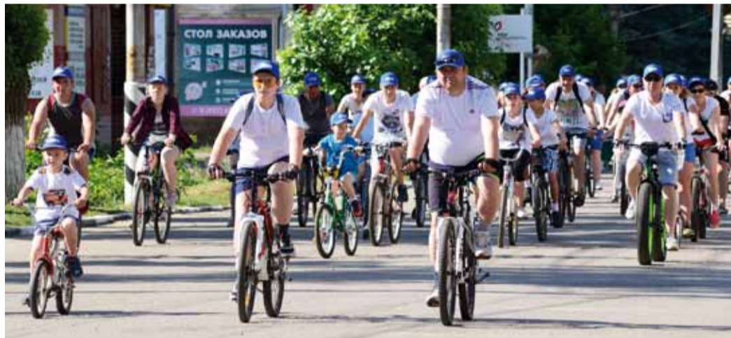
Работники Петровского ЛПУМГ приняли участие в массовом велопробеге ко Дню России

Победу завоевали «Торпеды», серебро досталось «Орлам», бронза – «Дельфинам». Однако проигравших не было, главный приз – яркие и добрые воспоминания о празднике остаются с участниками и зрителями в награду