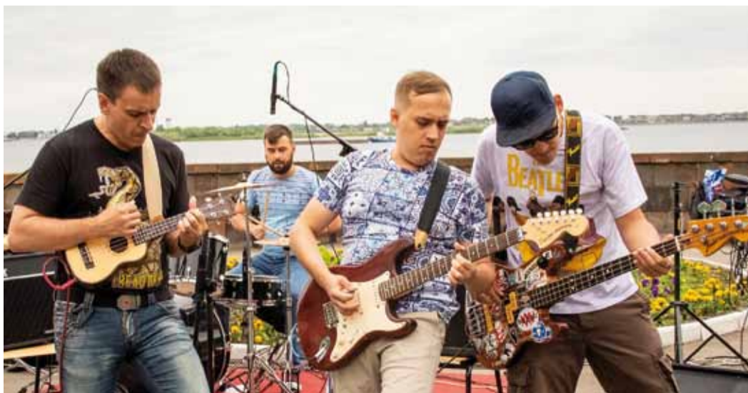
Музыка, как и природа, пробуждает в человеке самые светлые чувства и эмоции

Море положительных эмоций и откликов распространились в социальных сетях после праздника. Всего на сценах города выступили более 100 групп и исполнителей с композициями собственного сочинения.