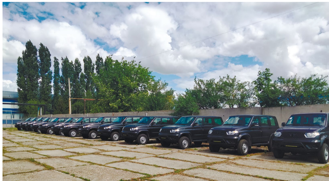
К распределению готовы