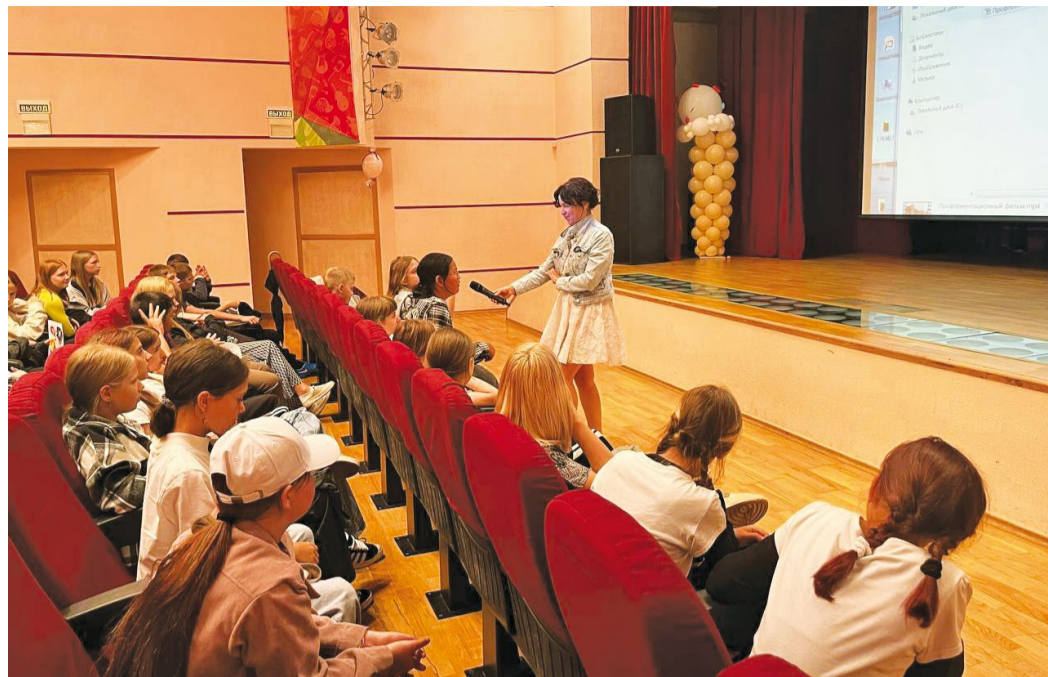
■ Отвечая на вопросы викторины