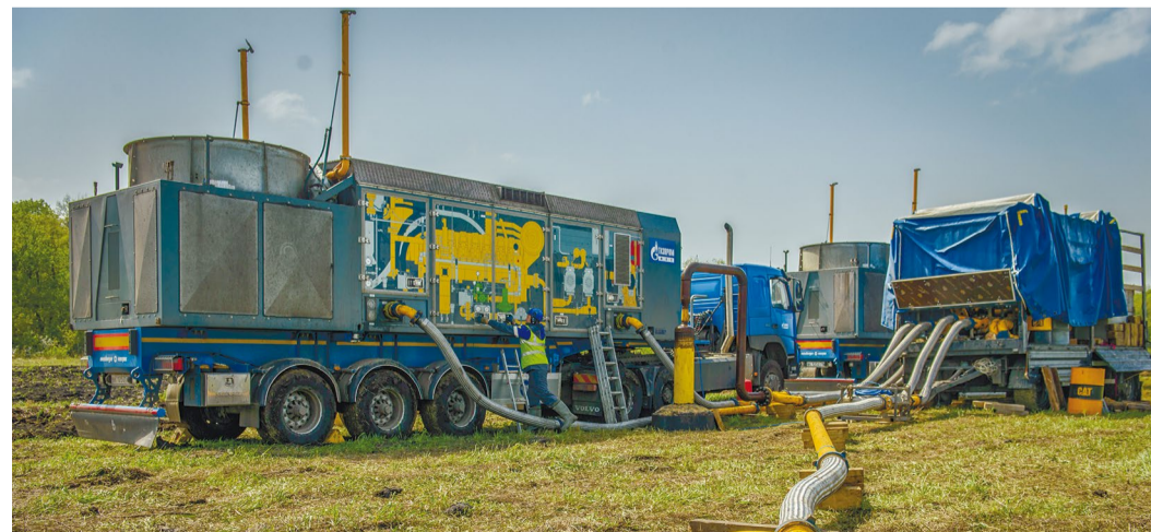
Мобильная компрессорная установка

Список наиболее актуальных вакансий размещён на официальном сайте ООО «Газпром трансгаз саратов»