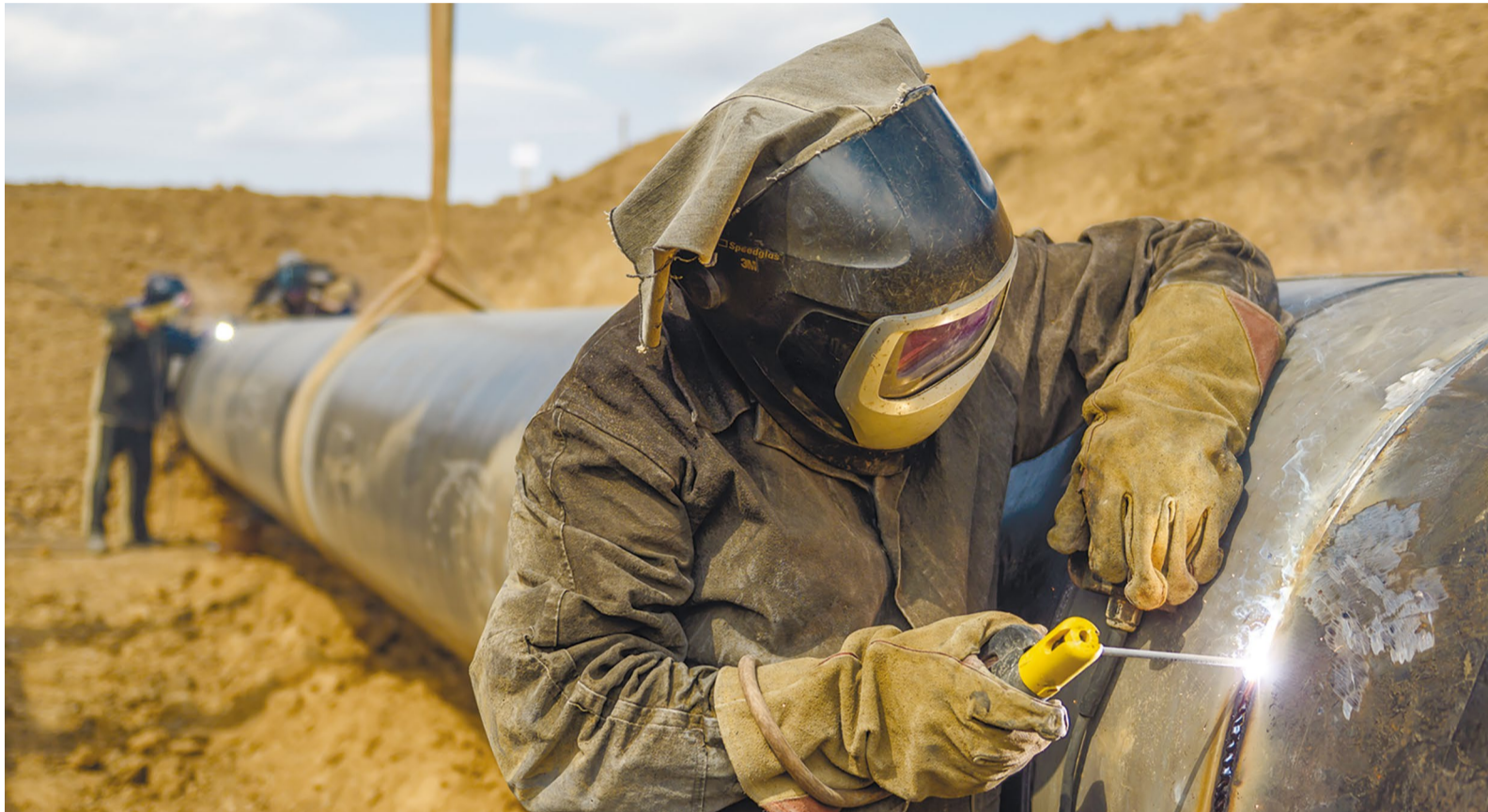
Огневые работы на линейной части МГ Петровск-Новопсков

В июне 2024 года филиалы Общества приняли участие в двух комплексах планово-предупредительных работ ПАО «Газпром».