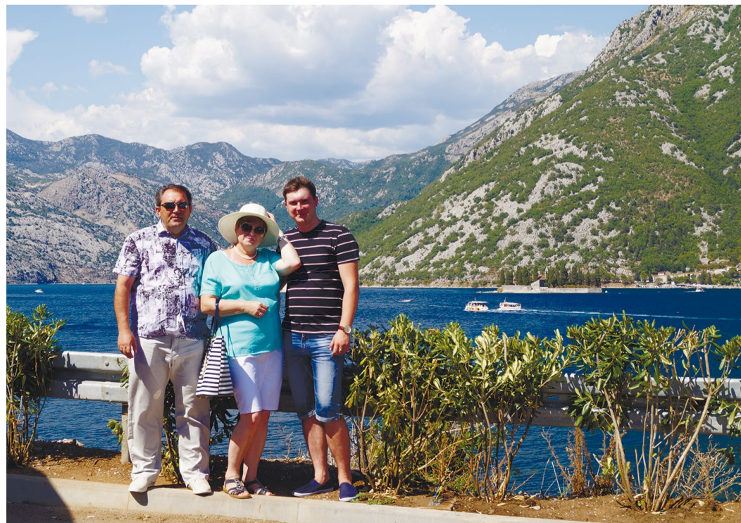
На отдыхе с женой и сыном