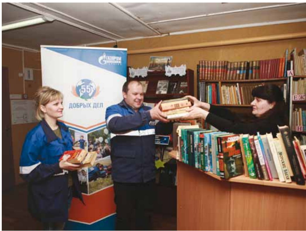
Работники Кирсановского ЛПУМГ передали более 800 книг местной библиотеке

Это уже вторая по счету благотворительная акция по сбору книг газовиками этого филиала в этом году. Всего библиотеке было передано более 800 книг разной тематики – от детской и обучающей литературы до редких произведений писателей-фантастов.