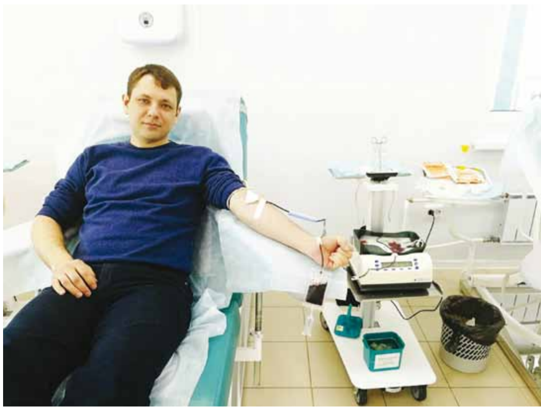
В донорской акции приняли участие около 40 работников Учебно-производственного центра и Управления связи

Напомним, что ежегодно донорами становятся сотни работников нашего предприятия, многие из них имеют звание «Почетный донор».