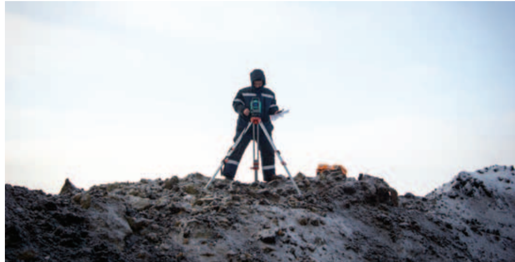
Выполняются инженерно-геодезические изыскания