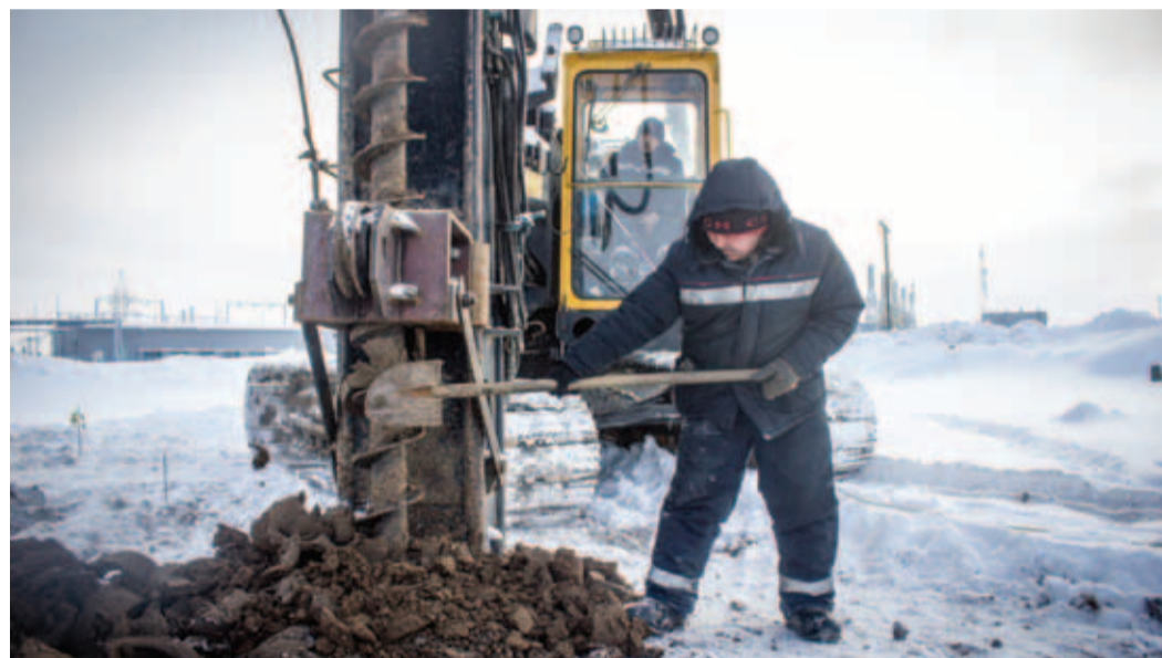
Бурение лидерных скважин на площадке АВО газа 1-й группы КС-25