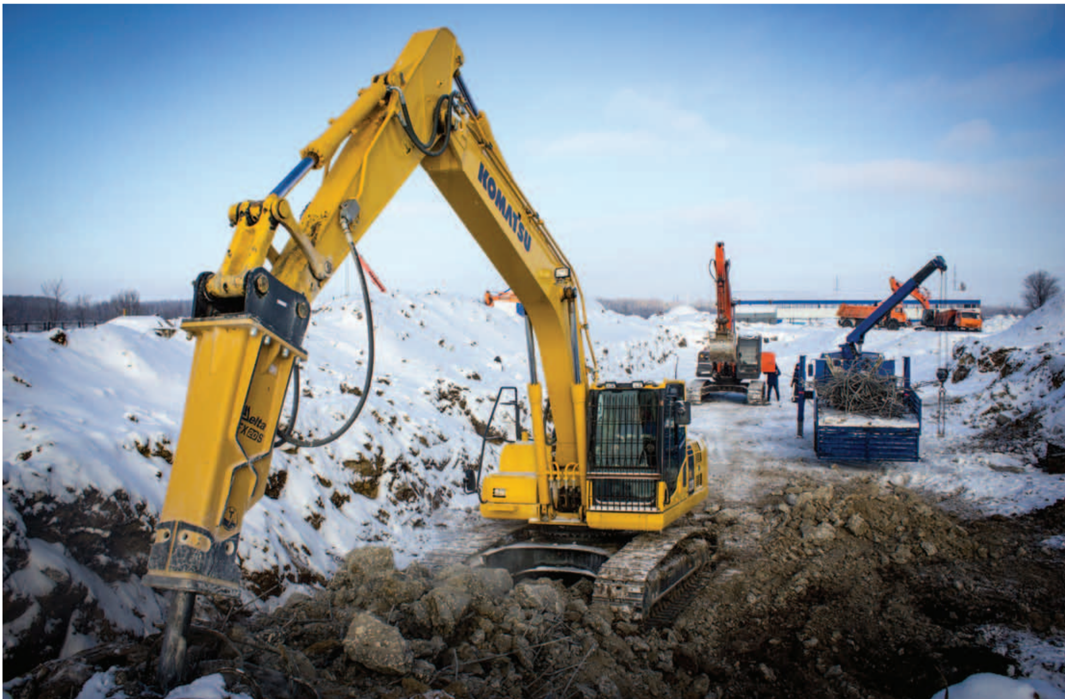
Демонтаж фундамента ЭГПА №5 компрессорного цеха №4