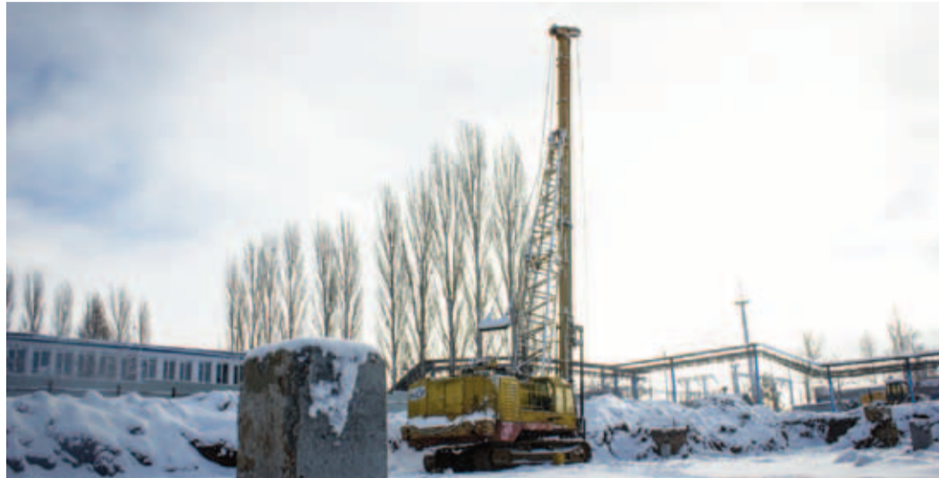
Контрольные сваи в котловане энергоблока КС-25