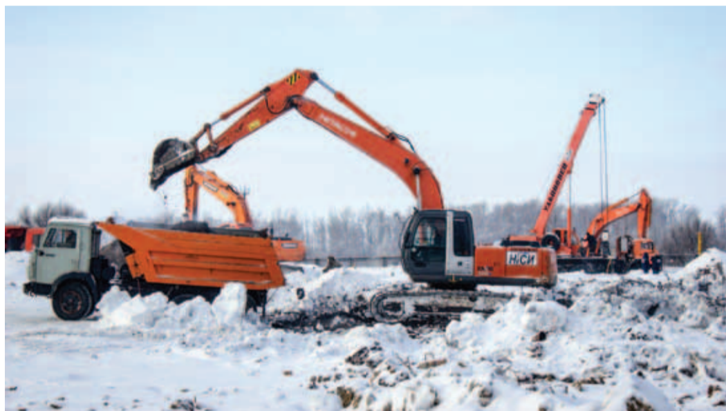
Земляные работы на стройплощадке