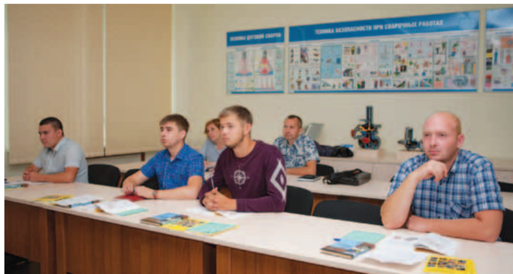
Повышение квалификации работников предприятия