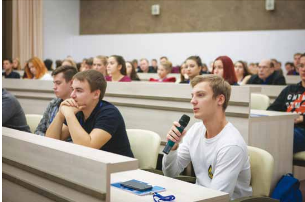
Количество вопросов из зала - показатель заинтересованности аудитории