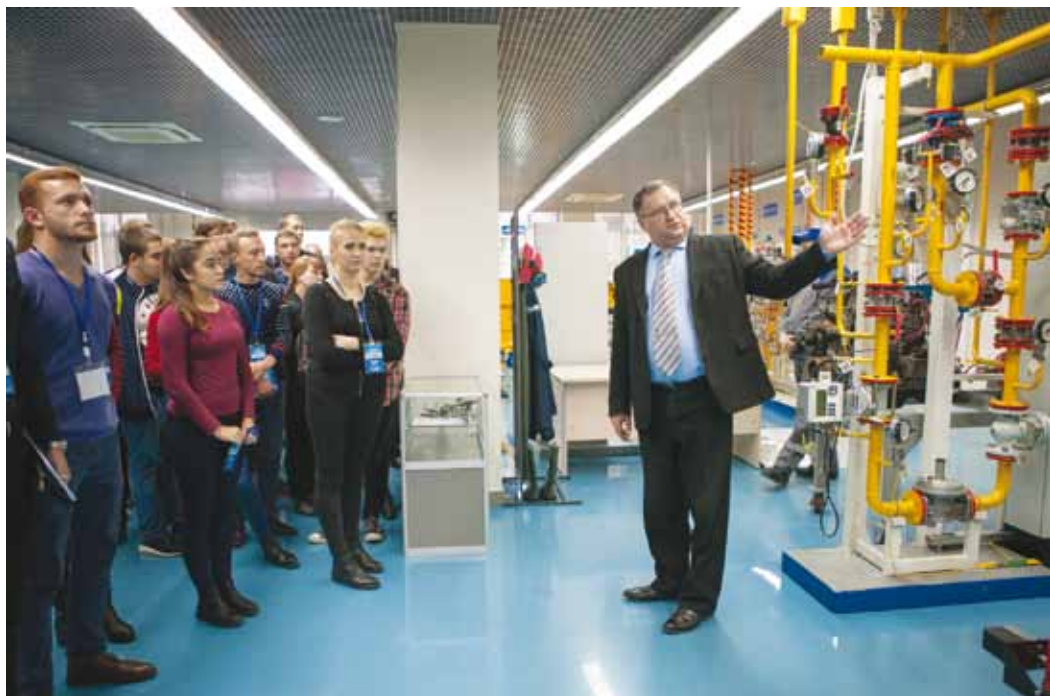
Студенты получили исчерпывающую информацию о газовых специальностях