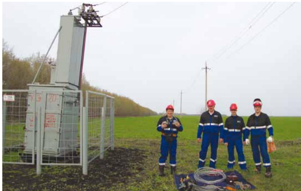
Работники службы защиты от коррозии Балашовского ЛПУМГ. Установка катодной защиты №20 199-й км м/г «Петровск - Новопсков»

В принципе, существует и график обязательных осмотров: два раза в год проводятся замеры потенциалов в контрольно-измерительных пунктах – рассчитывается защищенность, дважды в месяц производится осмотр катодных установок на линейной части газопроводов, еженедельно – на компрессорных и газораспределительных станциях. Но, как говорится, жизнь вносит свои коррективы, и командировки на трассу, работа на КС и ГРС порой растягиваются на гораздо большее время, превращая рабо-