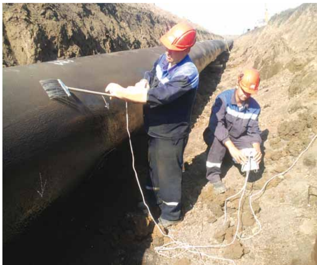
При помощи дефектоскопа искрового проводится проверка изоляционного покрытия на наличие дефектов

НАЧАЛО ЭРЫ КАТОДНОЙ ЗАЩИТЫ МОЖНО ДОВОЛЬНО ТОЧНО СОВМЕСТИТЬ С НАЧАЛОМ XX СТОЛЕТИЯ. ДЕЙСТВИТЕЛЬНО, В 1902 Г. КАРЛ КОЭН, ЗАТЕМ В 1908 Г. Х. ГЕППЕРТ СООРУДИЛИ ПЕРВЫЕ КАТОДНЫЕ СТАНЦИИ ДЛЯ ЗАЩИТЫ ТРУБОПРОВОДОВ. НО «ОТЦОМ КАТОДНОЙ ЗАЩИТЫ» АМЕРИКАНЦЫ НАЗВАЛИ РОБЕРТА КЮНА. В 1928 ГОДУ РОБЕРТ КЮН ПОСТРОИЛ ПЕРВУЮ КАТОДНУЮ УСТАНОВКУ И УСПЕШНО ОСУЩЕСТВИЛ ЭЛЕКТРОХИМИЧЕСКУЮ ЗАЩИТУ ОТ КОРРОЗИИ ПРОТЯЖЕННОГО СТАЛЬНОГО МАГИСТРАЛЬНОГО ТРУБОПРОВОДА В НОВОМ ОРЛЕАНЕ.