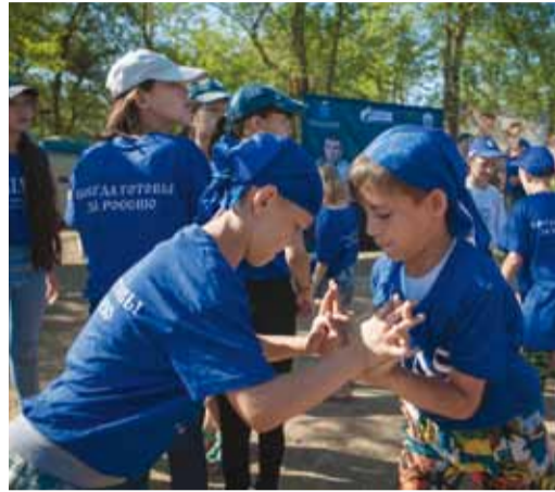
С ЗАБОТОЙ О ДЕТЯХ стр.4