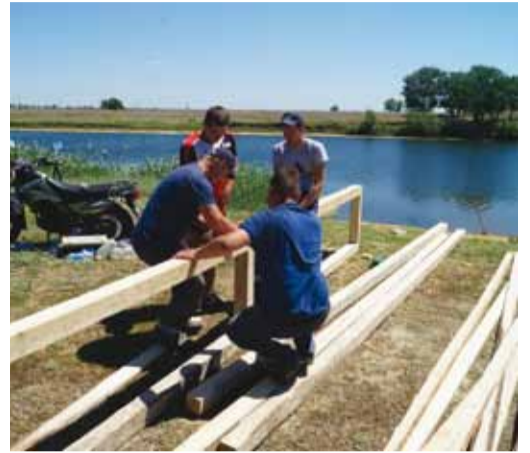
СОЛНЦЕ, ВОЗДУХ, ВОДА И НЕМНОГО ТРУДА стр.4