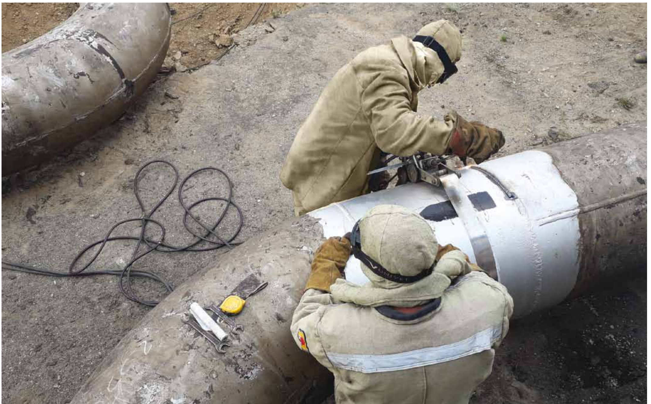
Производится подключение трубопроводной обвязки ЦБН ГПА №5 к выходному шлейфу второй группы КЦ №1 КС Алтай