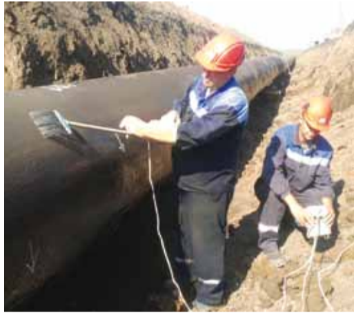
НА ЗАЩИТЕ ГАЗОВЫХ МАГИСТРАЛЕЙ стр.2